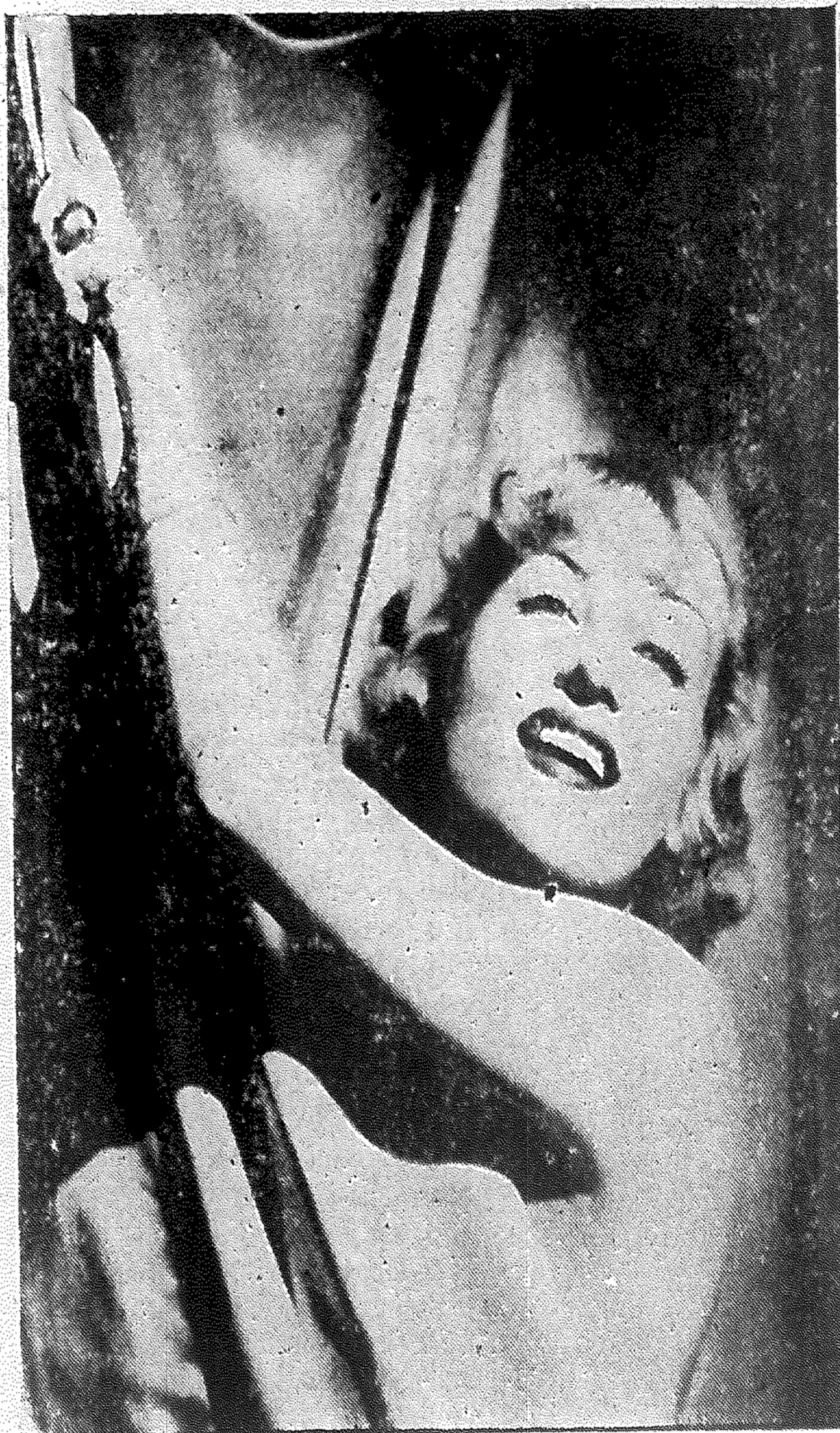
La Encantadora CAROLE LOMBARD