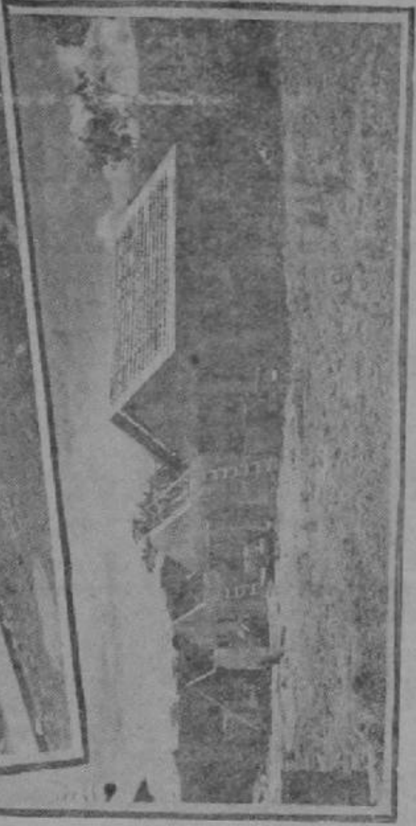
Aparecen en esta fotografía una serie de gráficas que ilustran la labor de construcción que está llevando a cabo el Seguro Social, arriba vemos un grupo de casas ya terminadas y que están prestando servicios a familias pobres. En el centro vemos una serie de casas de las que se sortearon el domingo 24, y abajo podemos contemplar unas casas en construcción y que pronto estarán contribuyendo a solventar el grave problema de la vivienda.

Una de las ilusiones que pone colorido e ilumina la vida del hombre, es la satisfacción de poder llamar suya la vivienda que prestó marco a sus días felices de casado y que hizo eco a los balbuceos de sus hijos.