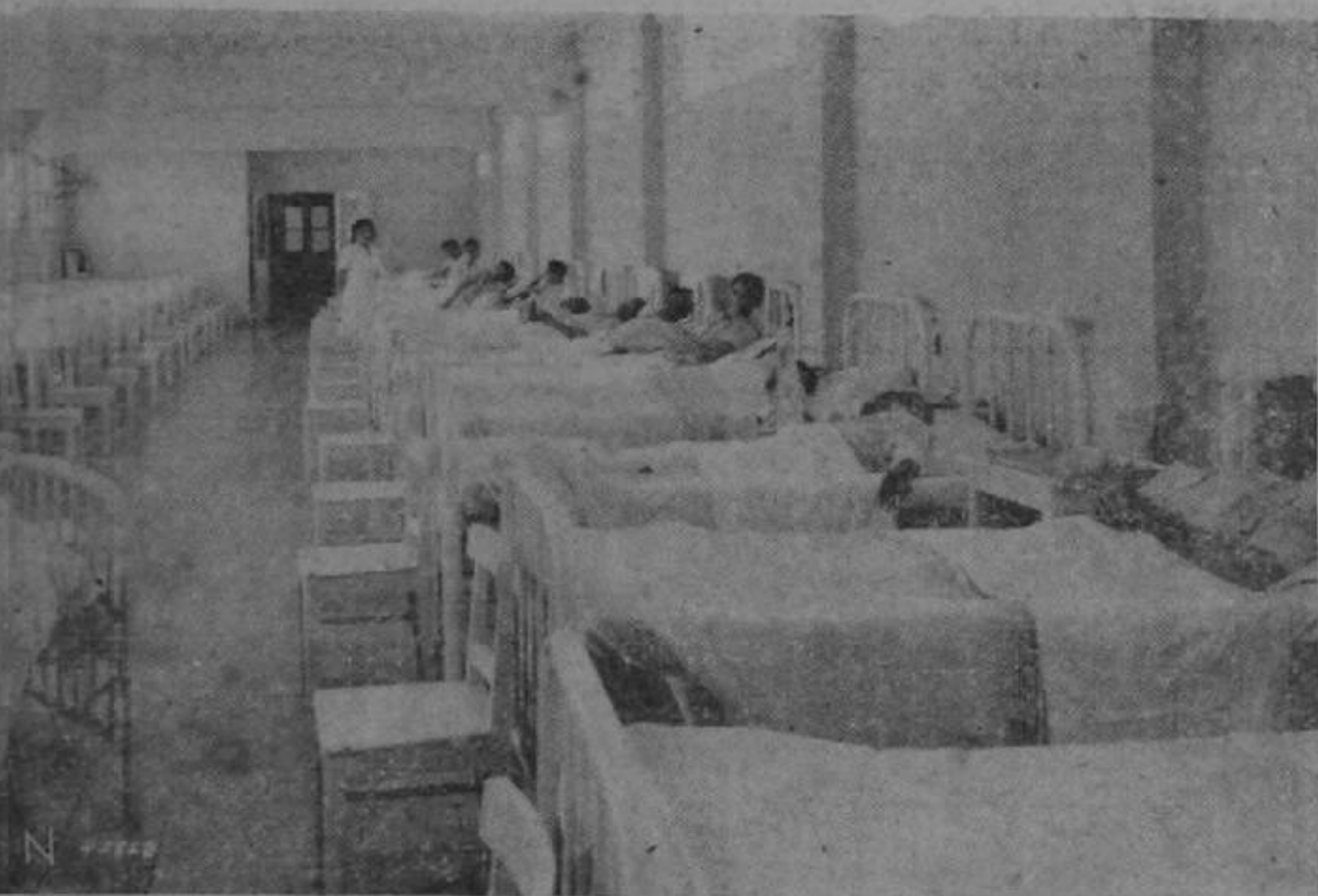
Pabellón de Hombres