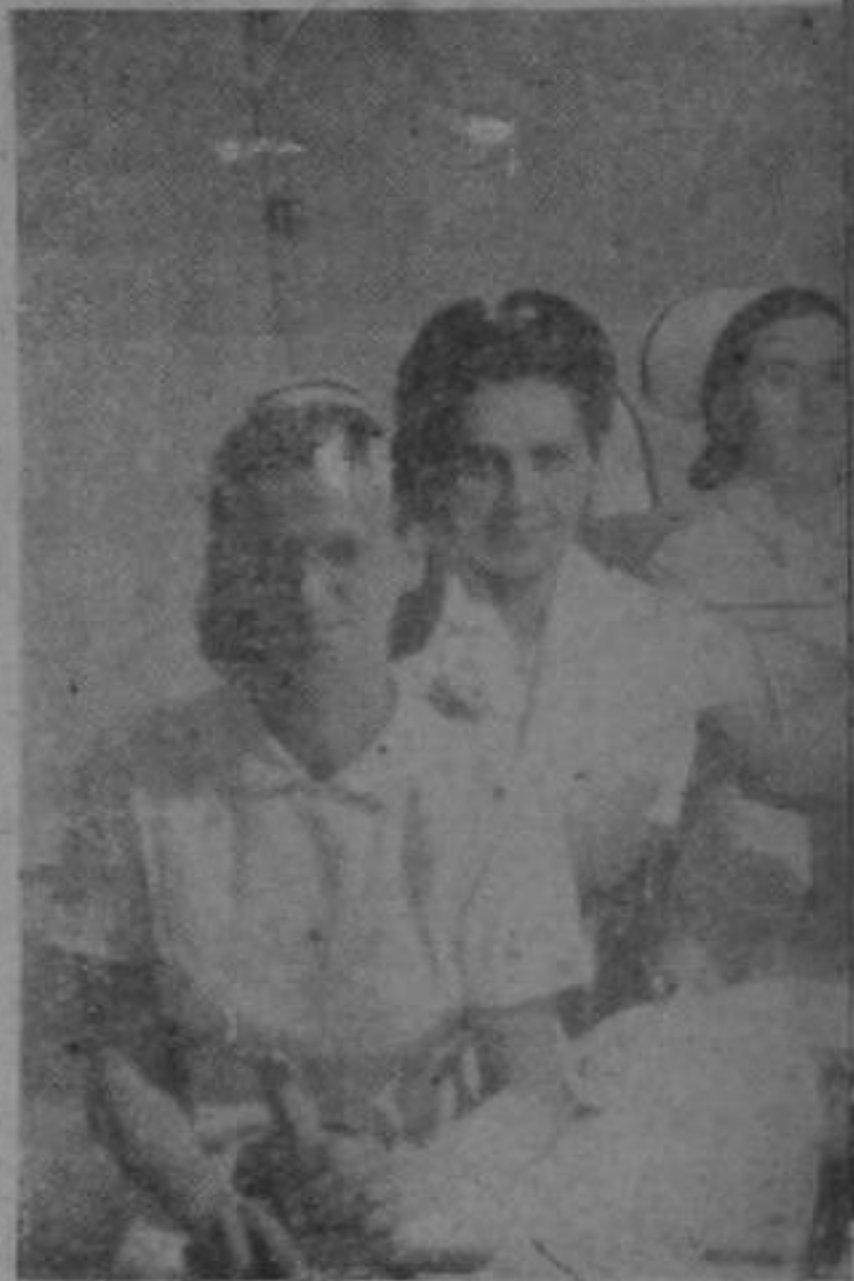
Personal de Enfermería de