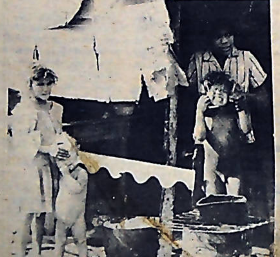
El desinterés del gobierno por resolver los problemas de los damnificados de los barrios del sur agrava aún más su crítica situación.

O Se conmemora el 13 aniversario de la caída del Comandante Ernesto "Che" Guevara. En las luchas de todos los pueblos explotados del mundo, vive por siempre su ejemplo de entrega, coraje y consecuencia revolucionaria. ¡Hasta siempre Comandante!