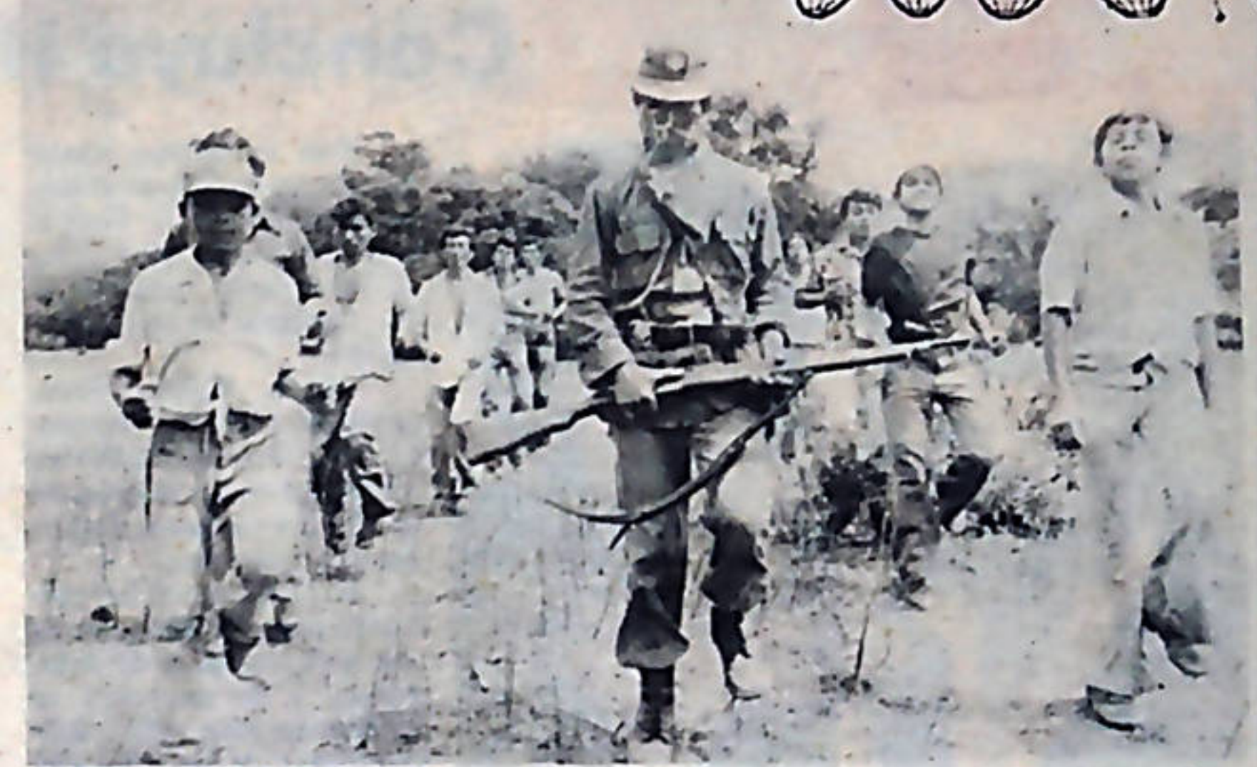
Las fuerzas guerrilleras se nutren cada día más de nuevos luchadores del pueblo que los fortalecen y unifican. El ejército por su parte se debate en una profunda crisis.