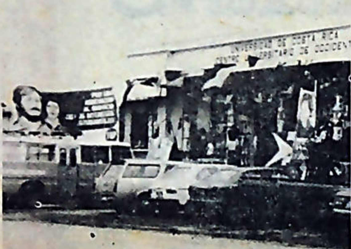
El Frente Estudiantil del Pueblo (FEP) ha mantenido siempre una política firme y consecuente en las luchas del movimiento estudiantil.

Nuestra organización no pretende excluirse de las fallas que presenta la UPA, pero es irresponsable y carente de toda seriedad y espíritu crítico el achacarnos la responsabilidad exclusiva de todos los errores y derrotas como pretendiendo hacer creer la JVC y aparecer ellos no sólo como los paladines de la unidad sino como los activistas sobre quienes ha caído todo el peso del trabajo. Y son precisamente esas apreciaciones no sólo al evaluar sino en su práctica