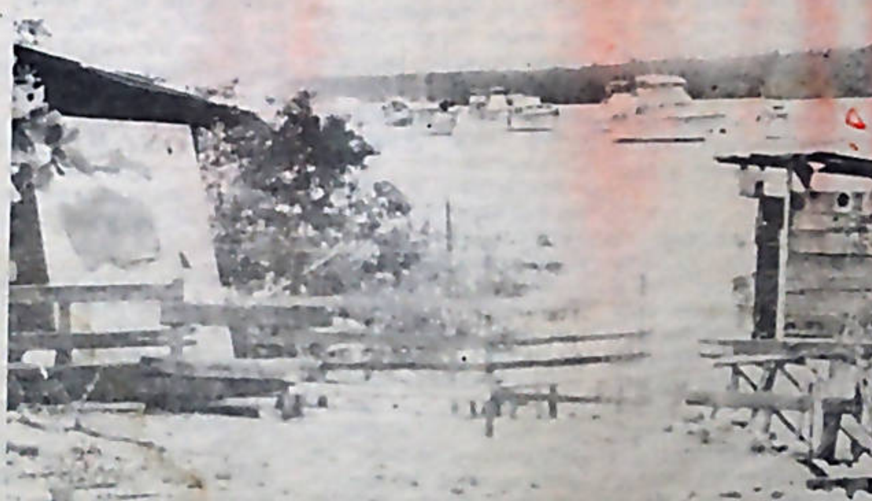
Imágenes de la "democracia" costarricense. Miseria para muchos que no poseen siquiera una casa decente y gran vida para muchos que se pasean en sus lujosos yates. Esta es la democracia que defienden la Ministra de Trabajo, la Liga Cívica de Mujeres y el Movimiento Costa Rica Libre. La foto es en Puntarenas.

Este conclave demostró claramente, cómo los sectores más antipopulares de Liberación Nacional y de la Unidad, se ponen de acuerdo para salvar el sistema económico, cuando éste entra en crisis.