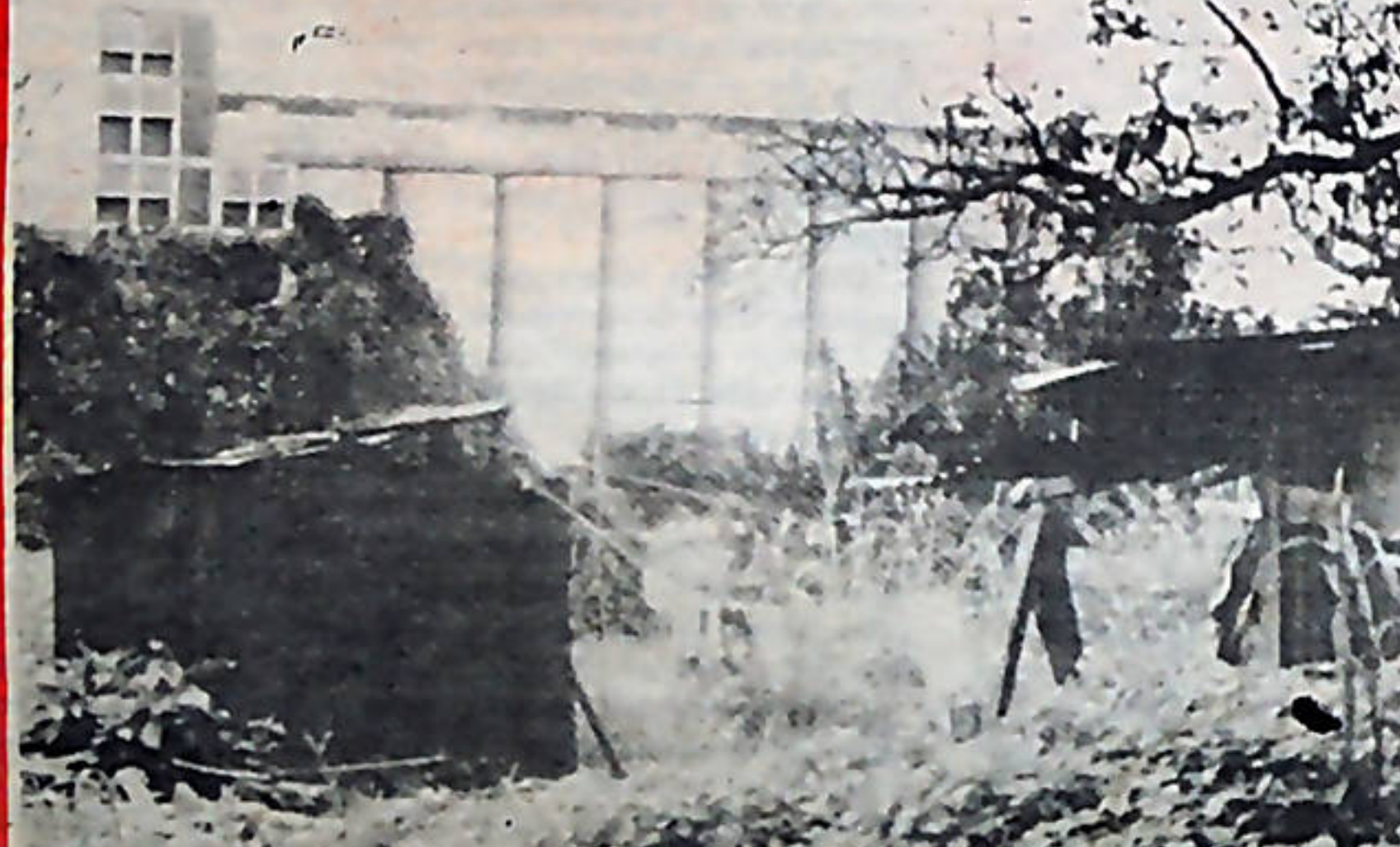
Como un regalo de Navidad para los hogares humildes del pueblo, el gobierno de Carazo aumentó los precios de la harina. En la foto atrás los Molinos de Costa Rica, donde se produce la harina.

No ha tenido el menor escrúpulo a la hora de beneficiar al gran capital, que hizo posible el triunfo del Partido Unidad en las pasadas elecciones.