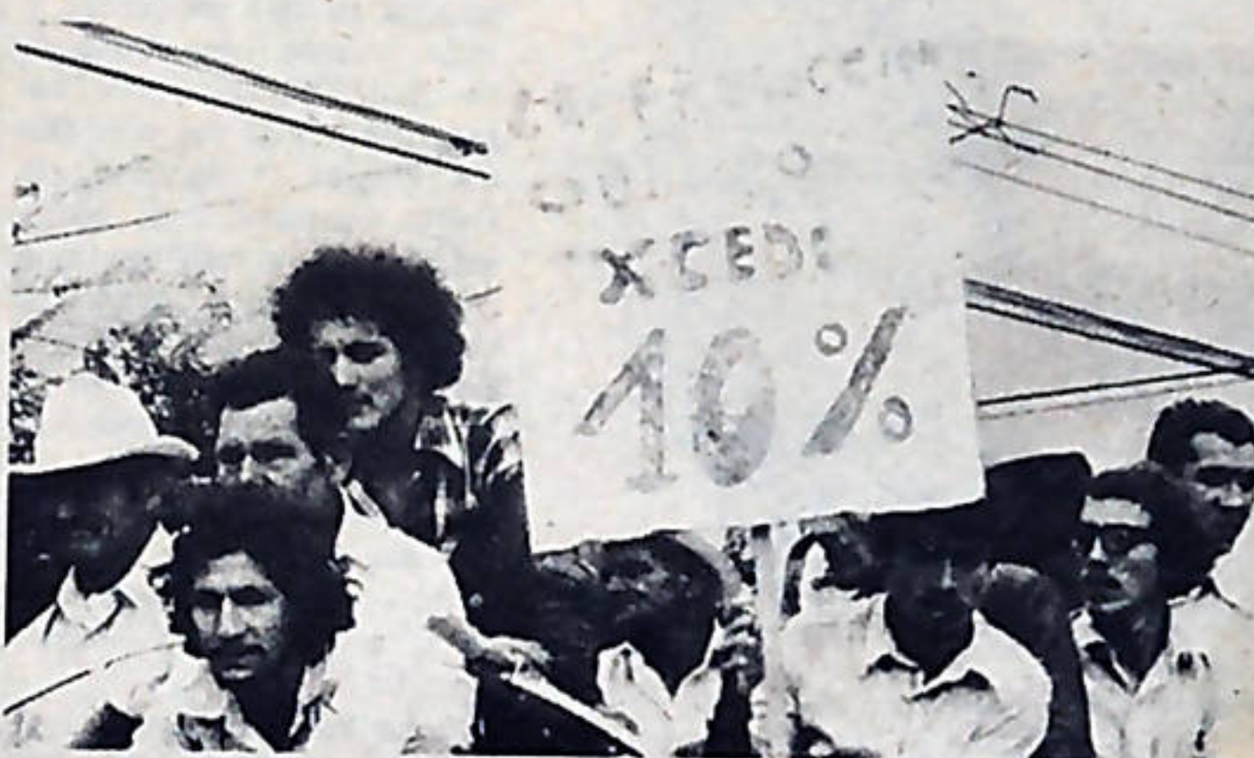
La crisis económica, de la cual son responsables los últimos gobiernos, sigue golpeando de manera directa los bolsillos de las capas medias. El pasado lunes 18 de agosto, un numeroso grupo de cafetaleros escenificaron una marcha en San José.