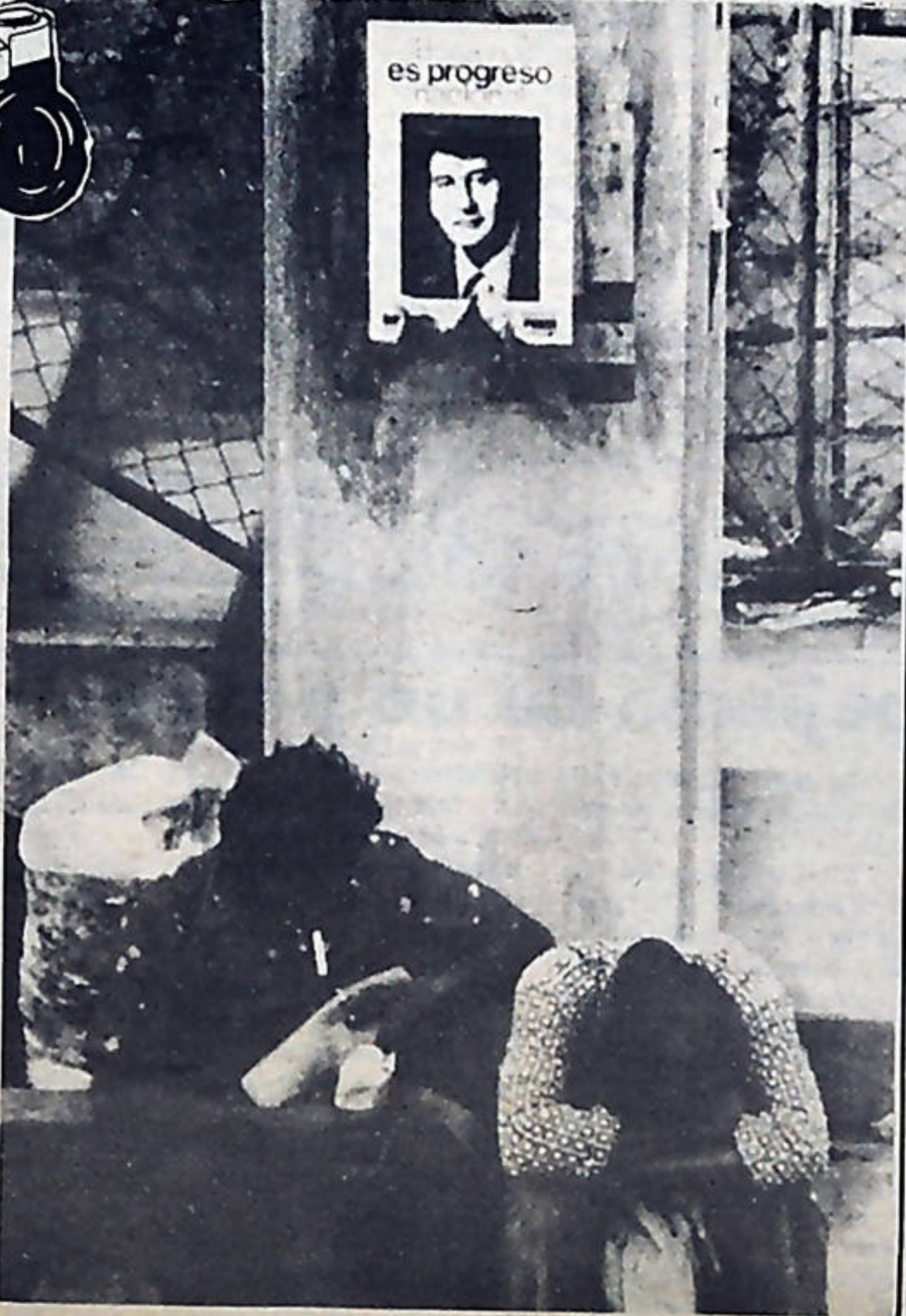
La politiquería de nuevo a la orden del día. Mientras los millonarios siguen demostrando su total incapacidad para resolver los problemas del pueblo, los politiqueros han iniciado, como cada cuatro años sus campañas de repugnante demagogia.