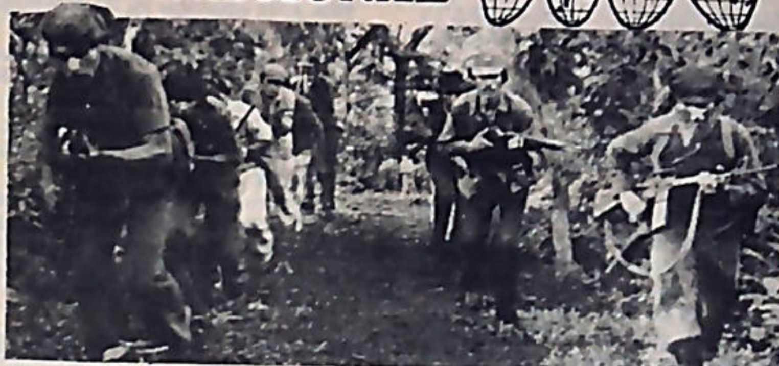
La unidad de las organizaciones revolucionarias guatemaltecas es el signo de mayor esperanza del pueblo en su lucha por su liberación definitiva.