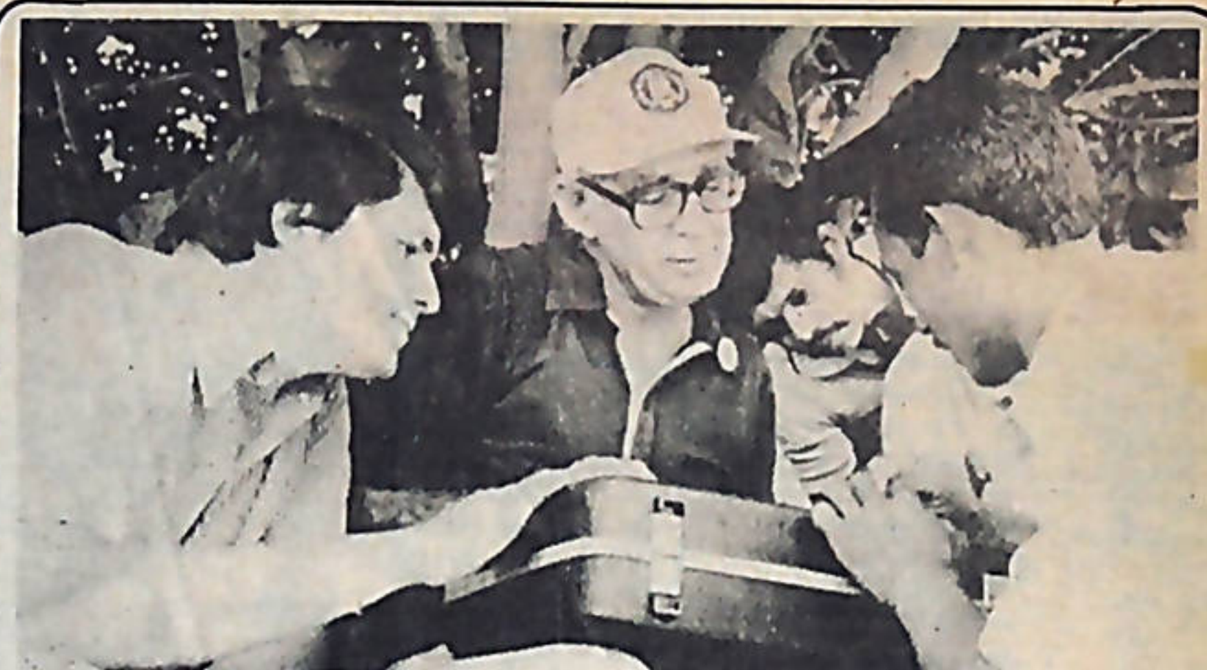
Un campesino, con evidente emoción, muestra al padre Fernando Cardenal, quien es el responsable de la Campaña de Alfabetización y a Sergio Ramírez Mercado de la Junta de Gobierno, todo lo que ha aprendido, desde que el gobierno nica inició la campaña.

Hoy vuelve a la orden del día la lucha contra la Enseñanza Privada, ahora por el dictamen de mayoría afirmativo emitido por la Comisión de Asuntos Sociales de la Asamblea Legislativa, a la así llamada LEY DE UNIVERSIDA-