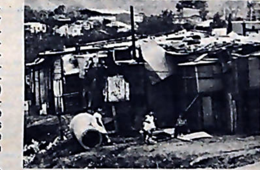
Mientras el problema de la vivienda se agrava, en el INVU siguen los negocios "turbios".