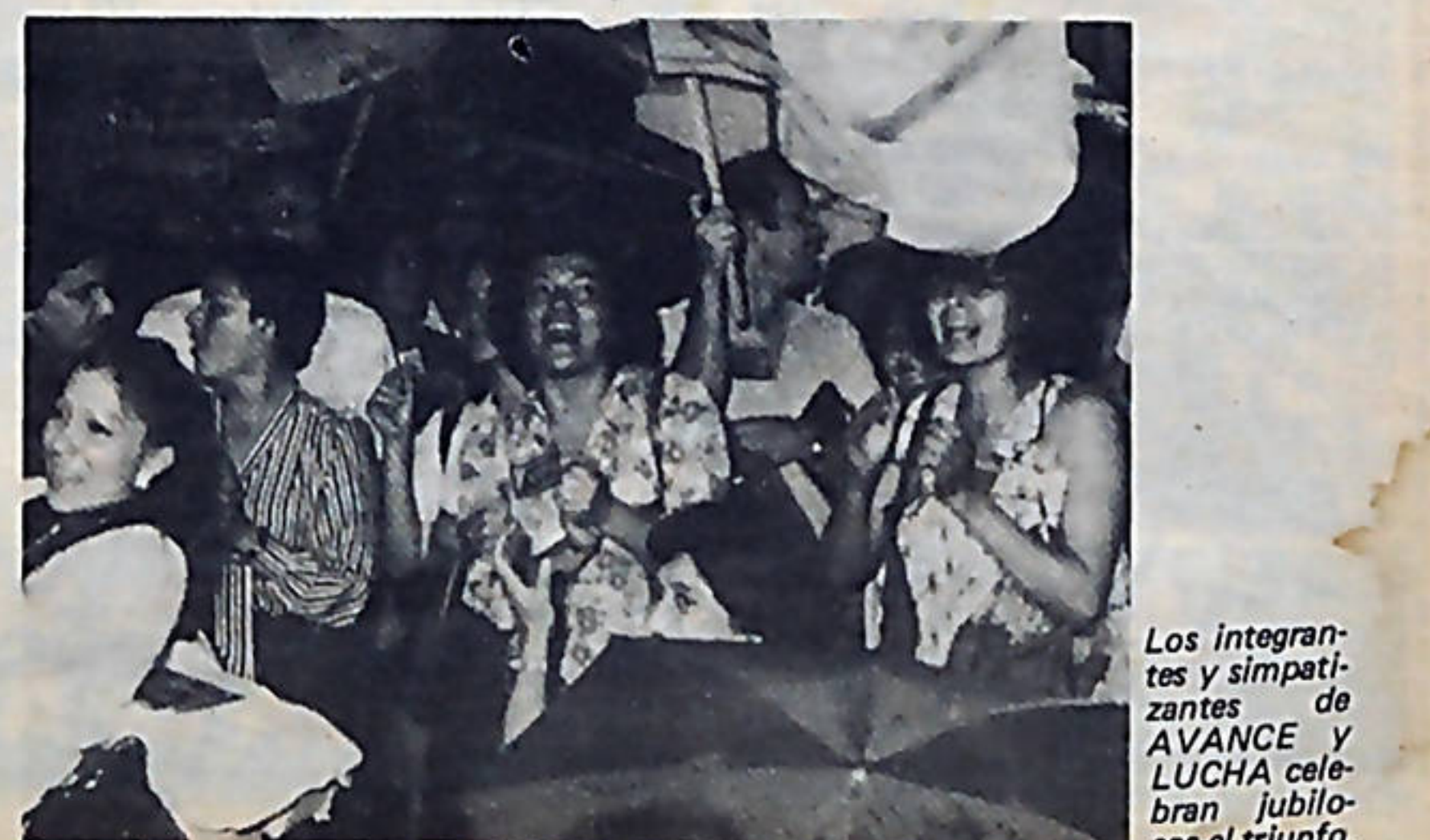
Los integrantes y simpatizantes de AVANCE y LUCHA celebran jubilosos el triunfo.