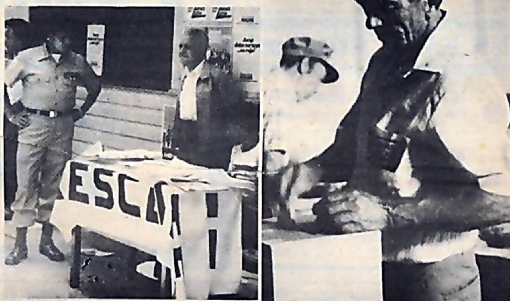
Mientras el gobierno presionó a los guardias civiles y rurales a que fueran a votar por "Rescate", los empleados públicos que votaron por AVANCE-LUCHA lo hicieron de manera consciente y sin ningún tipo de presión.

Al respecto, Araya continuó aseverando que cada vez se hacía más claro que, en Costa Rica, los trabajadores no deben limitarse únicamente a reclamar aumentos salariales, sino que deben ir preparando condiciones para luchas de mayor alcance, que conlleven cambios democráticos profundos, que aseguren en el futuro la conformación de una sociedad de trabajadores.