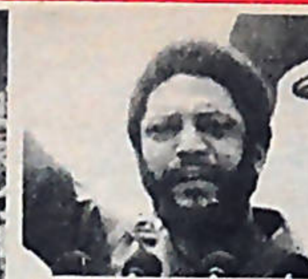
Maurice Bishop, Primer Ministro de Granada.

Cañones, morteros, antiaéreas, lanzacohetes, tanques, tanquetas, helicópteros y aviones de combate arrebatadas ayer a la sangrienta tiranía, hoy en manos de un pueblo dispuesto a defender con su propia sangre la Revolución, con la misma firmeza con que el General de Hombres Libres gritó al ejército de ocupación yanqui: "Yo quiero Patria Libre o Morir".