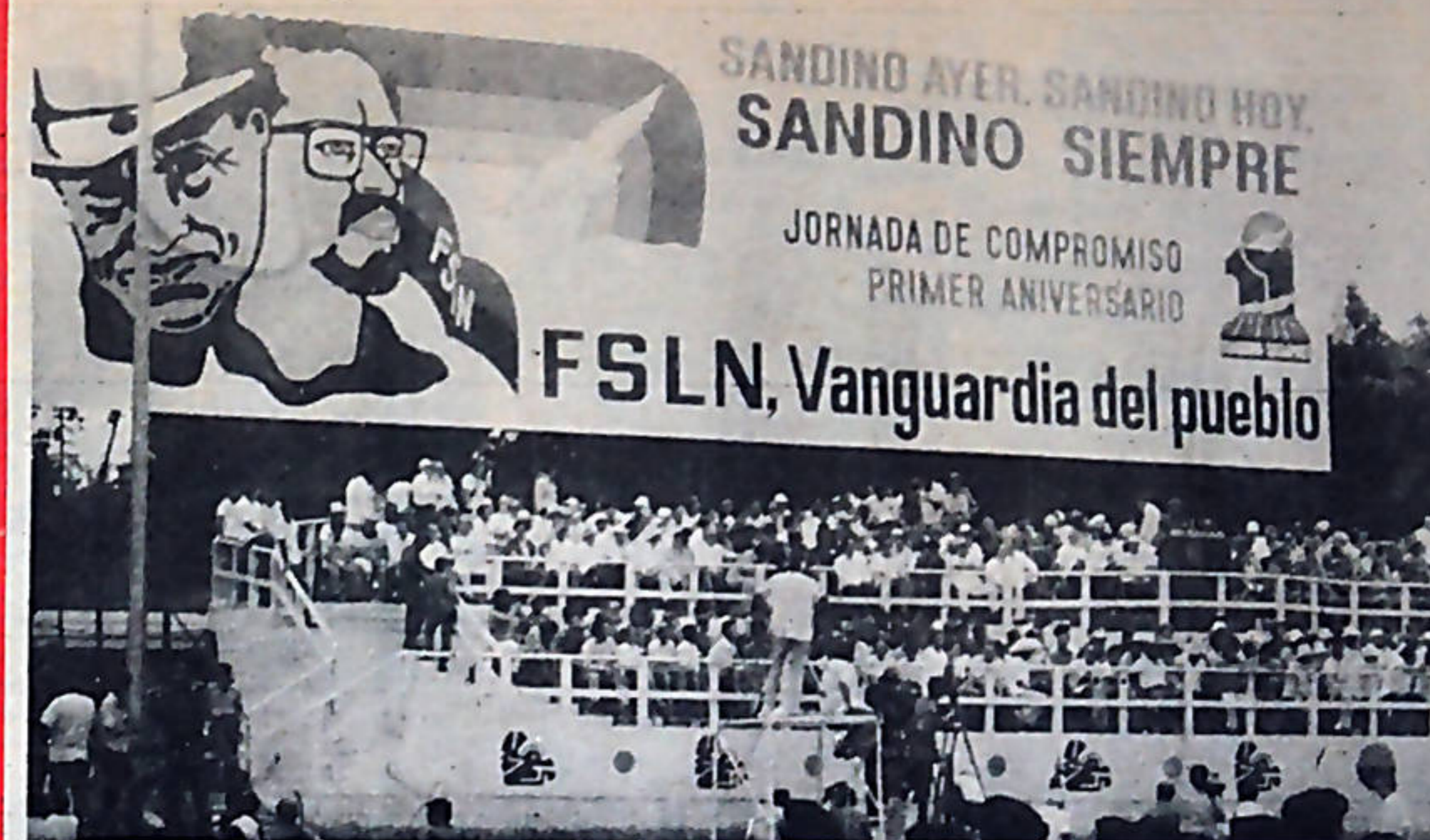
El extraordinario acto del Primer Aniversario, fue presidido por la Dirección Nacional del Frente Sandinista de Liberación Nacional (FSLN), la Junta de Reconstrucción Nacional, los Comandantes Guerrilleros y personalidades y delegaciones de gobiernos y partidos de diversas partes del mundo.