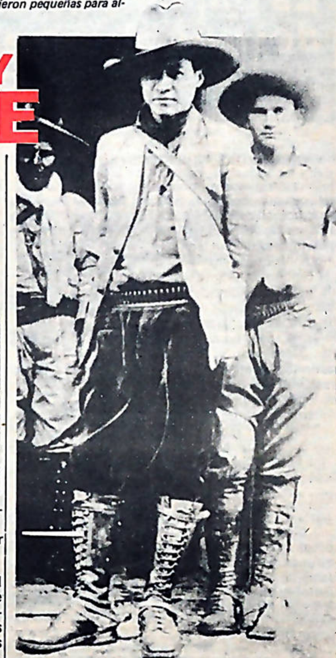
Augusto César Sandino, General de Hombres Libres.

Razonando sobre la necesidad de una profundización de la transformación del agro en Nicaragua que se plasmaría por medio del proyecto elaborado por la Junta de Reconstrucción sobre Reforma Agraria y el Uso Racional de la Tierra, Ortega dijo que "no es posible que mientras hay campesinos que tienen que escharbar entre piedras para poder sembrar, existan latifundistas y grandes propietarios con tierras fértiles a las que no dan ningún uso, limitándose a su contemplación. Por esta ra-