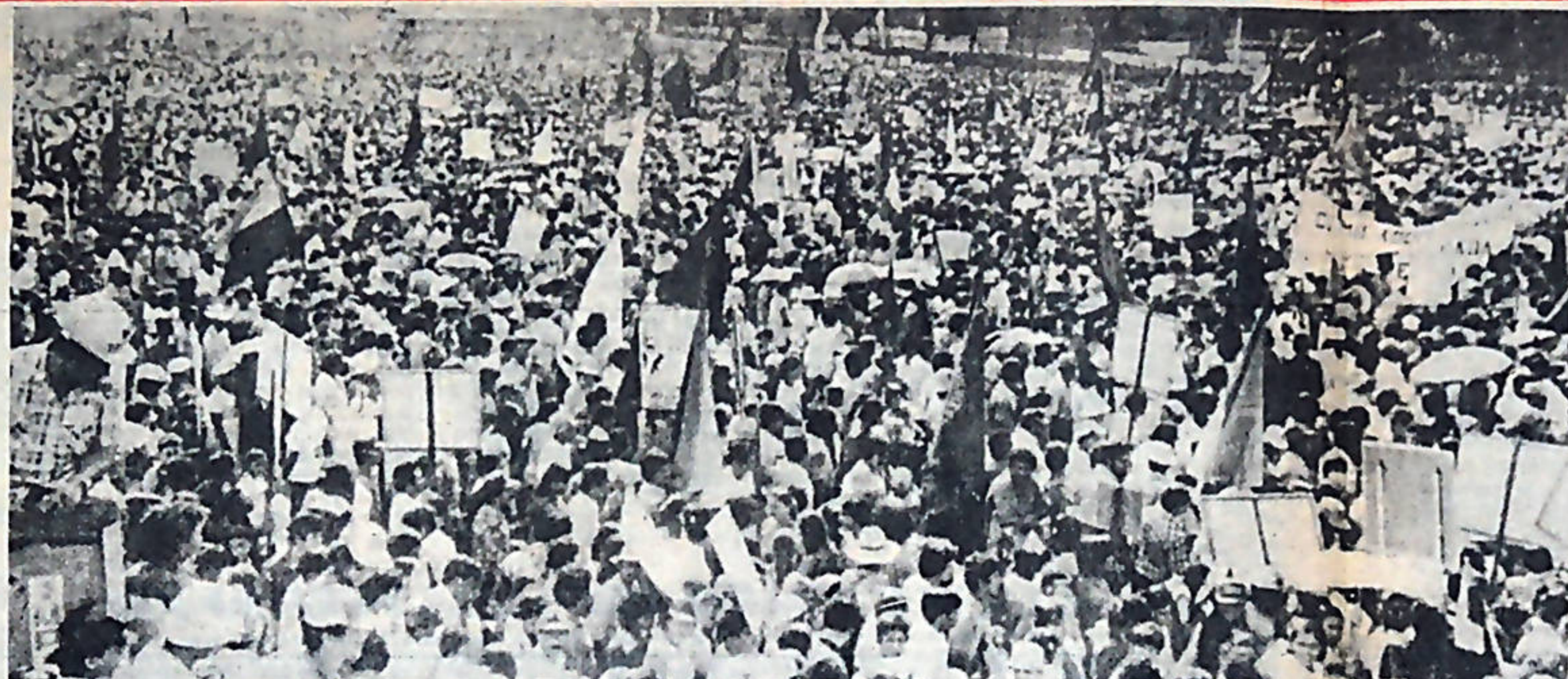
Las cinco hectáreas de la recién construida Plaza 19 de Julio, se hicieron pequeñas para albergar al más de medio millón de nicaragüenses.