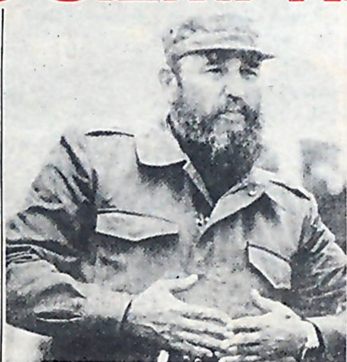
Comandante Fidel Castro Ruz, siempre solidario con la causa del pueblo de Sandino.

El discurso central estuvo a cargo del Comandante de la Revolución y miembro de la Junta de Reconstrucción Nacional, Daniel Ortega quien hizo un extenso análisis histórico de la lucha del pueblo nicaragüense por su libertad, desde las gestas de 1812 en contra del dominio español, pasando por la lucha de aquel pequeño ejército descalzo jefeador por el General de Hombres Libres, Augusto César Sandino y cuyas banderas libertarias fueron hereda-