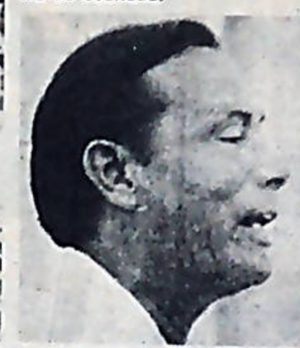
George Price, Primer Ministro de Belice.