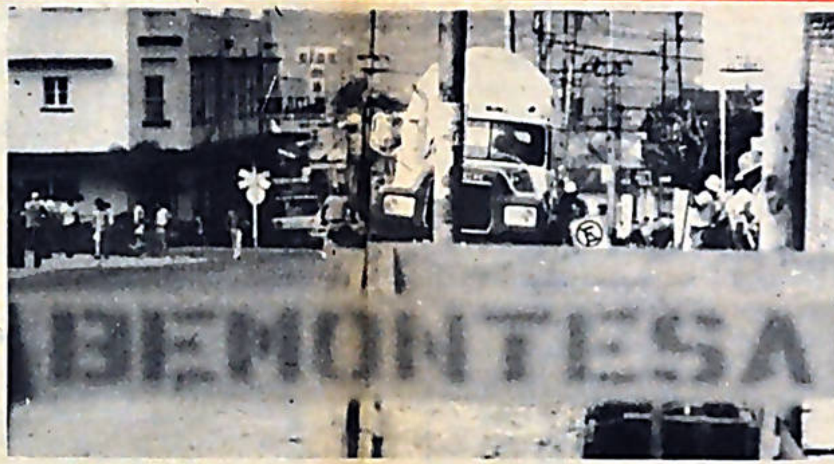
La compañía constructora BEMONTESA ha sido beneficiada con dinero de RECOPE, mientras esta institución solicita préstamos millonarios en bancos extranjeros.

Por otro lado, en la misma comisión legislativa, se denunció que con las pérdidas que sufre RECOPE en algunos rubros se benefician dos grandes compañías privadas, la Industria Nacional de Cemento S.A. y la Tropigás, empresa en la que tiene