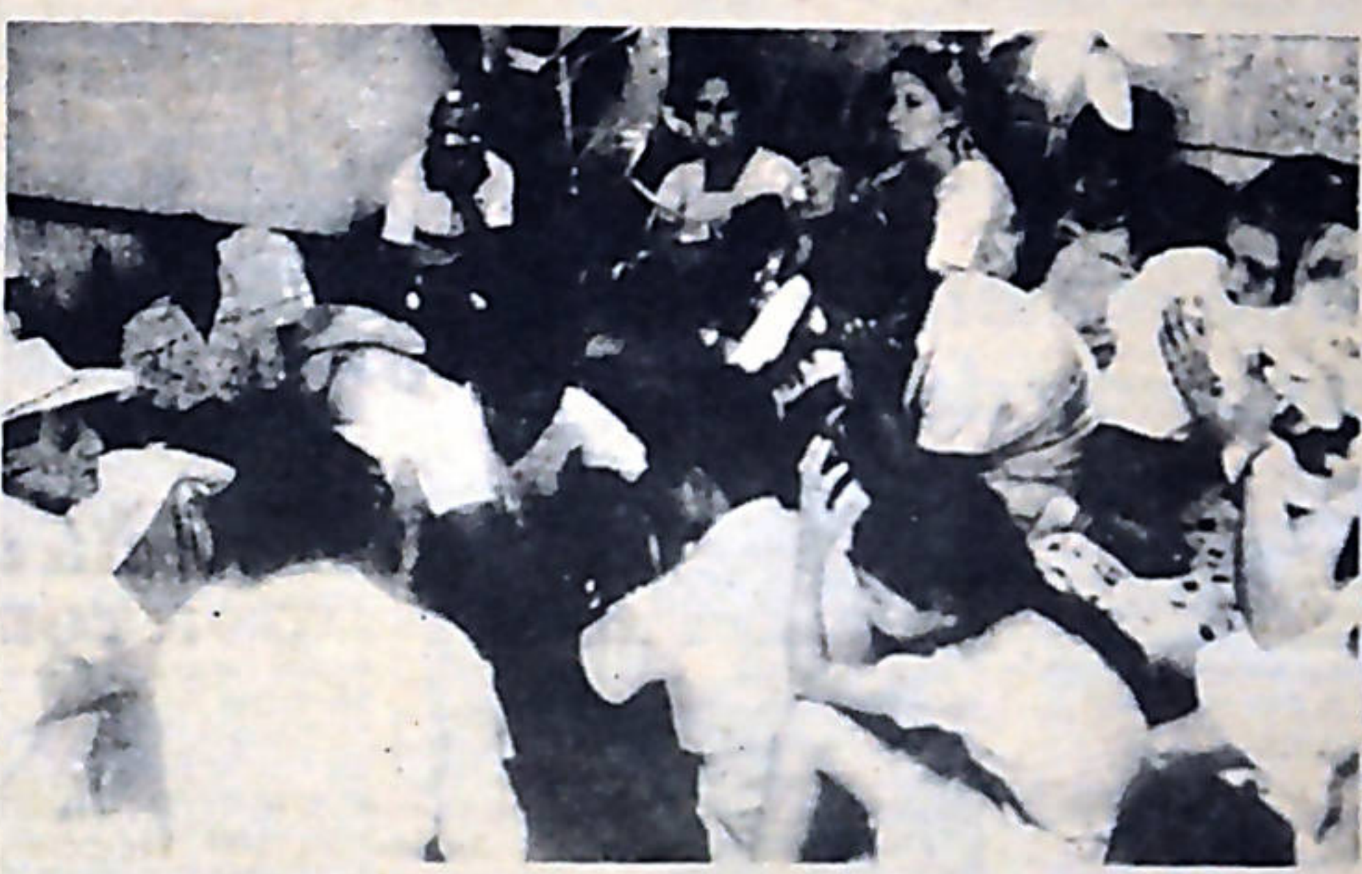
Cien campesinos más se han aislado en la Embajada de Costa Rica en San Salvador debido a la brutal represión y el terror implantado en ese país por la junta militar.

La situación de RECOPE está más oscura que el petróleo que refina, y es una muestra contundente de los grados de profunda corrupción que carcomen a este gobierno, que ya sobrepasa las cimas de corrupción alcanzadas por los anteriores gobiernos liberacionistas.