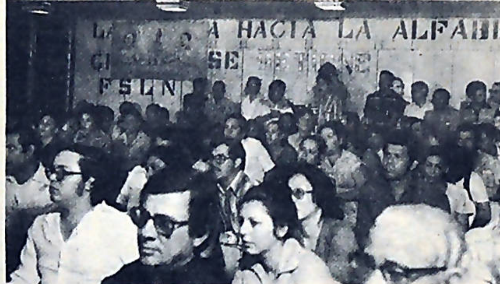
Hoy, el pueblo nicaraguense no solo cuenta con múltiples instrumentos de organización popular que garantizan su participación democrática, sino que tienen instrumentos tan valiosos como el programa "De Cara Al Pueblo", por medio del cual, dialoga con sus dirigentes y les plantea sus críticas y preocupaciones.

"No hay revolución, sin contrarrevolución". Y afirma enfático: "Cada intento contrarrevolucionario lo aplastaremos. Una por una, a esas bandas asesinas que quieren regresar al pasado, las aplastaremos, como ya lo hemos hecho con otras bandas ligadas al Frente Armado Demo-