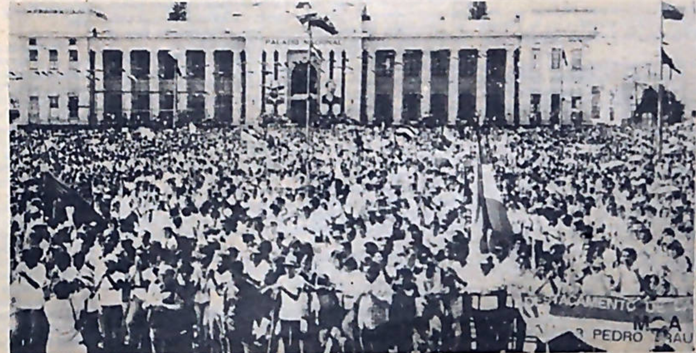
La revolución sandinista ha construido en toda la geografía nicaraguense la guerra contra la ignorancia.