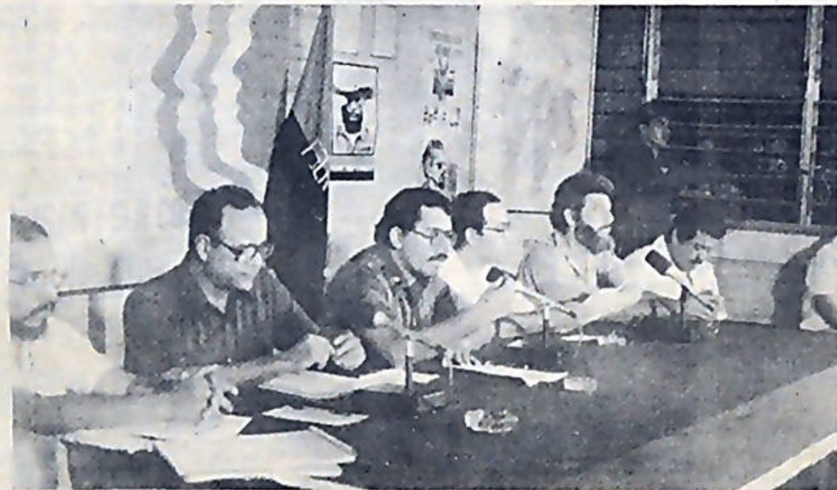
El Comandante de la Revolución Daniel Ortega y Arturo Cienfuegos, ambos miembros de la Junta de Gobierno de Reconstrucción Nacional, y otros representantes del gobierno, en el IV Programa "De Cara al Pueblo".