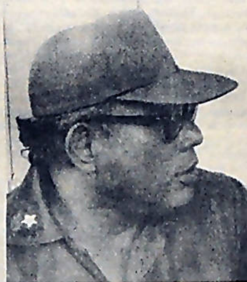
Tomás Borge Martínez, Comandante de la Revolución y Ministro del Interior.

Luego, el dirigente revolucionario recordó que hace más de un siglo, el filibustero norteamericano William Walker publicó un periódico con el nombre de "EL NICARAGUENSE". "Hoy, los vendepatria, enemigos acérrimos del pueblo, publican en Miami un periódico cobijado con idéntico nombre en el que, hasta elo-