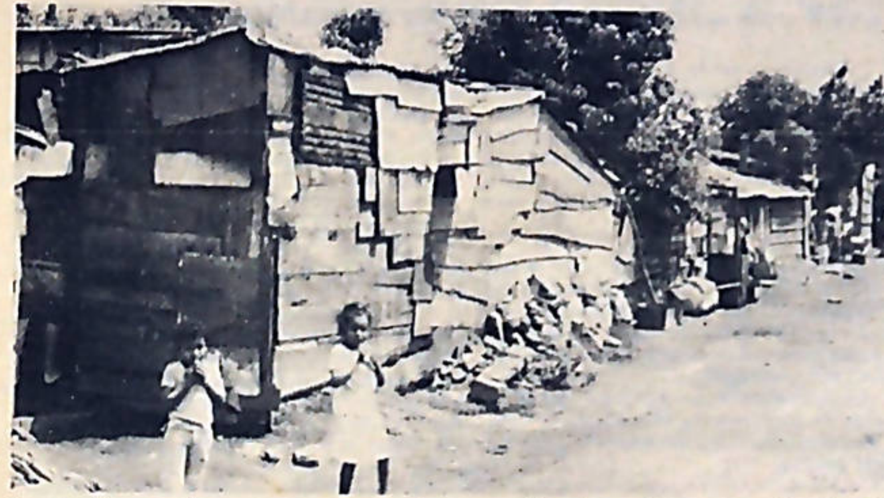
La tiranía somocista, con su guerra sucia y genocida, destruyó centenares de vivienda, agravando aún más el problema del déficit habitacional que sufre Nicaragua.