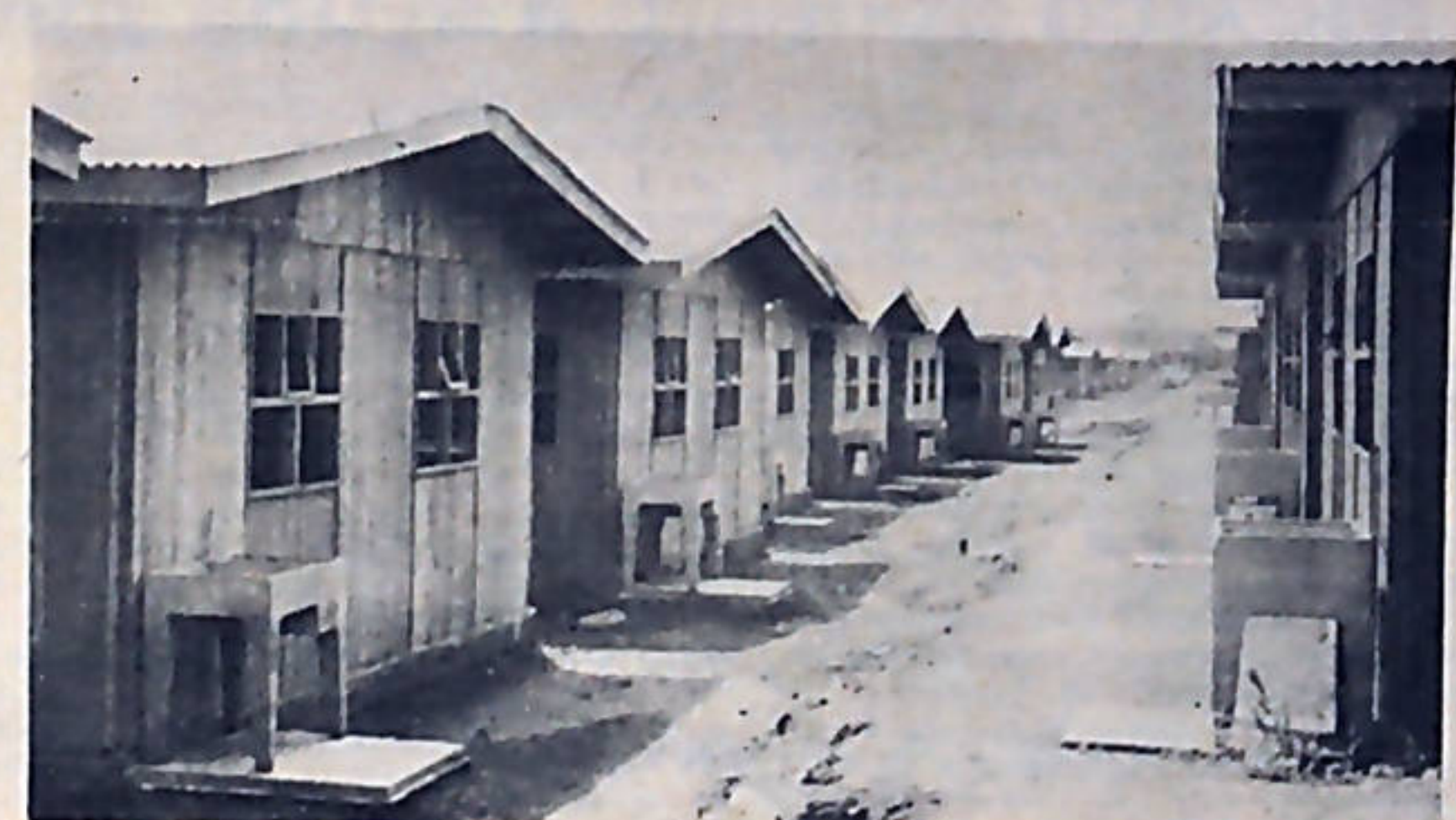
En poco tiempo, gracias al esfuerzo del pueblo, muchos nicaraguenses tendrán, con grandes facilidades, su propia vivienda.

"Nosotros no nos metemos con esa ayuda militar. Los mismos revolucionarios salvadoreños no están interesados en que los ayudemos. Ellos quieren evitar pretextos e igual que nosotros lo hicimos, ellos sabrán, por sus propios medios, armarse", dijo. Y concluyó: "Nosotros no tenemos la culpa que el ejemplo de la revolución trascienda las fronteras de Nicaragua. Ya lo hemos dicho en otras ocasiones, la revolución sandinista no tiene controles de aduanas".