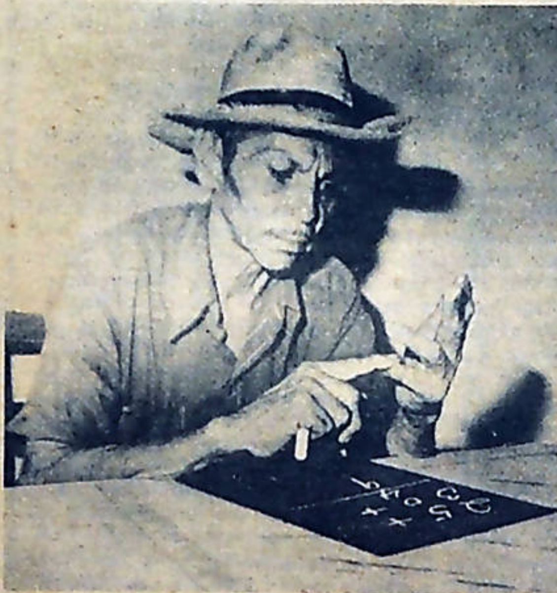
La alfabetización se ha convertido en la gran tarea de la revolución nicaragüense.

La Revolución Sandinista conserva su frescura, no se marchita