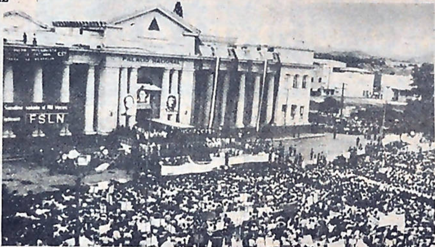
La celebración del Primer Aniversario será la más combativa y numerosa de las que se han hecho en la tierra de Sandino.

El pueblo nicaragüense, consciente de su papel histórico y de los peligros que afronta su revolución, se moviliza en todos los campos para derrotar la ignorancia la miseria, el hambre, el desempleo, la contrarrevolución y las agresiones imperialistas.