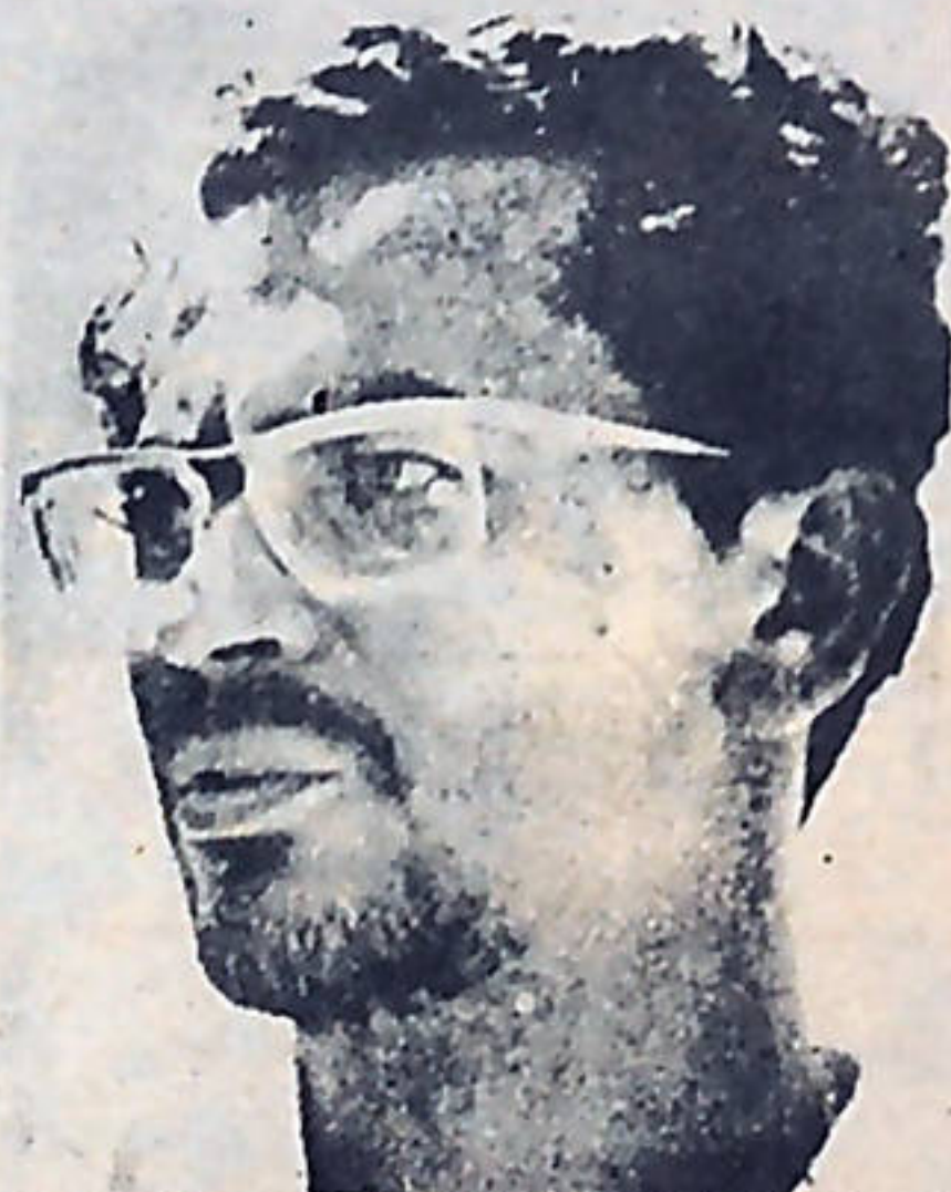
Carlos Fonseca, jefe de la Revolución Sandinista.