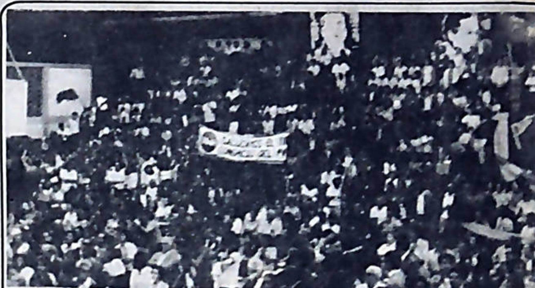
Centenares de vanguardistas se reunieron en el combativo acto de clausura del XIII Congreso del PVP.