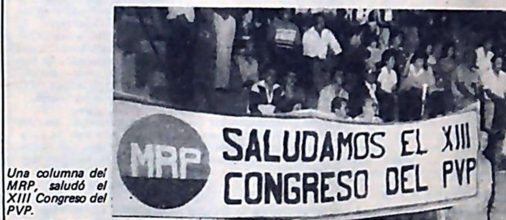
Una columna del MRP, saludó el XIII Congreso del PVP.