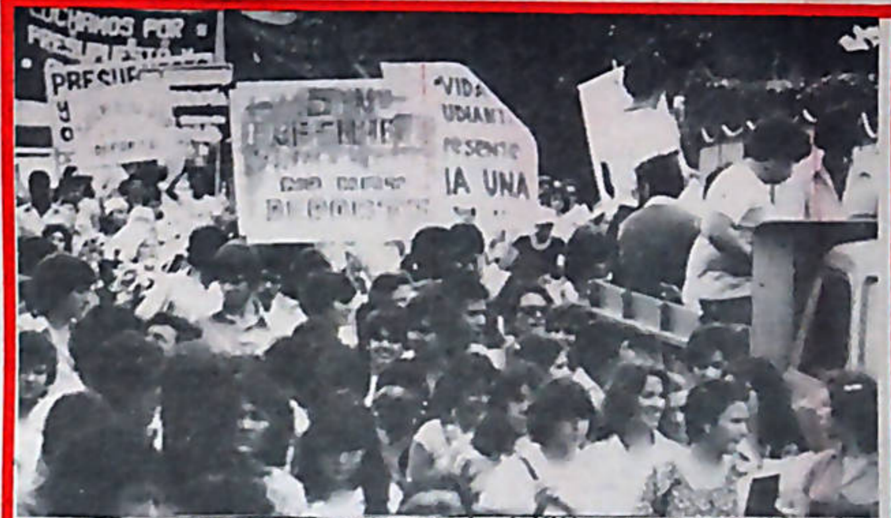
Ante la grave crisis financiera que ha obligado a la UNA a cerrar sus puertas, estudiantes, profesores y administrativos se han movilizado.

Ante esta situación las organizaciones populares, obreras y campesinas deben estar alertas para defender el precio que sea posible el derecho a la crítica, a la denuncia y a la huelga, sin que por ello se deba sufrir cárcel ni ningún tipo de condena o castigo.