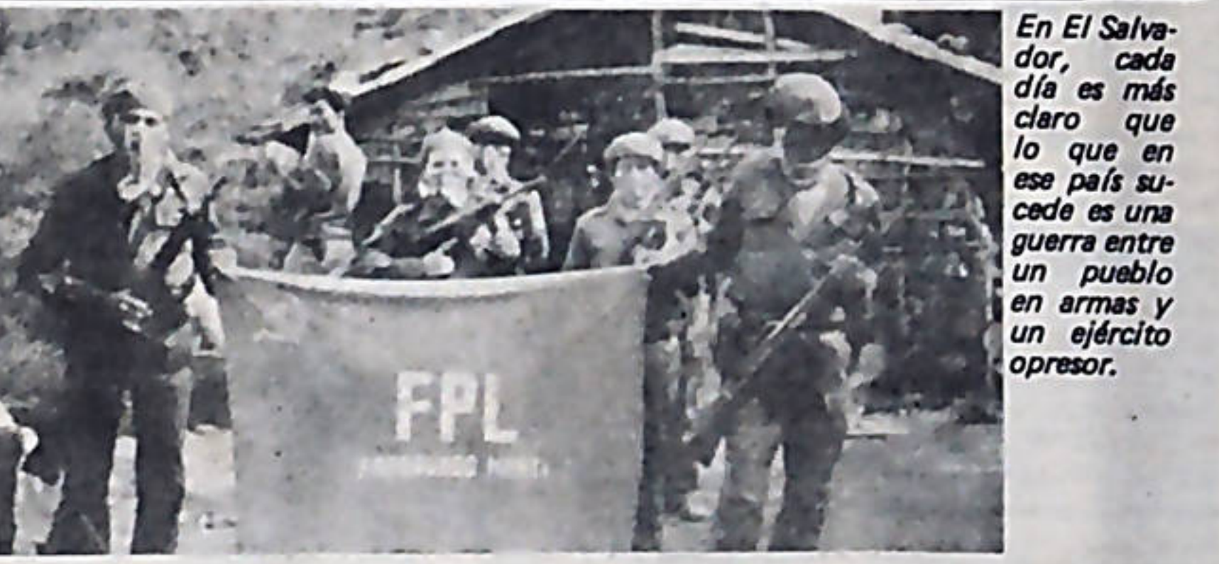
En El Salvador, cada día es más claro que lo que en ese país sucede es una guerra entre un pueblo en armas y un ejército opresor.

SANTO DOMINGO, (PL). Dos personas murieron durante los enfrentamientos entre la policía y obreros del transporte público en huelga hace 5 días, mientras el sindicato de comercio y otros sectores manifestaron su intención de sumarse al paro. Asimismo, la cifra de heridos sobrepasa los treinta y se considera que los detenidos por las fuerzas policíacas superan los 500. La capital está prácticamente paralizada. Apenas algunos vehículos circulan por sus calles y la mayoría de los comercios se mantienen cerrados, en tanto, las escuelas se encuentran imposibilitadas de dar clase.