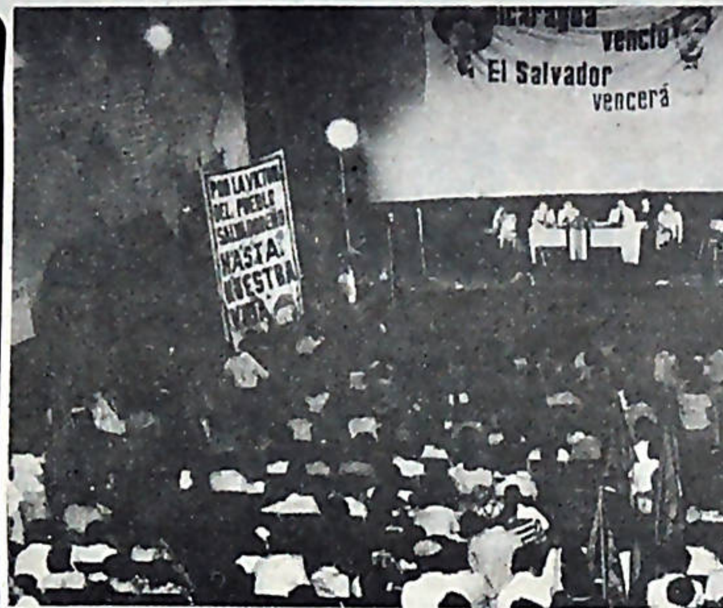
El Cine Reina se llenó de bote en bote, más de un millar de personas se hicieron presentes a brindar su solidaridad al pueblo salvadoreño.

Con una gran ovación fue saludado el Secretario General del BPR.