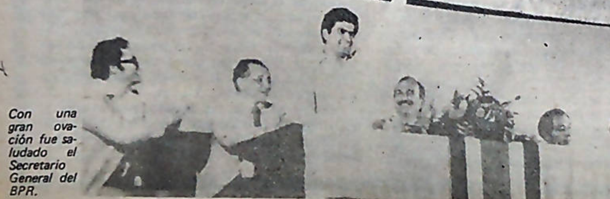
Con una gran ovación fue saludado el Secretario General del BPR.