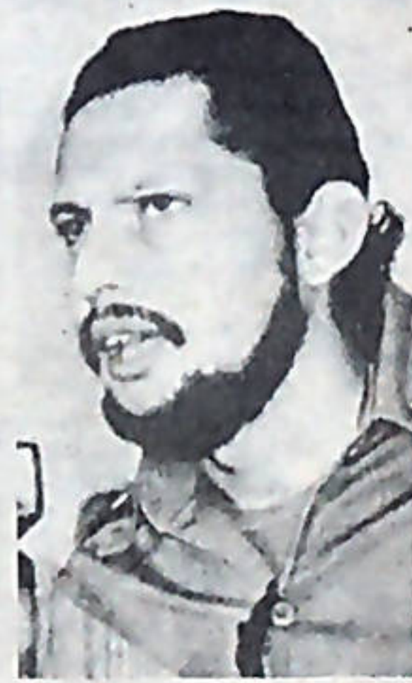
Comandante de la Revolución, Bayardo Arce, presidente del Consejo de Estado

Así mismo, y para demostrar que no se trata de consignas revolucionarias