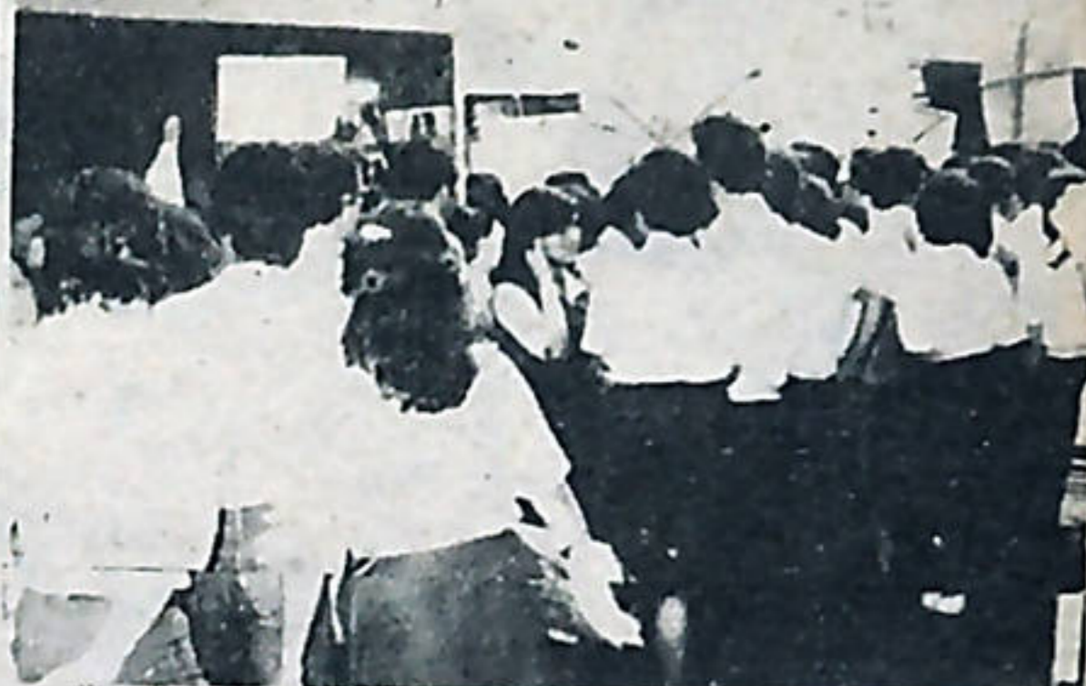
Estudiantes de diversos colegios profesionales del país decretaron una huelga en contra de la política económica del gobierno que afecta la calidad académica de dichos colegios.