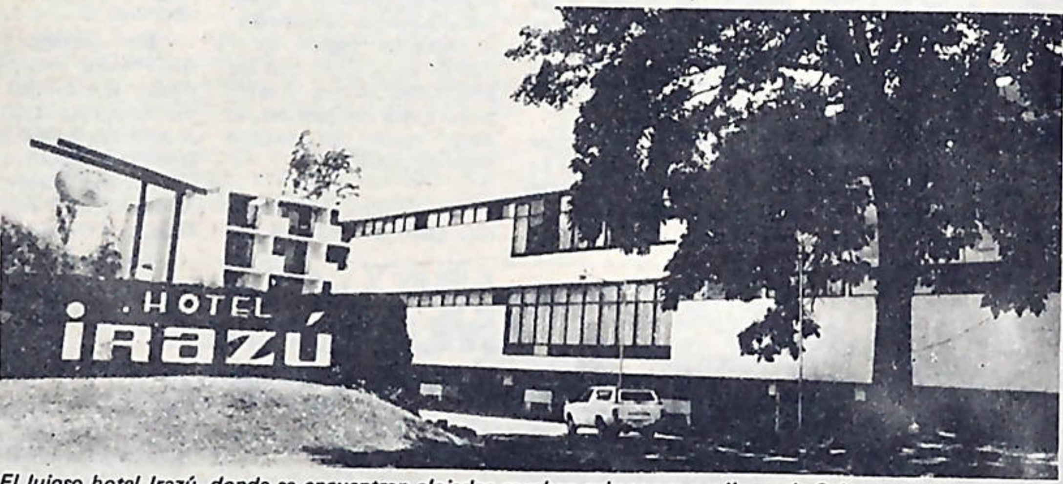
El lujoso hotel Irazú, donde se encuentran alojados muchos cubanos que salieron de Cuba, ya que en este país la vagancia, la prostitución y el vicio han quedado erradicados.