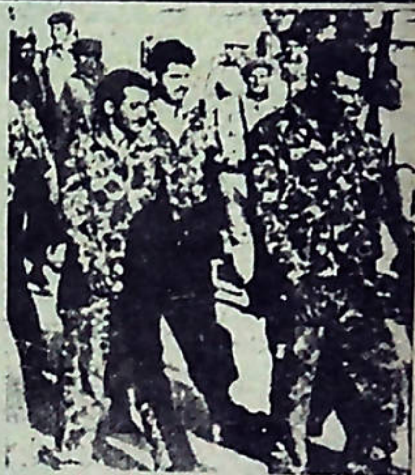
El 19 de abril se cumplió el XIX Aniversario de la derrota de los mercenarios, ex-cubanos en Playa Girón. Hoy día la misma escoria busca refugio en Miami, el mismo lugar donde buscó refugio el tirano Somoza, el ex-Sha de Irán, y demás energúmenos enemigos todos de la conquista de los trabajadores, y el pueblo cubano.

Por otra parte, anota: "Insistimos que esta no es una batalla contra el lumpen, es esencialmente una batalla por la dignidad y soberanía de nuestro país y por la seguridad de todas las representaciones diplomáticas radicadas en Cuba y estamos dispuestos a llevarla hasta las últimas consecuencias. Naturalmente que la actitud del lumpen, único aliado social que le queda al imperialismo en este país, ha indignado profundamente a nuestro pueblo."