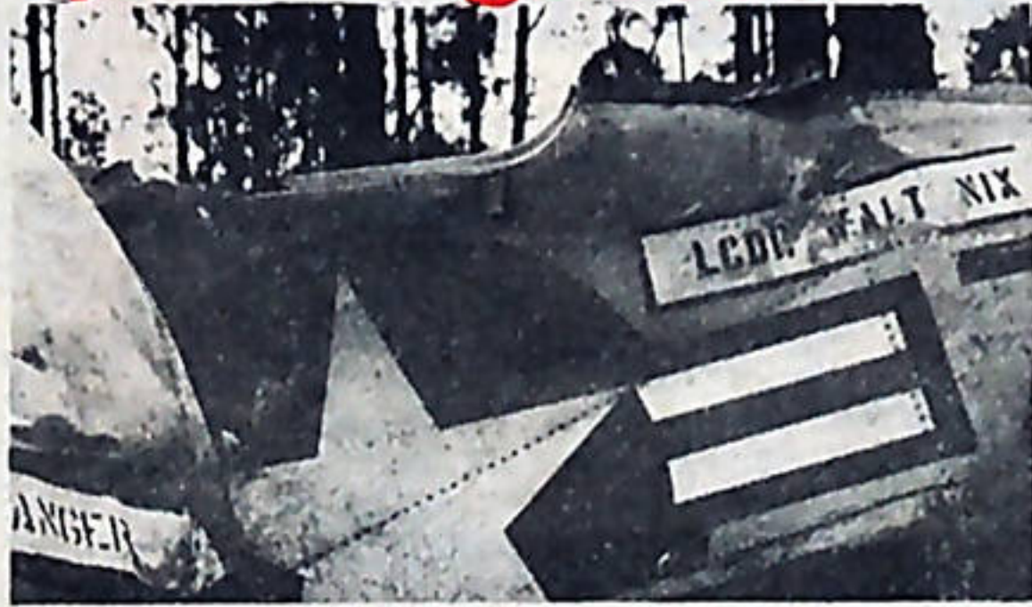
La acción fallida de los Estados Unidos, ha creado una situación de alerta en los pueblos del Medio Oriente.

Por su parte los voceros del gobierno iraní afirmaron que la acción militar norteamericana tenía como pretexto liberar a los rehenes, pero ese era un objetivo menor, pues significaría el inicio de un ataque a fondo a Teherán.