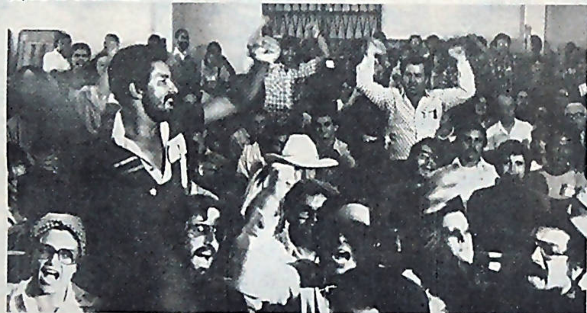
EL PUEBLO ORGANIZADO JAMAS SERA APLASTADO! fue el grito combativo de las asambleístas del pueblo.