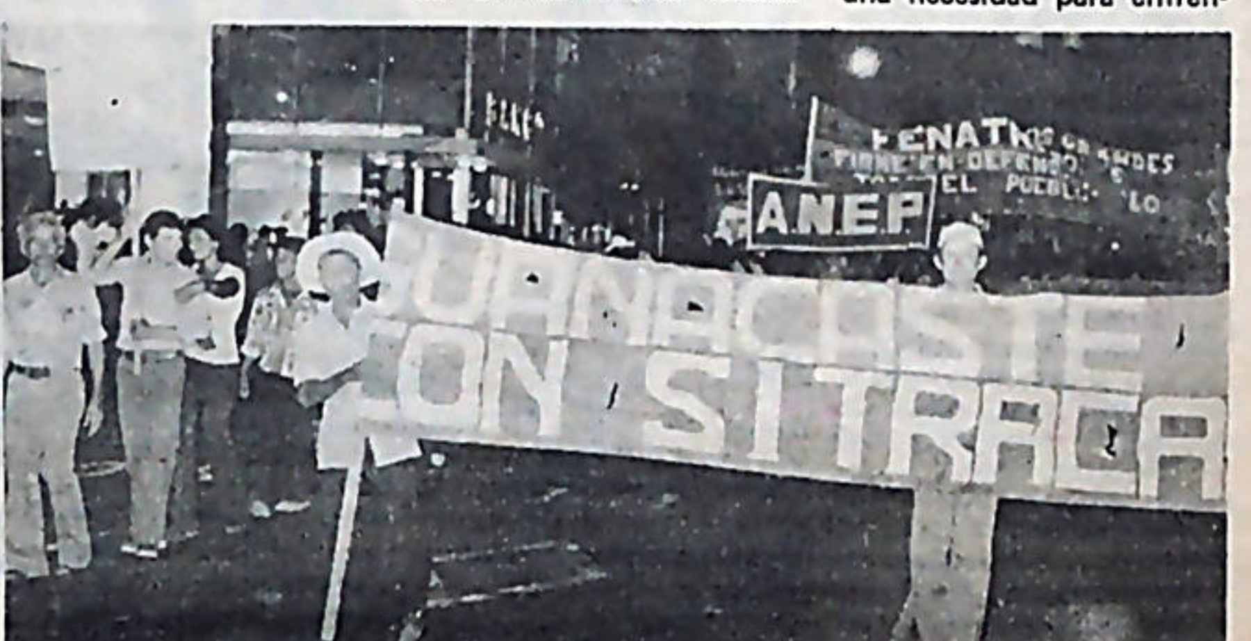
Los cañeros se hicieron presentes a la inauguración de la Asamblea del Pueblo, con el grito 'UNITE EL PUEBLO'.