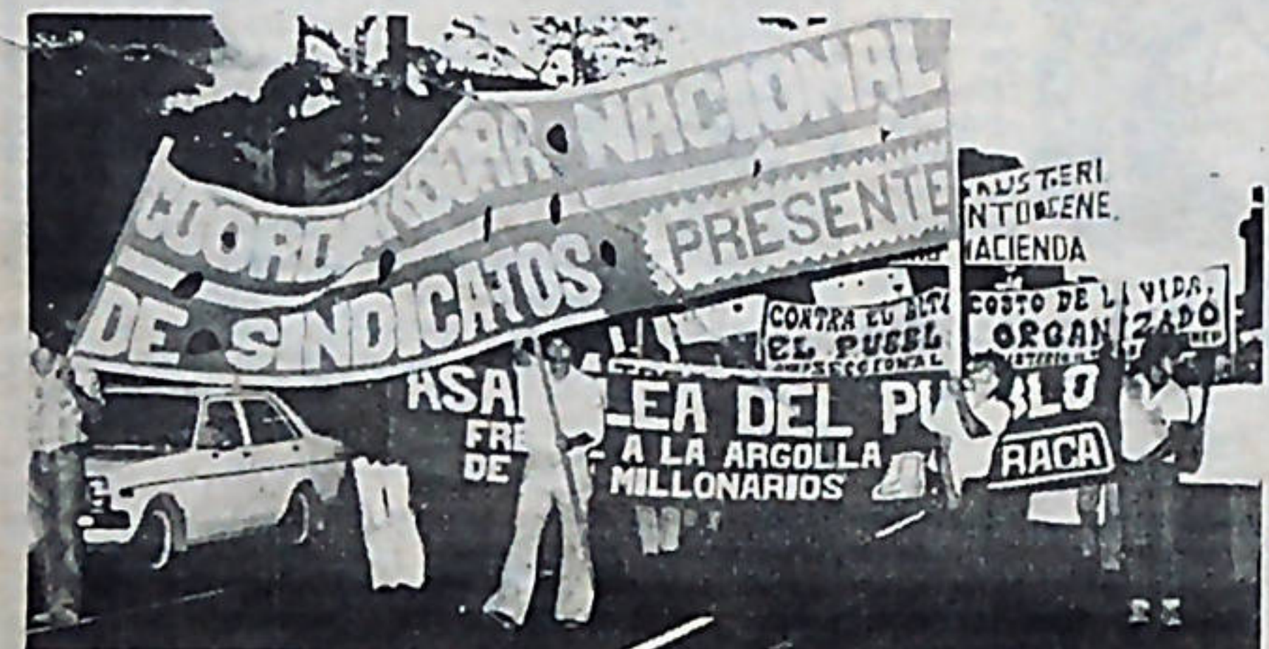
La Coordinadora Nacional de Sindicatos, organizó un combativo desfile que partió del Hospital Nacional de Niños.

La velada cultural, fue muy bien acogida por los asistentes, quienes elogiaron