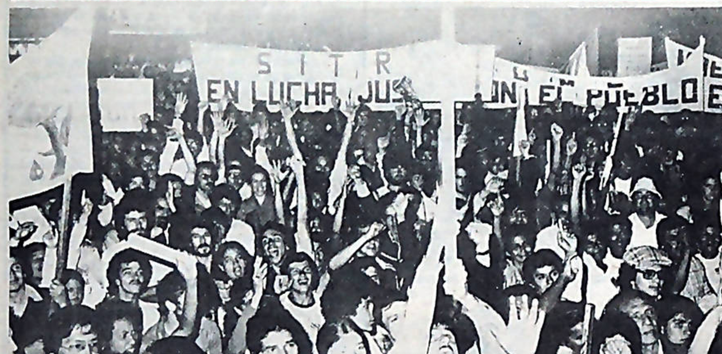
El viernes 7, varios millares de costarricenses se congregaron frente a la Soledad, para manifestar su repudio a las políticas antipopulares del gobierno e inaugurar la ASAMBLEA DEL PUEBLO.

El 9 de marzo pasará a ser una importante fecha en la historia del movimiento popular costarricense. Y los responsables de tal situación, son los delegados, que en más de un millar se movilizaron el domingo pasado a la Universidad de Costa Rica, para dar luz a la Primera Asamblea del Pueblo.