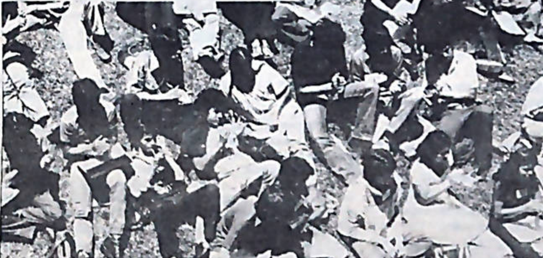
La Comisión Estudiantil realizó sus sesiones bajo el sol. Tal circunstancia no impidió la discusión entusiasta.

El contraste es claro: Los grandes patronos que controlan el gobierno, se organizan y unifican sus esfuerzos, para obtener mayor márgenes de ganancia en sus empresas, ellos mismos bloquean la organización popular y tratan de sembrar la división entre el pueblo. Con la Asamblea del