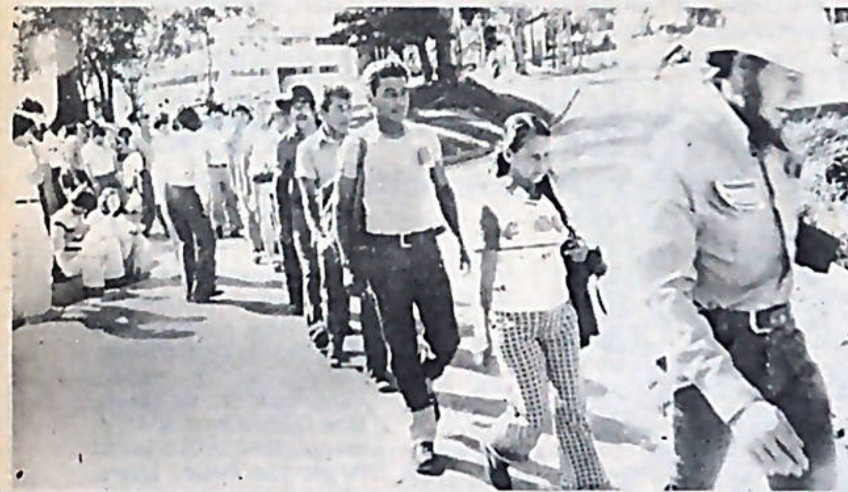
El domingo 9, muy temprano una delegación de trabajadores cañeros y de Fertica ingresó a la Universidad de Costa Rica.

La masiva movilización que se dio, los días 7, 8 y 9, alrededor de la Asamblea del Pueblo, demostró que amplios sectores populares ven a tal Asamblea como una necesidad para enfren-