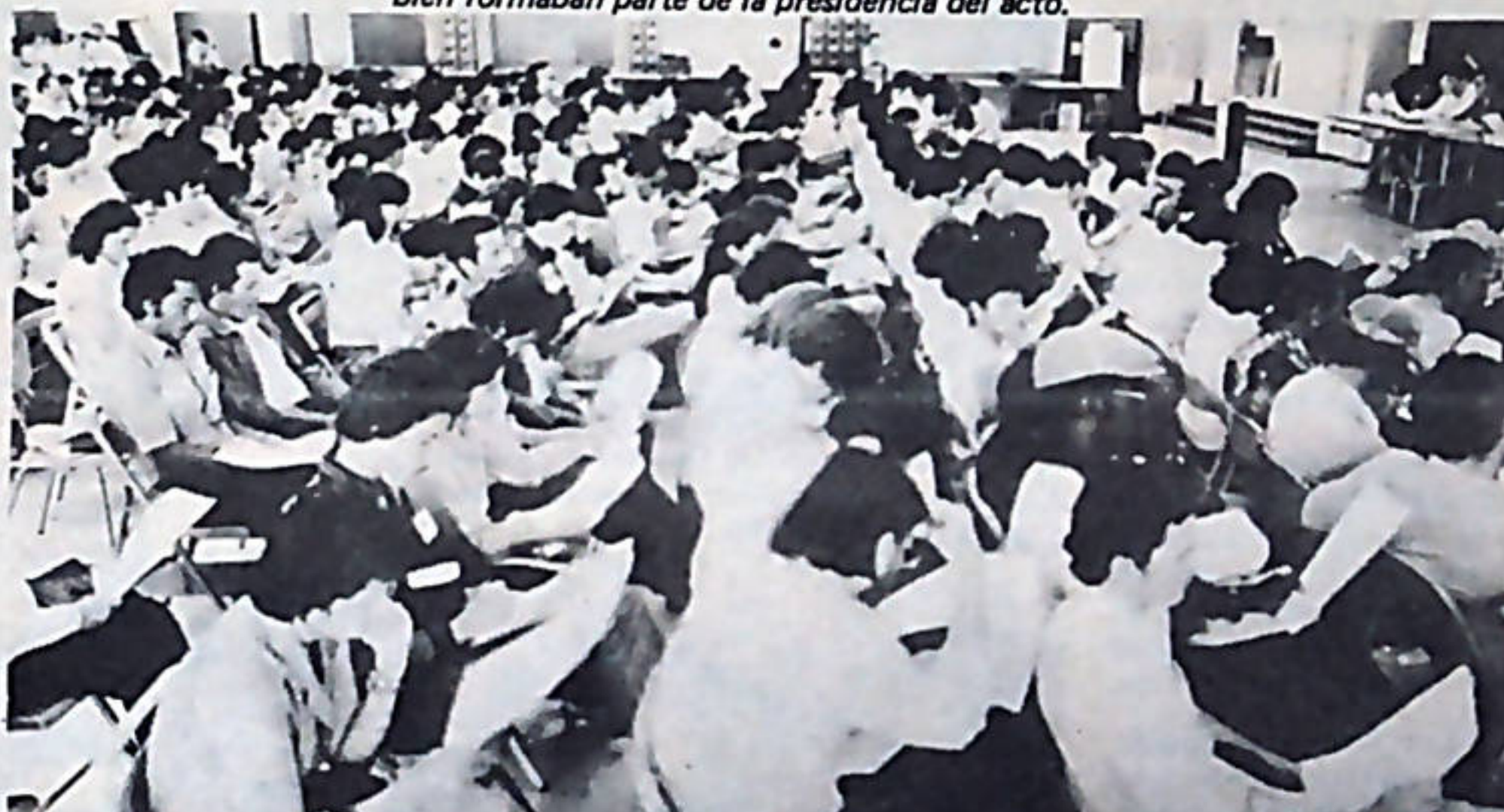
La Comisión Sindical, resultó ser la más numerosa. Más de 500 delegados de diversas organizaciones sindicales la integran.

seos que el actual gobierno complace con su política antipueblo. Es precisamente en esas circunstancias, en las que se concreta la realización de la Primera Asamblea del Pueblo. De ahí que calzara como anillo en el dedo. INAUGURACION DE LA ASAMBLEA El viernes 7 por la no-