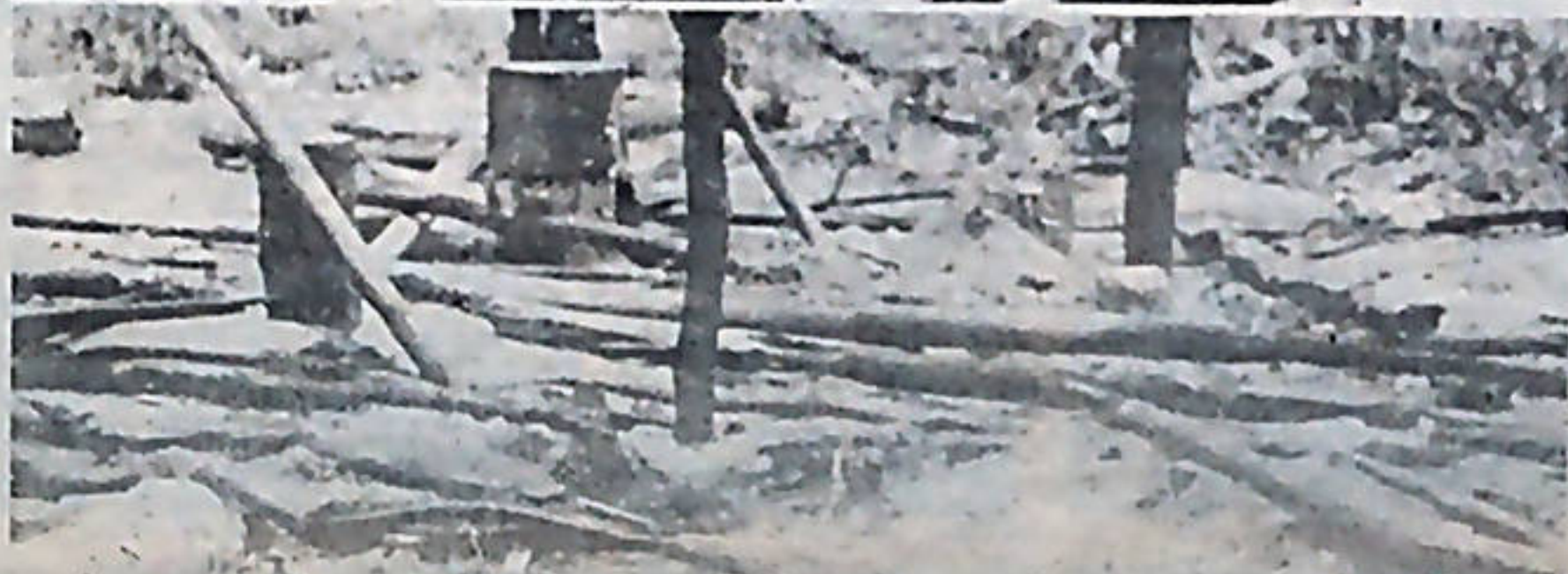
Todo quedó en ruinas. Después del desalojo la guardia se encargó de destruir lo que quedaba en pie.