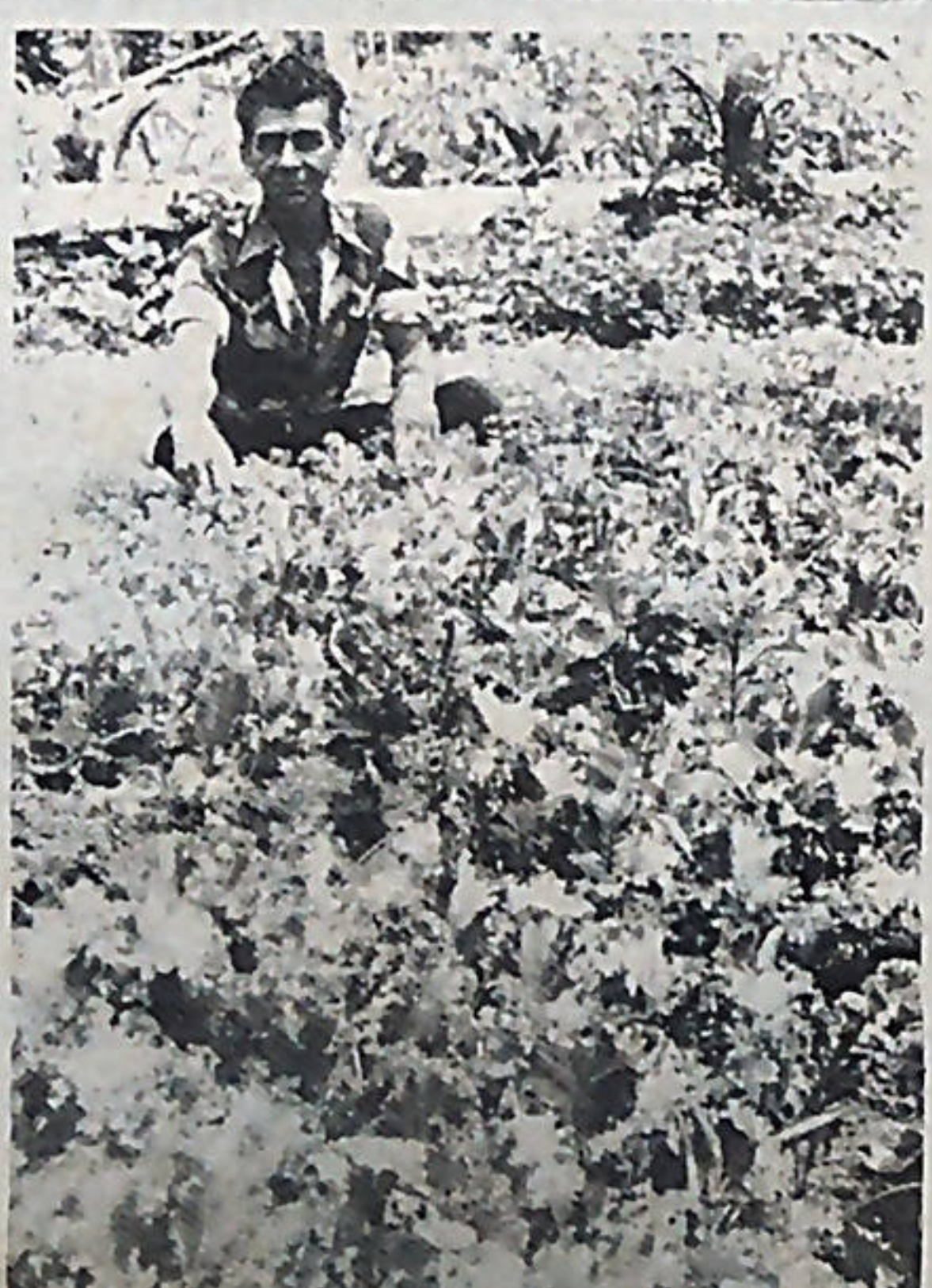
Los campesinos han puesto a producir la tierra la cual antes de llegar ellos a esos sitios se encontraban en absoluto estado de abandono. El precio que pagan por tan brutal "delito" es la cárcel, el desalojo y la quema de sus humildes viviendas.