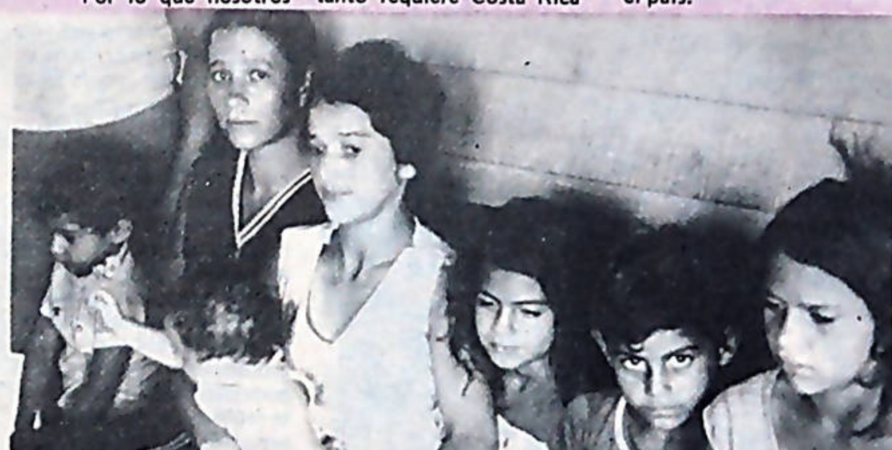
La acción de la Guardia Rural, alcanzó también a las mujeres y los niños, los cuales también fueron víctimas del brutal desalojo.

sostiene Fonseca. Afirmó a la vez, que en esta lucha tienen de enemigos a los grandes ricos y al gobierno pero que cuentan con el apoyo de los trabajadores de todo el país.