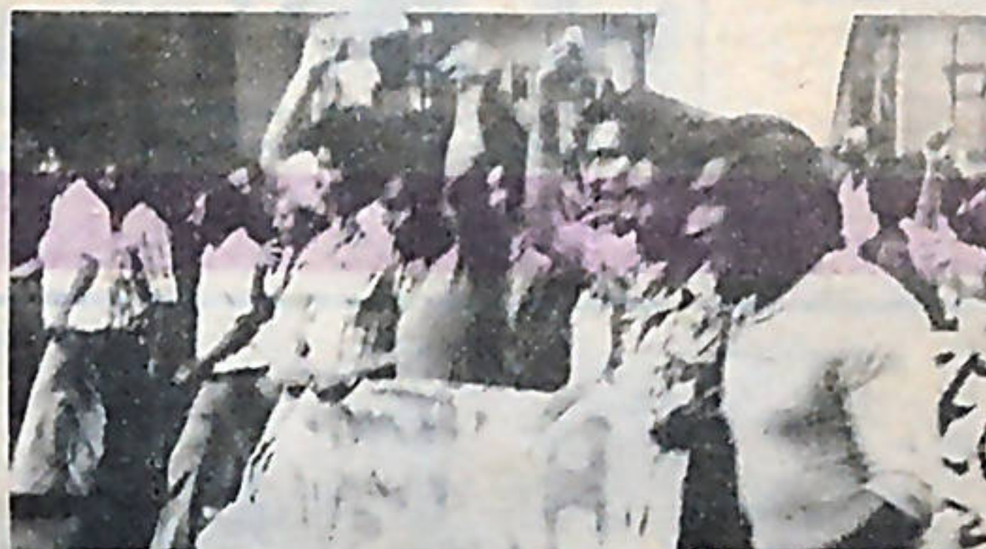
Al igual que los trabajadores bananeros de las transnacionales, hoy los obreros de ASBANA exigen mejores salarios.

Por último, las obreras quedaron convencidas de que en Costa Rica, el que se respete el derecho de los trabajadores depende de su propia organización y en su propia disposición a defenderlos. Al mismo tiempo, manifestaron su indignación por el maltrato de que fueron víctimas por parte de la policía, más aún en un caso en donde ellas tenían toda la razón.