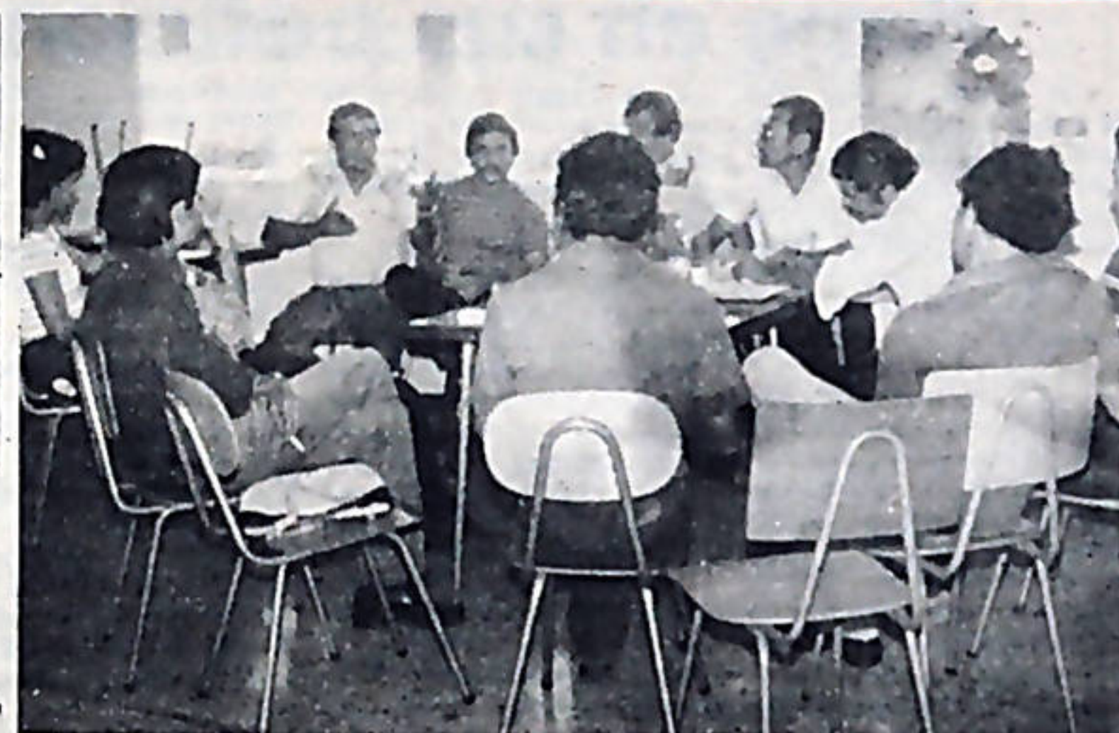
En todo el país dirigentes populares se han venido preparando para participar la Asamblea del Pueblo. Un ejemplo de ello es esta reunión de trabajadores de la salud en Pérez Zeledón.