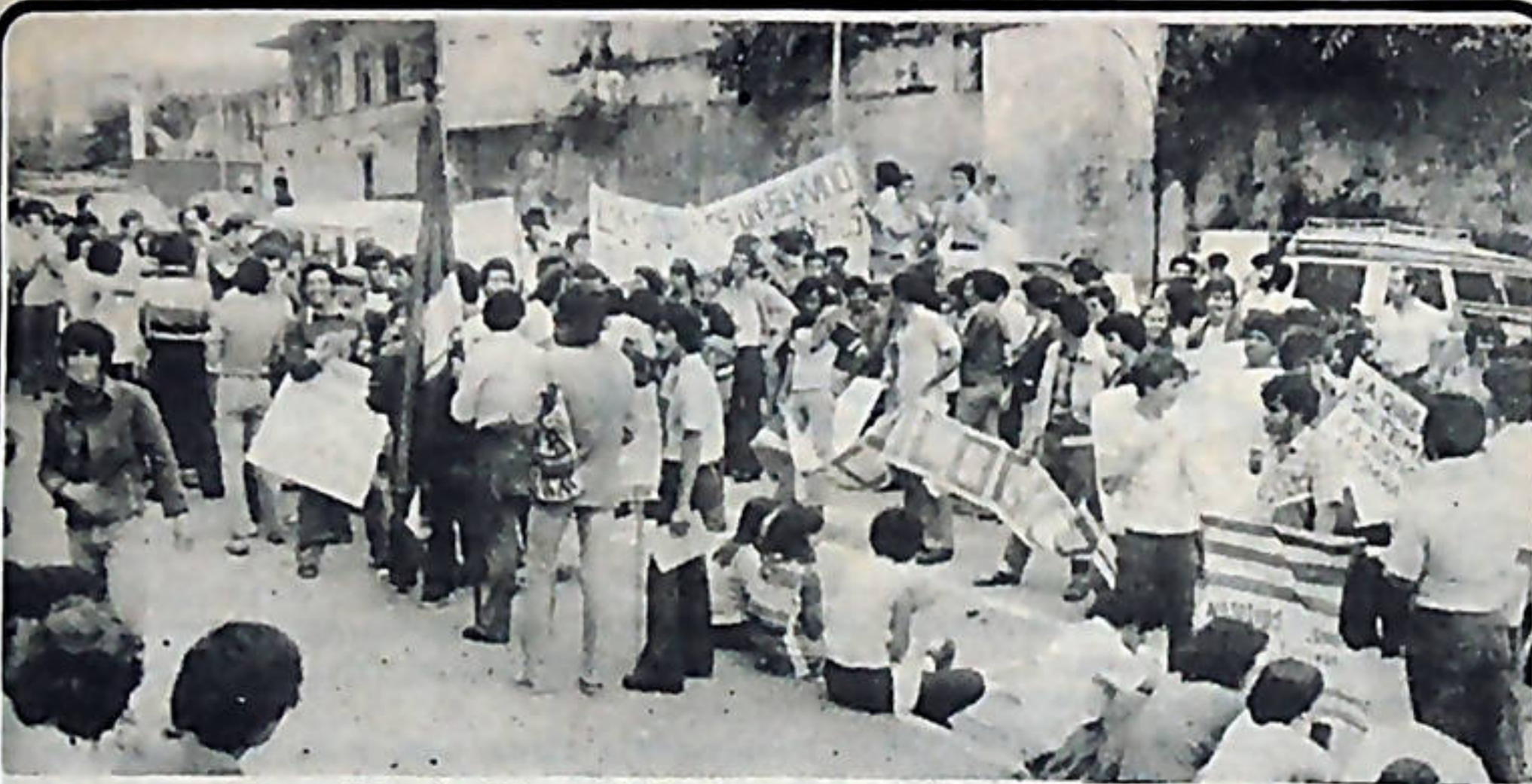
La huelga en el Tecnológico ha sido total. Una inmensa mayoría de estudiantes no asiste a lecciones.