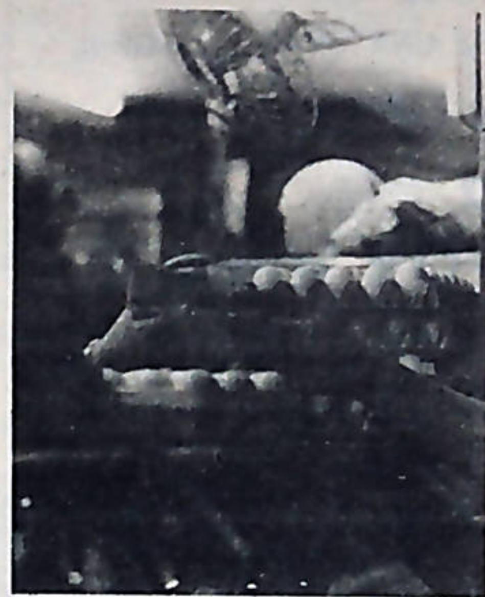
La política gobiernista está llevando a muchos sectores de nuestro pueblo al hambre. Los aumentos últimos en los artículos de consumo popular son un verdadero atentado contra muchas familias costarricenses.

La política gobiernista de defensa del gran productor y comerciante—según sostienen diferentes organizaciones populares que convocaron a la ASAMBLEA DEL PUEBLO— está llevando a nuestro pueblo al hambre.