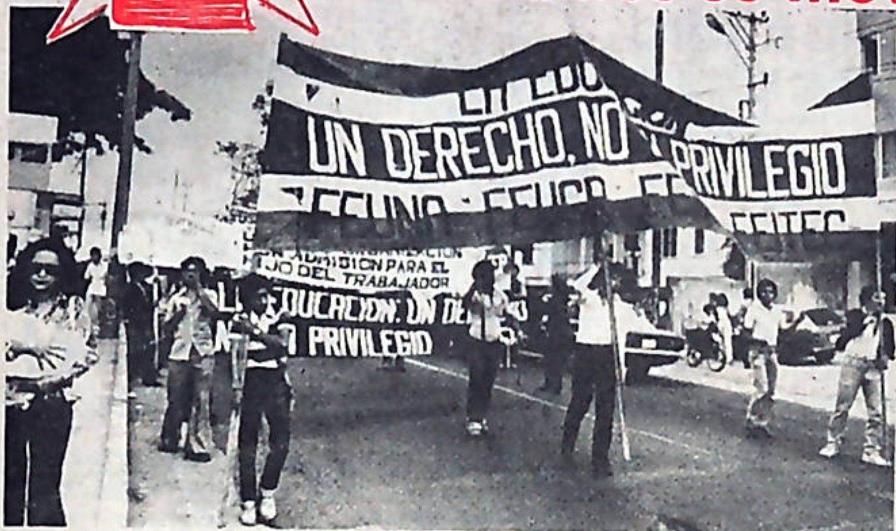
Las distintas federaciones que agrupan a los estudiantes han entrado en coordinación para luchar conjuntamente por mayor presupuesto para la educación.

Al final de una marcha que partió de la Universidad de Costa Rica, convocada por las cuatro federaciones estudiantiles del país, fue presentada ante el Presidente de la República una carta sobre el serio problema presupuestario de las instituciones educativas de nivel superior.