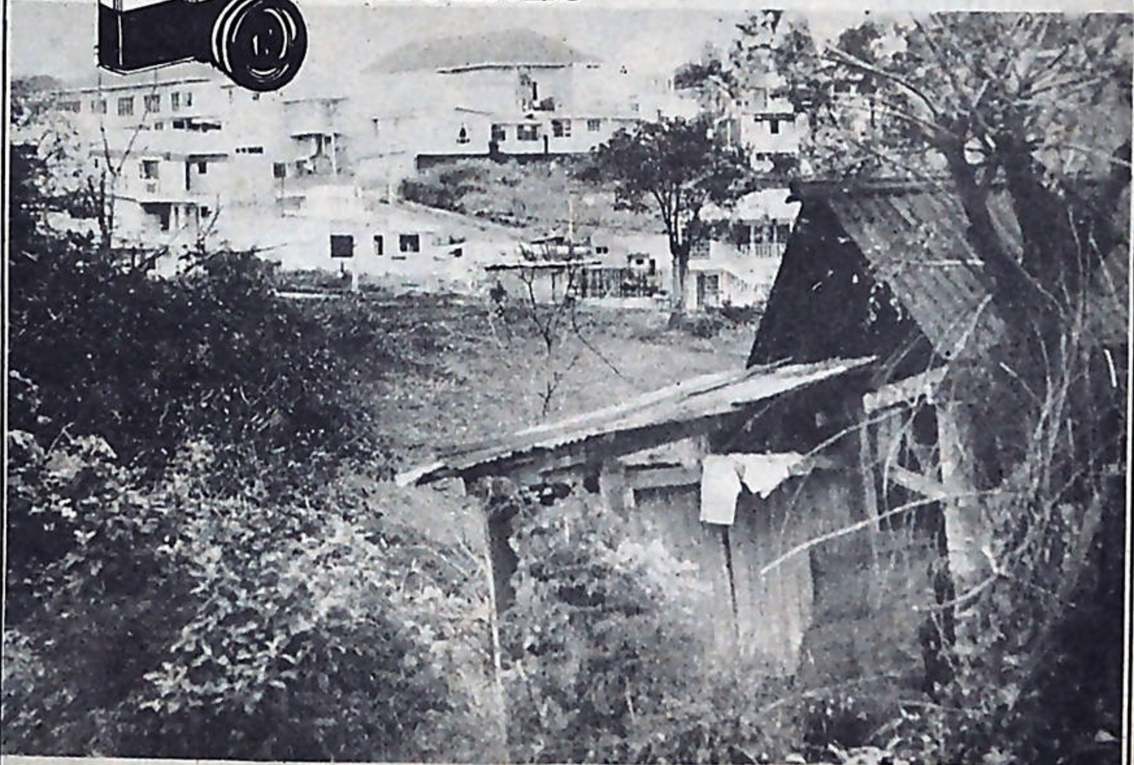
En Costa Rica, imágenes como esta pueden observarse en todo el territorio nacional. A la par de grandes palacetes, se levantan numerosos tugurios. Instituciones como el INVU no han resuelto nada en ese sentido, por el contrario, han servido para que muchos allegados a los gobernantes hagan negociados.