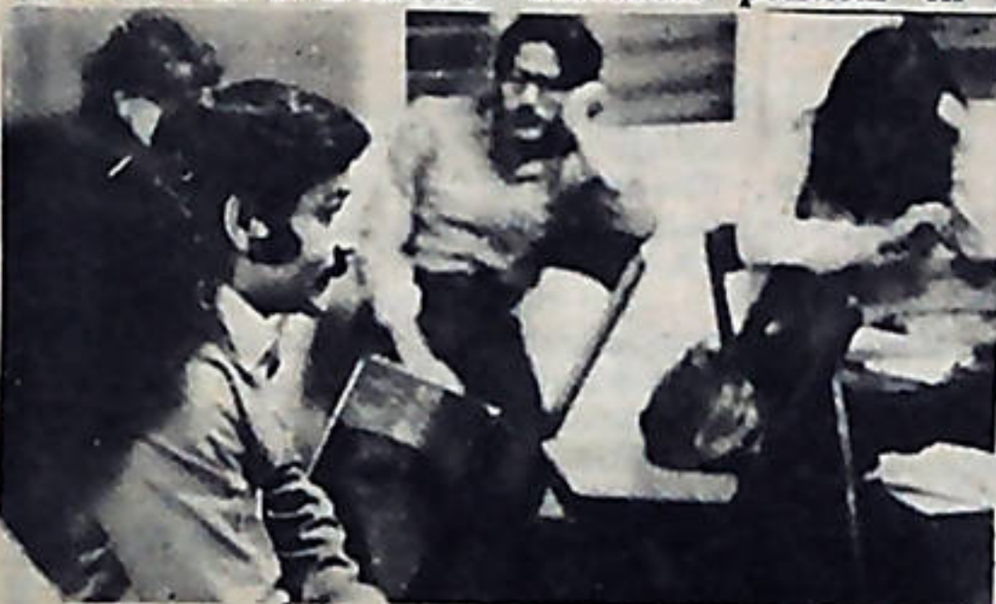
Trabajadores de la cultura discuten temas, que presentaron al foro de la Asamblea del pueblo.

Por último, los trabajadores de la cultura acordaron impulsar reuniones en las diferentes áreas, para llevar al foro de la ASAMBLEA DEL PUEBLO, las inquietudes de cada uno de sus sectores.