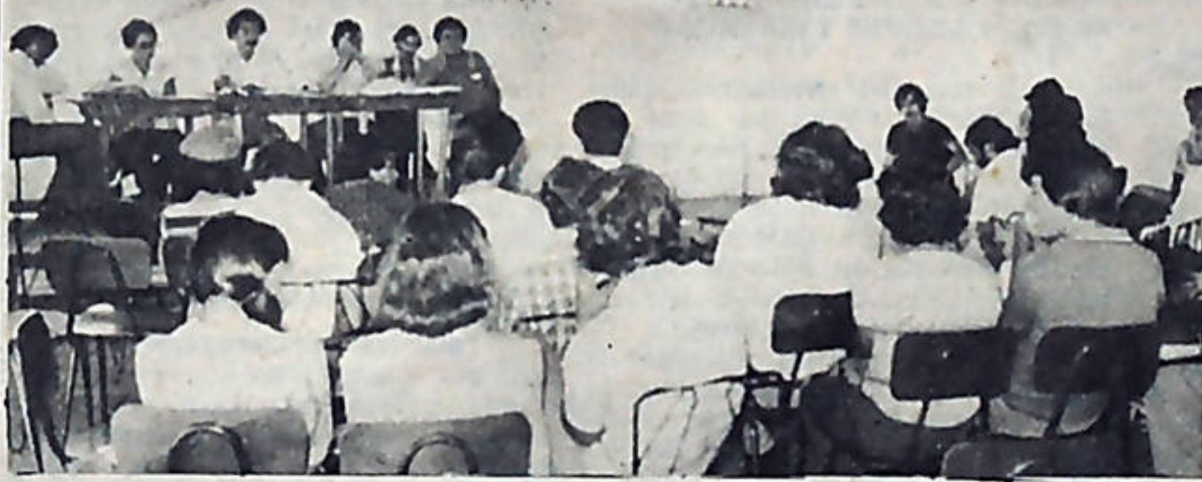
La actitud del pueblo cartaginés debe servir de ejemplo a todas las comunidades del país.