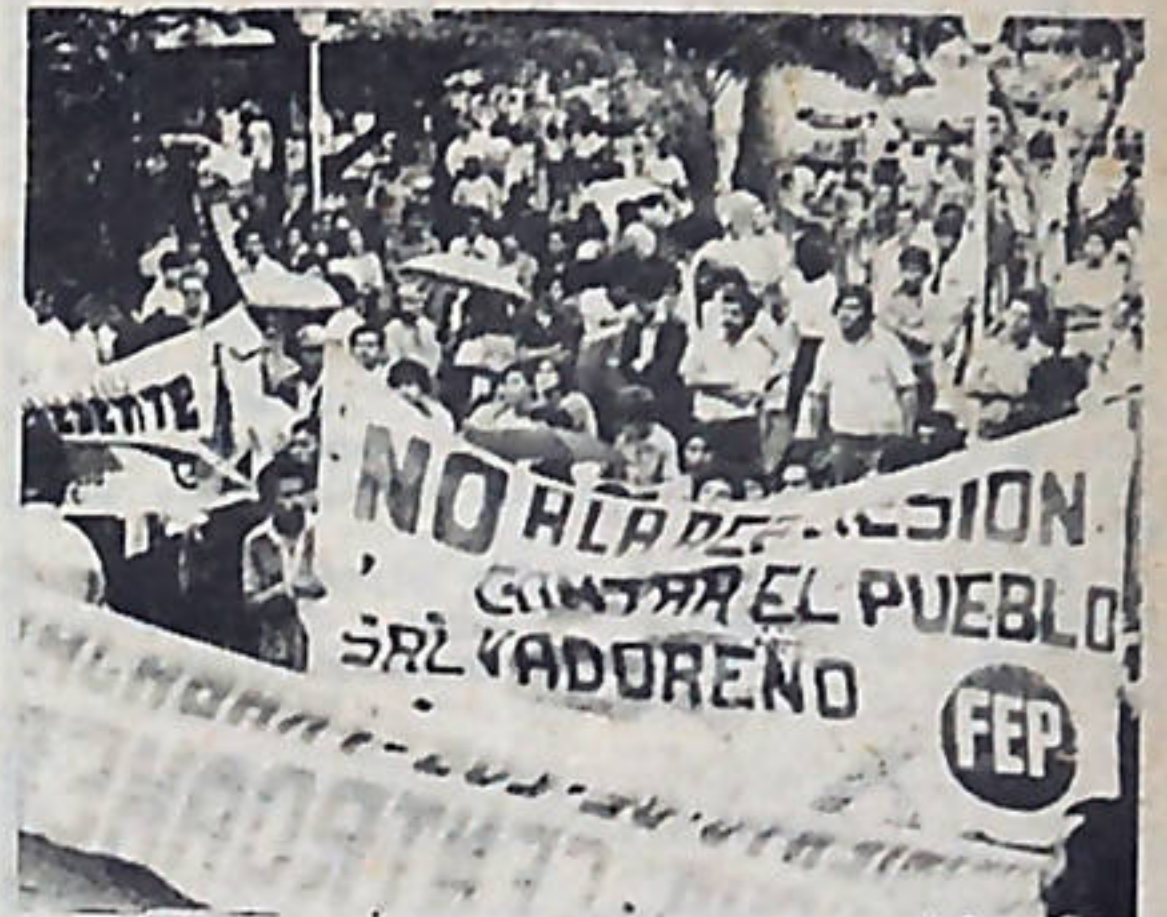
El pueblo costarricense siempre solidario con los pueblos centroamericanos.

En un primer momento, cayeron cegadas las vidas