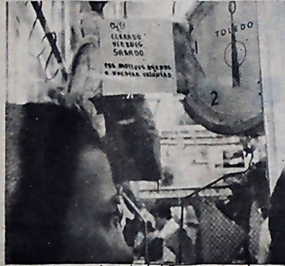
Los carniceros están en huelga Seguro que muchos sectores de nuestro pueblo ni siquiera se han dado cuenta, ya que la carne hace mucho tiempo que dejó de formar parte de su dieta básica.

Los sucesivos aumentos de precios en artículos de consumo básico, en los combustibles y en los servicios, además de la liberación de precios en muchos artículos, calificados por ese ministerio, arbitrariamente como suntuarios, por una parte, los bajos salarios, por otra, son parte de la realidad cotidiana que han vivido la mayoría de los costarricenses, durante 1979. Los viajes al exterior, el consumo irracional y alegre, de licores finos, de frutas importadas y otras "chucherías", la compra de automóviles, las suntuosas cenas de fin de año y el consumo de gasolina, es la realidad cotidiana de sectores minoritarios y privilegiados, de los que el señor presidente, forma parte. La realidad del pueblo trabajador, es otra. Es una realidad dura y difícil. ALZAS Y MAS ALZAS