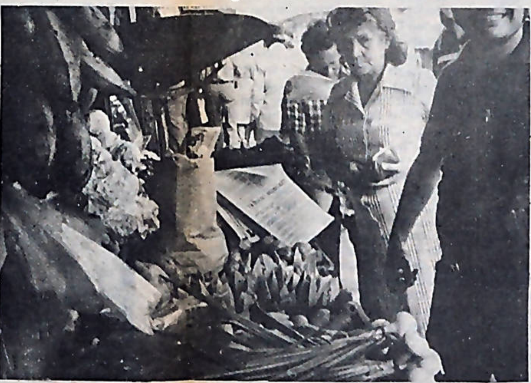
Los informes económicos que hace el Presidente por televisión son a todas luces falsos. Cualquier costarricense puede comprobarlo, ya sea en las pulperías, mercados o carnicerías en donde todo sube de precio exageradamente.

El pueblo lo que vio en diciembre pasado, es que el gobierno se aprovechó de los festejos navideños, para impulsar nuevos aumentos de precios. Y ¿en enero? El decreto autorizado más alzas: subió el precio de los combustibles, suben los granos básicos y el azúcar, subirá el aceite, la manteca, la leche, los huevos y la carne, en muchos lugares se autorizaron alzas en el transporte remunerado de personas. Para confundir al pueblo, el gobierno caracista lanza una demagógica y tardía campaña contra la especulación, que busca, en último término, presentar a ésta como la causa real en el alza del costo de la vida. Siendo esta la realidad concreta, la que palpa el pueblo día a día, cuando va a la pulpería, al tramo o al almacén, la realidad que le describe Carazo, la rechaza de plano por ridícula y mentirosa.