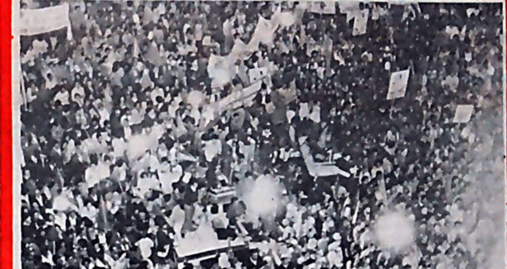
La campaña electoral pasada dió muestras evidentes de la fortaleza de la coalición PUEBLO UNIDO. Hoy día, PUEBLO UNIDO es todavía más fuerte, ya que los partidos que la integran se han fortalecido más, como consecuencia de que en la actual crisis económica son los únicos que de verdad han defendido los intereses de los trabajadores.

gran campaña propagandística, para lo cual ya ha empezado a programarse reuniones. Además, en las organizaciones populares existe gran entusiasmo por esta iniciativa, ya que es un acontecimiento unitario que le permite al pueblo enfrentar de manera más segura las medidas económicas que el Gobierno Central está impulsando contra las mayorías populares costarricenses.