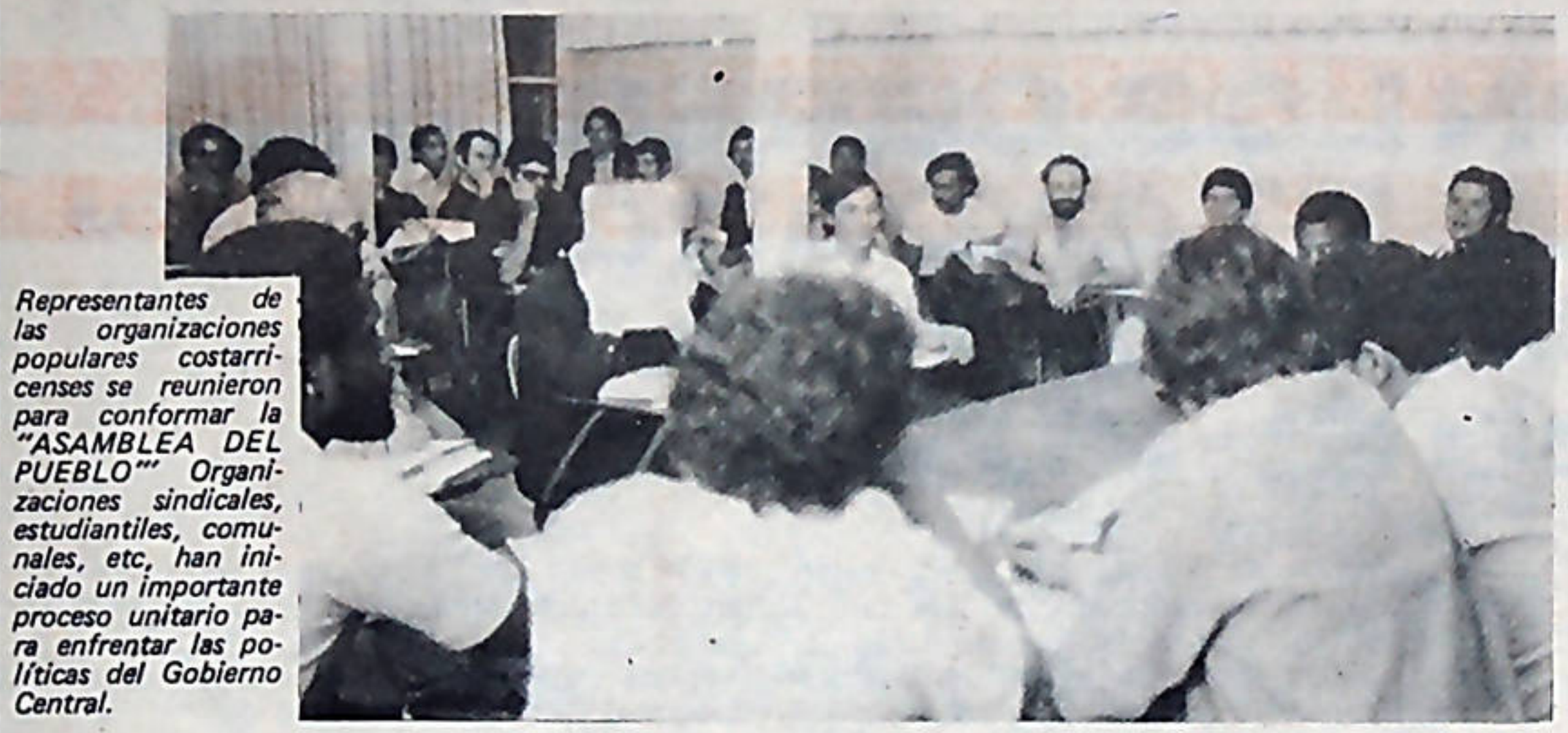
Representantes de las organizaciones populares costarricenses se reunieron para conformar la "ASAMBLEA DEL PUEBLO". Organizaciones sindicales, estudiantiles, comunales, etc., han iniciado un importante proceso unitario para enfrentar las políticas del Gobierno Central.