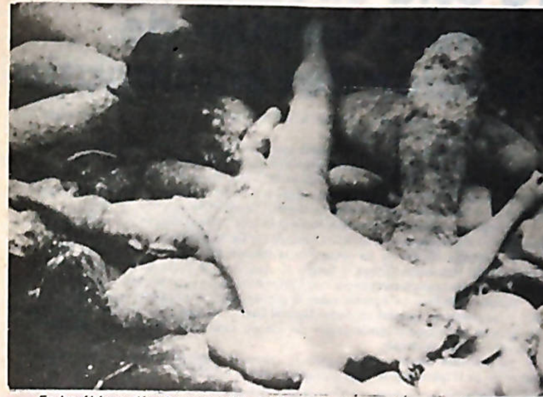
En los últimos días, han aparecido cadáveres de víctimas de la represión, en algunos ríos de El Salvador.

• Califican a la Junta de contrarrevolucionaria