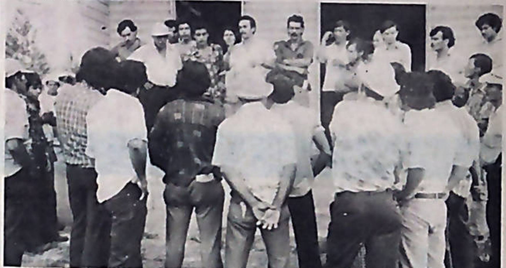
Los campesinos siguen firmes y resueltos, en la lucha por la tierra.