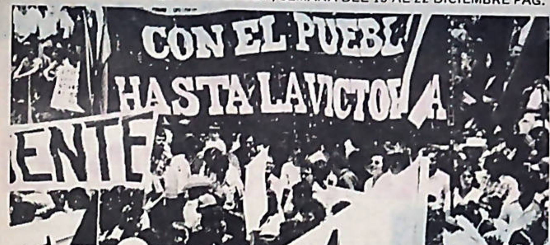
Solo la lucha de los trabajadores estatales podrá frenar los despidos masivos impulsados por el gobierno.