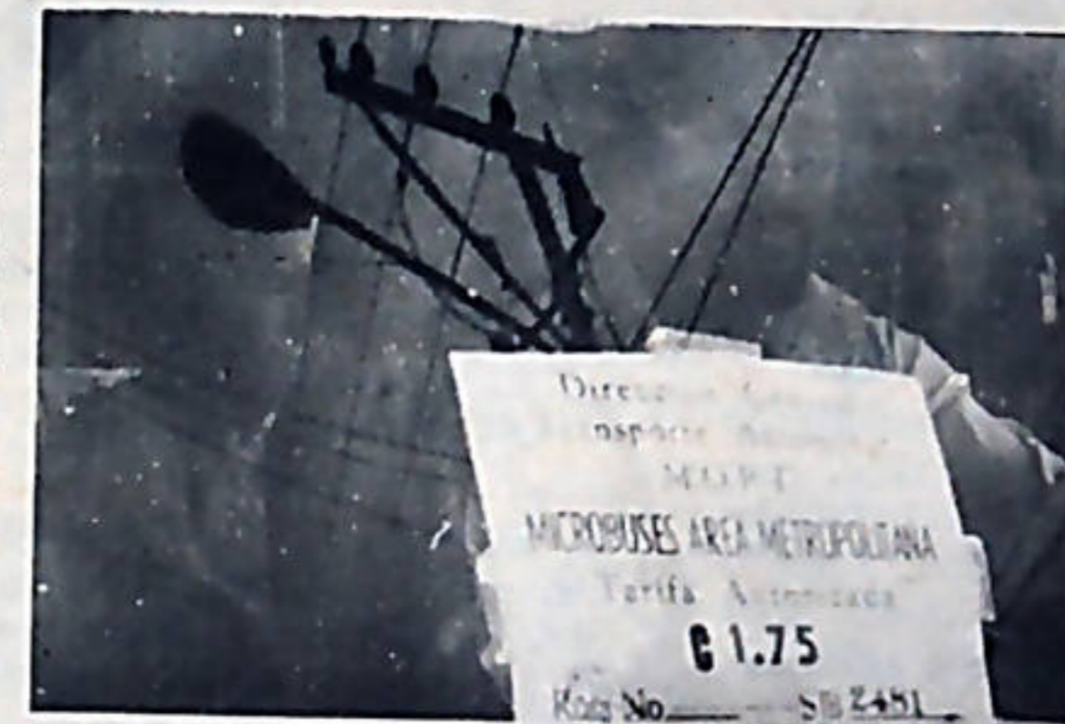
A la Periferia el Ministerio de Transporte la autorizó a subir la tarifa en una "peseta".

crativos de los grandes empresarios, en perjuicio de amplios sectores del pueblo. La raíz del problema está precisamente en que estos servicios públicos no funcionan bajo la filosofía de brindar un buen servicio al pueblo en cuanto a transporte se refiere, sino que el móvil de los grandes empresarios es obtener la mayor ganancia posible; y mientras esto continúe así, los grandes empresarios año con año, estarán siempre planteándose posibles alzas en las tarifas. El servicio de transporte no debe de estar en manos privadas, para así evitar tanto abuso. Pavas al oeste de nuestra capital, cinco asociaciones comunales se unieron y conformaron un comité para oponerse a esas alzas. Lo mismo han hecho diferentes centrales sindicales, las cua-