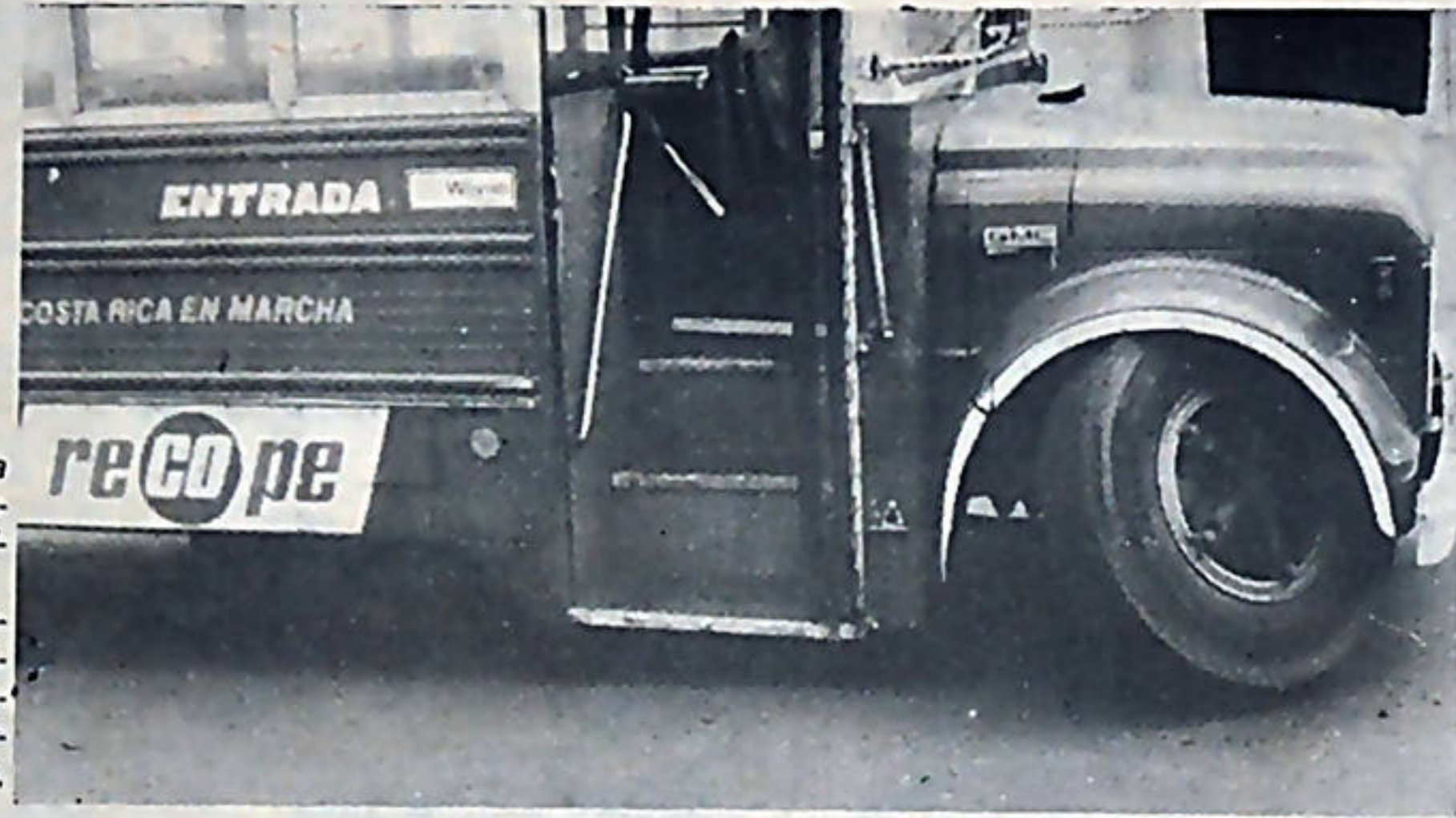
Gran malestar ha provocado el aumento en las tarifas de los buses. Los grandes empresarios han convertido el transporte en un verdadero negocio.