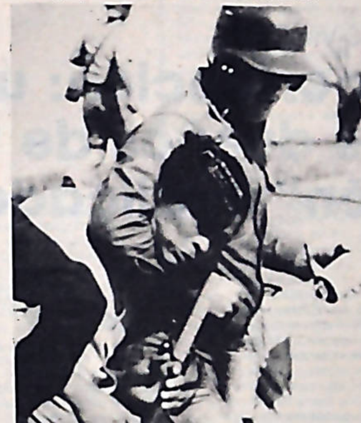
Los hombres de Echeverría se emplearon a fondo contra los vecinos de San Rafael Arriba de Desamparados.

Ante los graves sucesos, de la comunidad de San Ra-