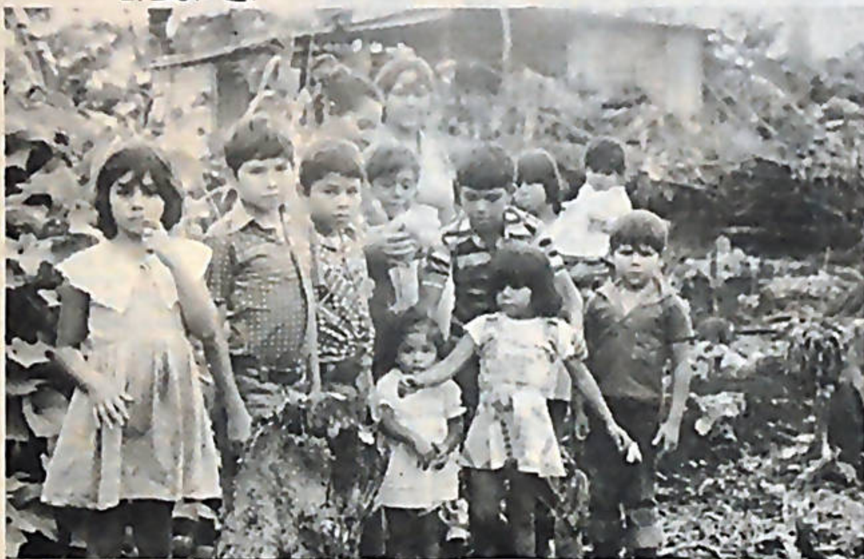
Setenta familias campesinas en Cóbano de Puntarenas invadieron dos grandes fincas que se encuentran prácticamente improductivas.