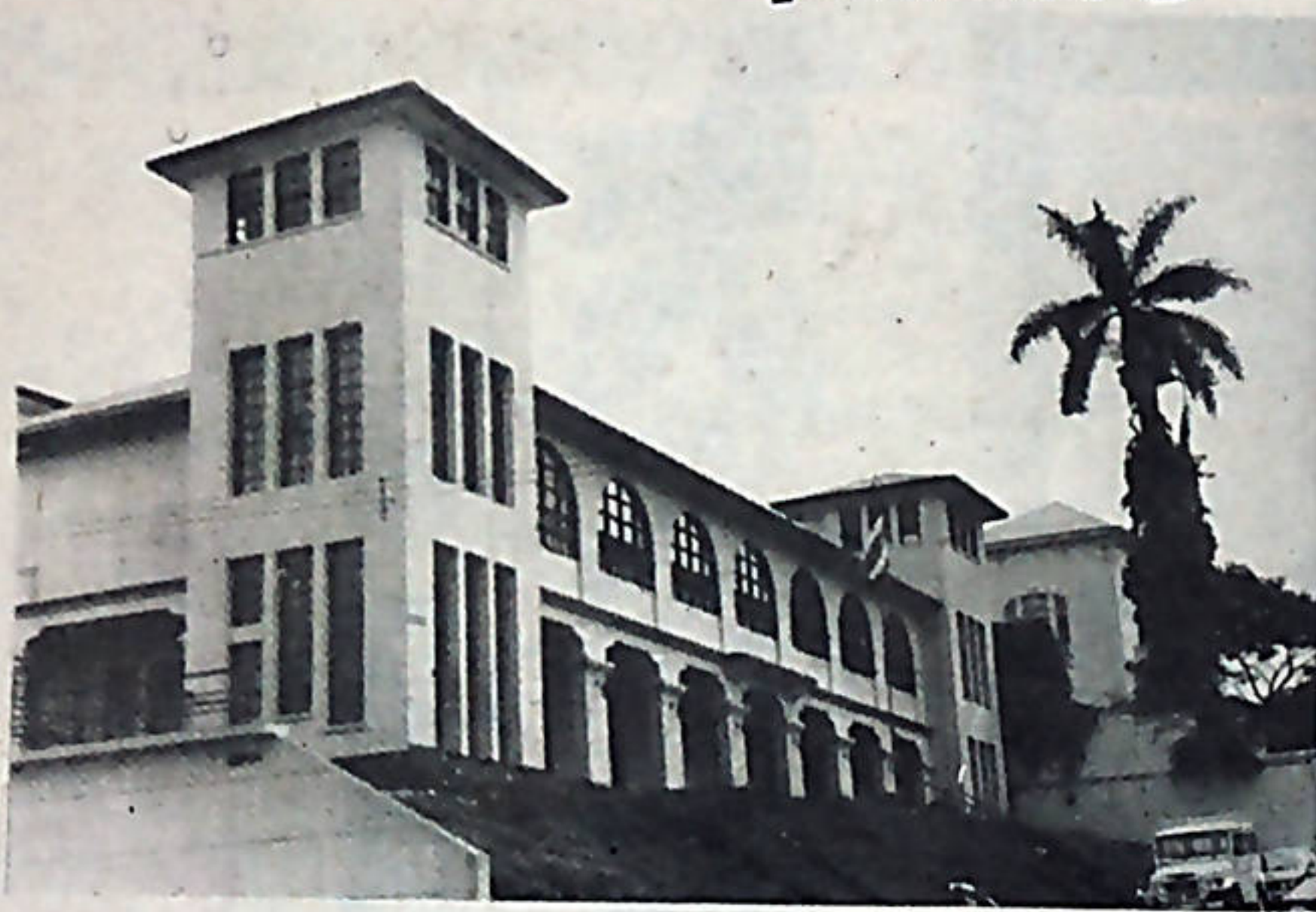
El proyecto de Presupuesto Nacional apunta en una de sus cláusulas que el Poder Ejecutivo no podrá negociar aumentos salariales con los trabajadores públicos.

Los observadores políticos, así como las organizaciones sindicales, coinciden en afirmar que el proyecto de presupuesto tiene fines eminentemente demagógicos, en la medida en que busca garantizarle a los di-