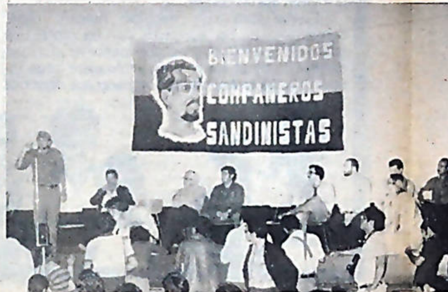
El Comandante Bayardo Arce, dirige sus palabras a la emocionada concurrencia.