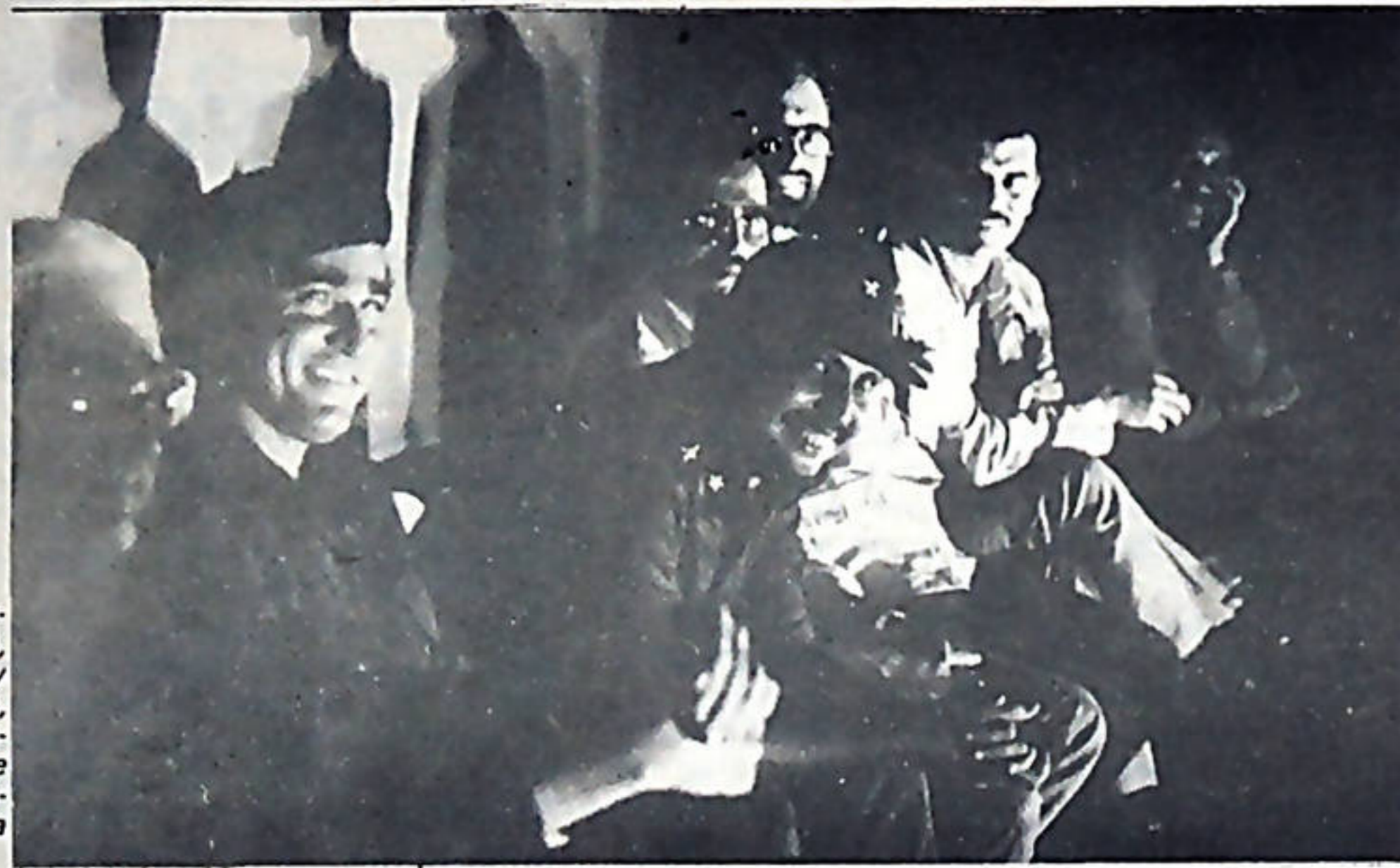
Los Comandantes Sandinistas, Edén Pastora y Bayardo Arce, fueron ovacionados en el Cine Guadalupe, cuando integraron la presidencia.