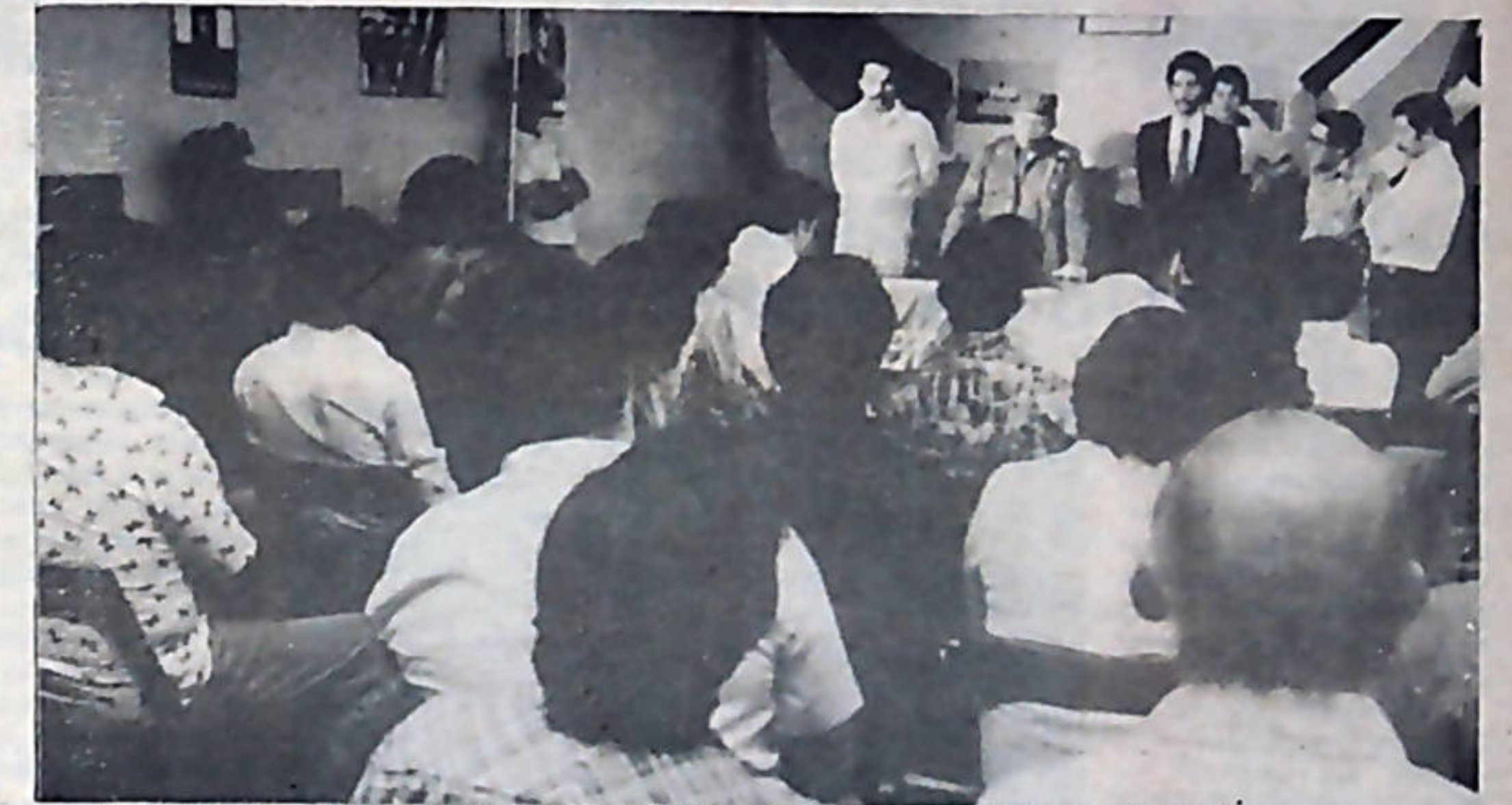
El Comandante de la Revolución, Tomás Borge se reunió con dirigentes sindicales en las oficinas de ANEP.