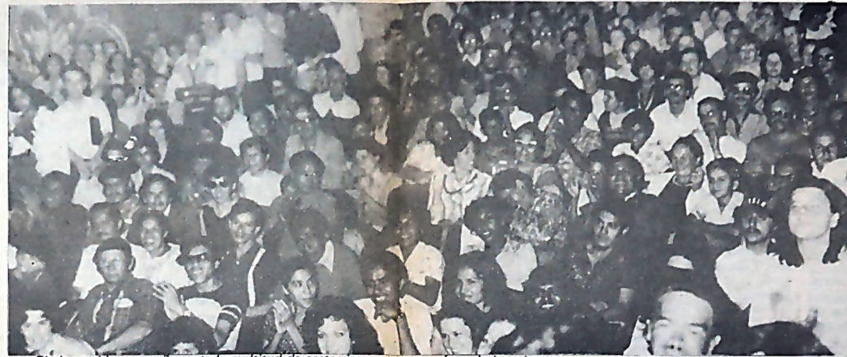
El cine se hizo pequeño, ante la multitud de costarricenses que querían saludar a los representantes del hermano pueblo nicaragüense.