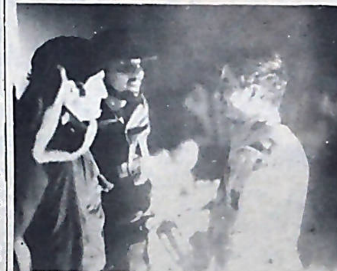
"Chirra" fue felicitado por los comandantes sandinistas.

ca de alianzas es de importancia capital, quién la hegemoniza, quién la dirige.