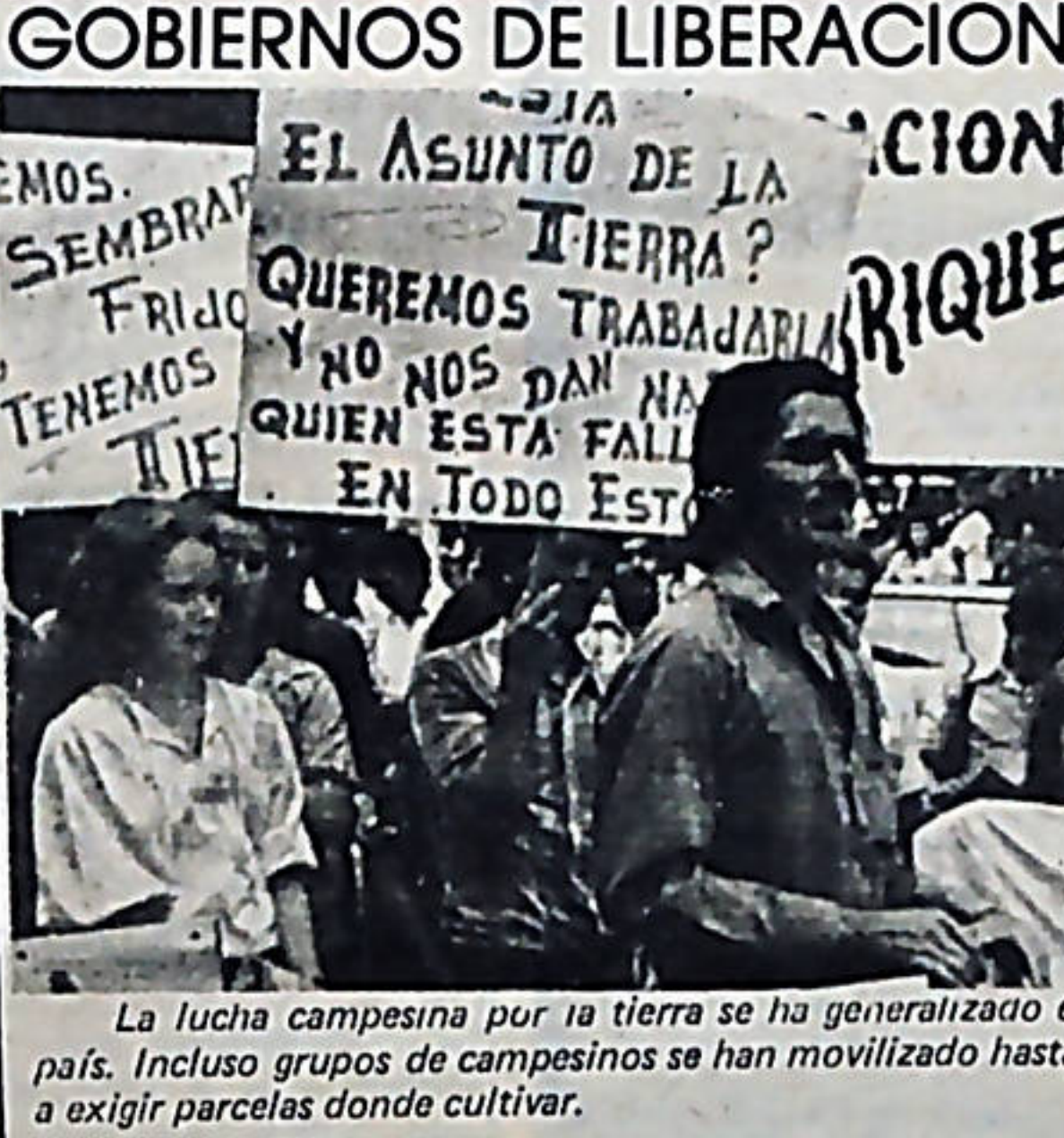
La lucha campesina por la tierra se ha generalizado en todo el país. Incluso grupos de campesinos se han movilizado hasta San José a exigir parcelas donde cultivar.