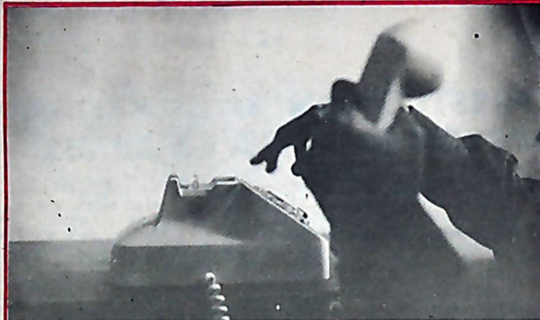
En el negocio de las centrales telefónicas la alta jerarquía marcó el tono, y la GTE respondió gustosamente.

El Instituto Costarricense de Electricidad (ICE), enfrenta hoy día una seria crisis, a raíz de las graves denuncias planteadas en los últimos días. "EL TRABAJADOR" ha venido informando a sus lectores de diferentes hechos que evidencian corrupción administrativa en millonarios negocios en que han participado altos funcionarios de esa institución, lo mismo que una política entreguista y antipatriótica que solo puede conducir a una total desnacionalización.