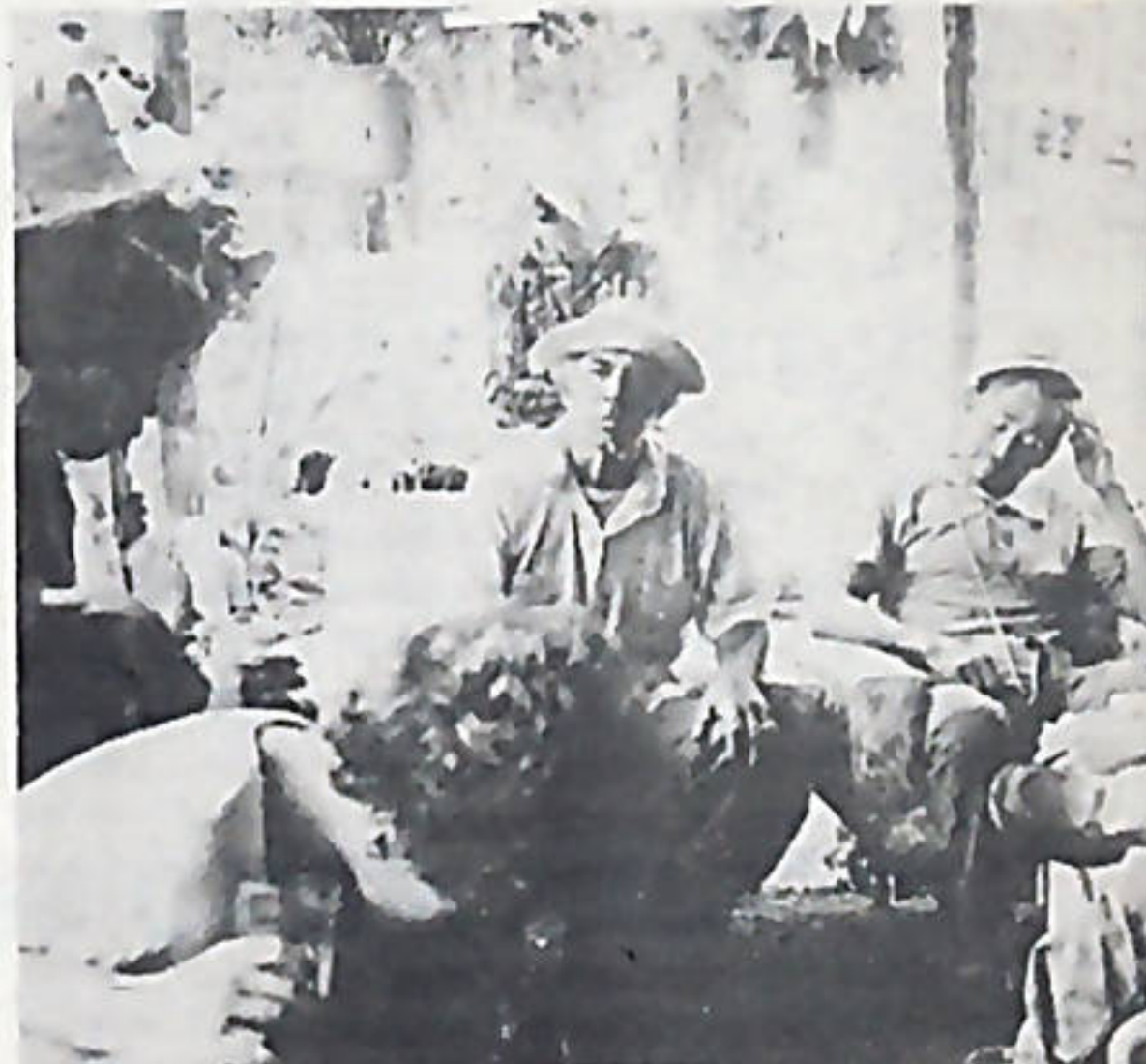
Campesinos de Tenorio, llevan varios años de luchar contra el terrateniente Jenkins.

Por otra parte, los campesinos han formado un Comité de Tenorio, el cual se reúne semanalmente con el