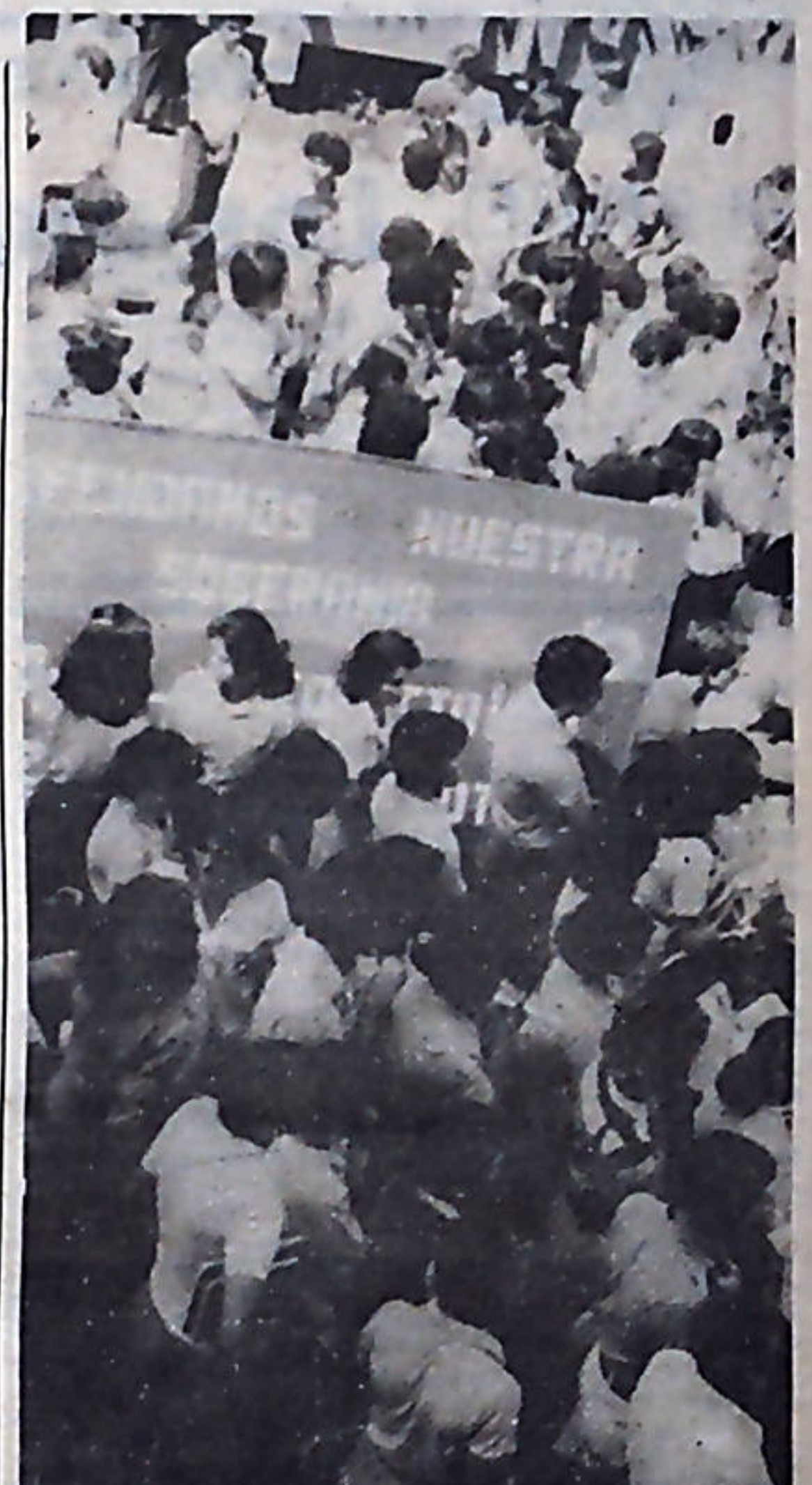
¡A defender la soberanía! Los manifestantes contra la instalación no se han hecho esperar.

Charlas, mesas redondas, y diferentes actividades tendientes a dar a conocer las desventajas del conducto interoceánico, se han realizado durante toda esta semana.