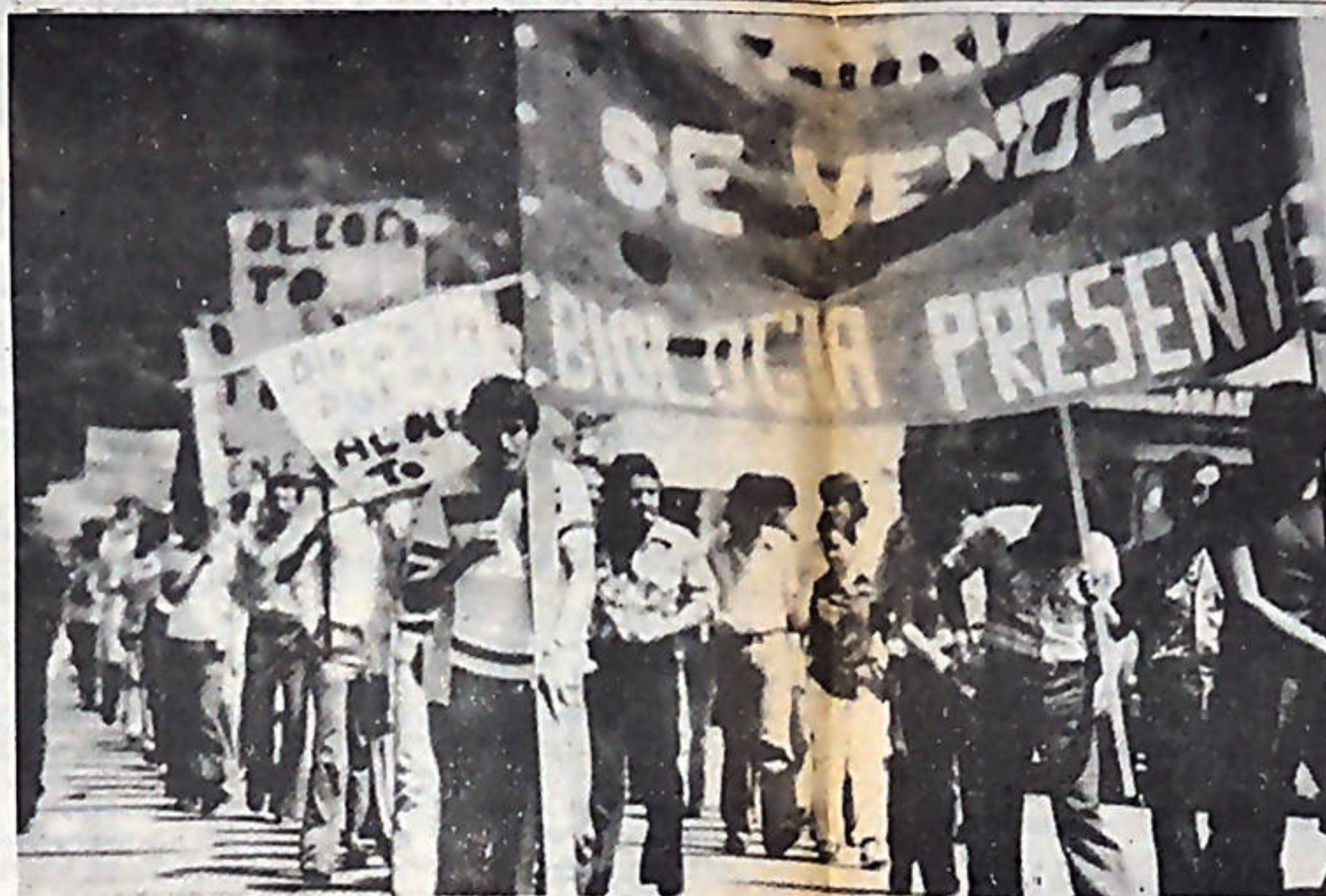
Cuando la patria está en venta, muchos sectores del pueblo costarricense se tiran a las calles a manifestar su clara oposición. En 1970 los estudiantes se lanzaron a las calles a repudiar el contrato de ALCOA. En el 74 se frenó la instalación del oleoducto, y hoy día la oposición a él crece cada día más.

Los últimos aumentos de precios decretados en los productos básicos, más la especulación y la escasez, agravan la situación a tal punto que la indignación y la protesta, quedan ya estrechas. La lucha organizada, es el mejor camino para frenar al gobierno, en su política antipopular. (Nota: El informe gráfico que presentamos muestra el índice general de precios a partir de enero de 1979. Se parte de 1966 como año de referencia (100). Los números expuestos no son porcentajes, sino el aumento, entre un mes y otro. Claro está, el gráfico señala la acelerada tendencia alcista.)