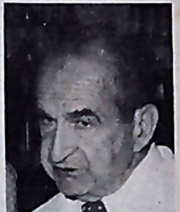
José Figueres, durante su administración también se intentó instalar el oleoducto.