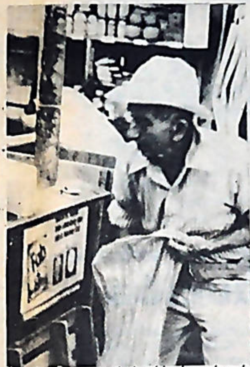
El alto costo de la vida, ha golpeado de manera directa a los bolsillos de los más humildes de este país.

inflexible y dura política, de bajos salarios para el pueblo trabajador.