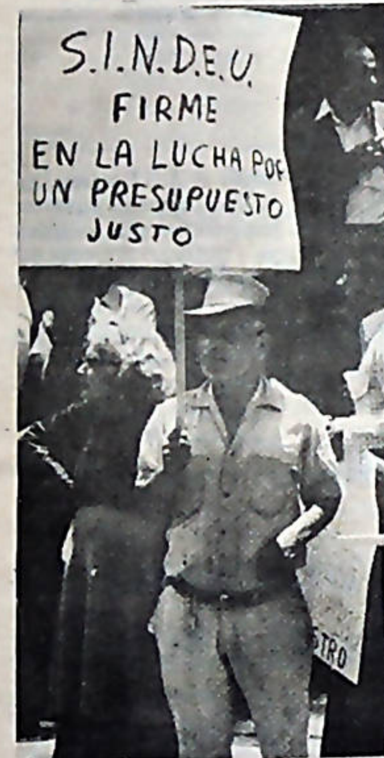
Trabajadores Universitarios también en lucha por sus derechos.