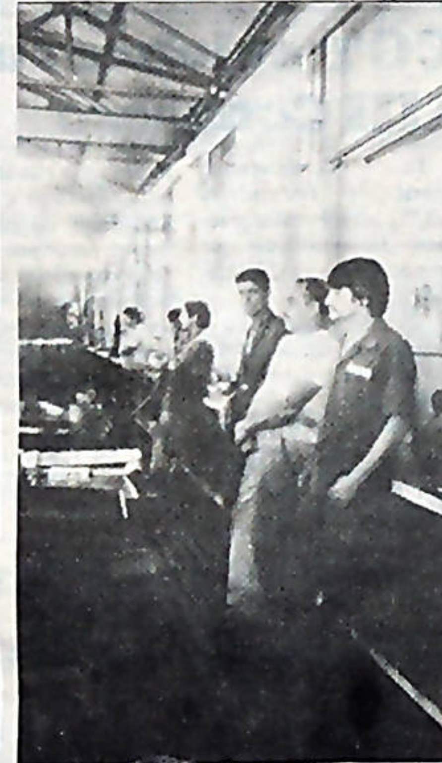
Los trabajadores del MOPT del taller central, se cruzaron de brazos, y no trabajaron hasta tanto, no vieran que sus peticiones fueran de verdad una realidad.

Como un triunfo rotundo, calificaron los dirigentes de la Asociación Nacional de Empleados Públicos (ANEP) la pasada lucha salarial. Y afirman que la enérgica combatividad demostrada en la suspensión de labores de los empleados públicos y los educadores se tradujo en una victoria resonante, según los acuerdos tomados por la Asamblea Legislativa.