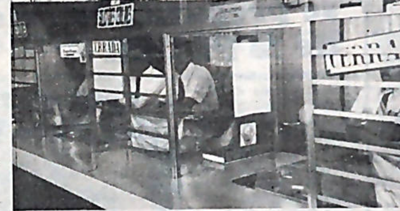
En el correo, también el paro fue total todas las ventanillas fueron cerradas.

Ministerio de Salud (Oficinas Centrales, Lucha Antivenérea, Centros de Salud de Cartago San Isidro del General, Ciudad Neilly, Buenos Aires, Ciudad Cortés, Palmar, Coto Brus, Alajuela, Turrialba,