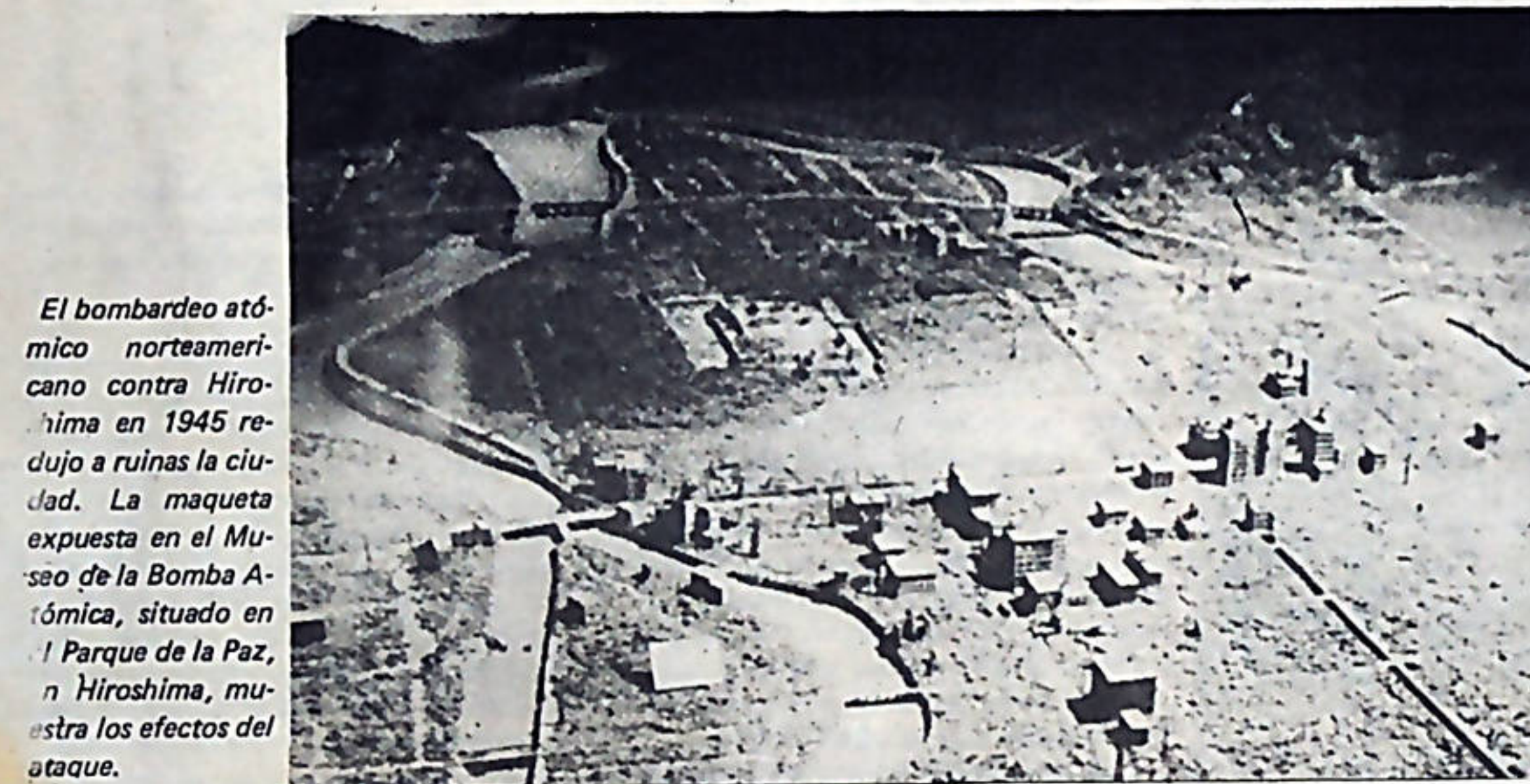
El bombardeo atómico norteamericano contra Hiroshima en 1945 redujo a ruinas la ciudad. La maqueta expuesta en el Museo de la Bomba Atómica, situado en el Parque de la Paz, en Hiroshima, muestra los efectos del ataque.