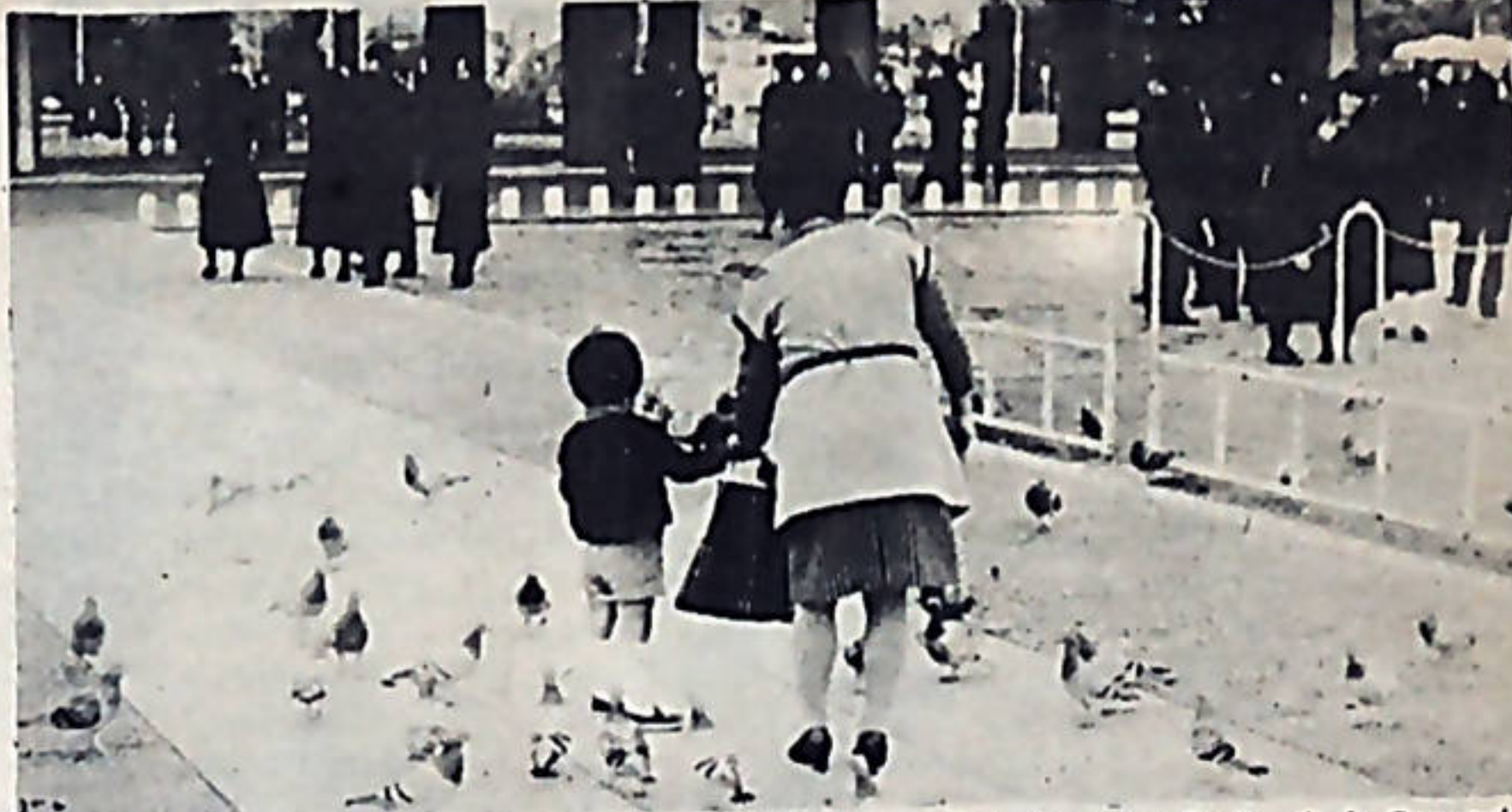
La Paloma de la Paz, de Picasso, se convirtió en un símbolo después de la Segunda Guerra Mundial. Hoy cientos de palomas en el Parque de la Paz en Hiroshima, simbolizan un constante llamamiento a la Paz.