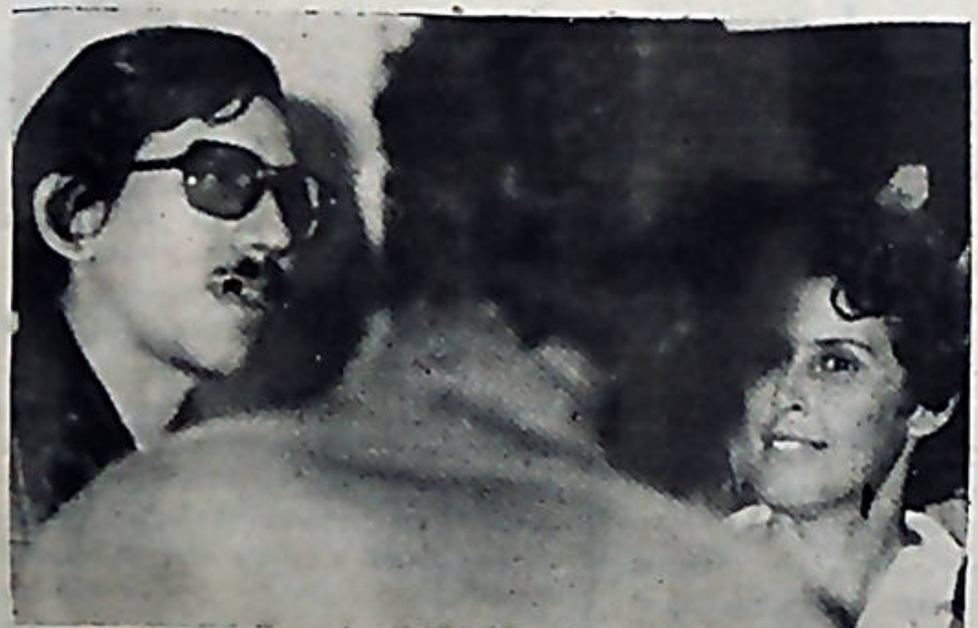
El Comandante Humberto Ortega, dirigente del FSLN, también recibió el saludo fraternal y revolucionario del MRP.