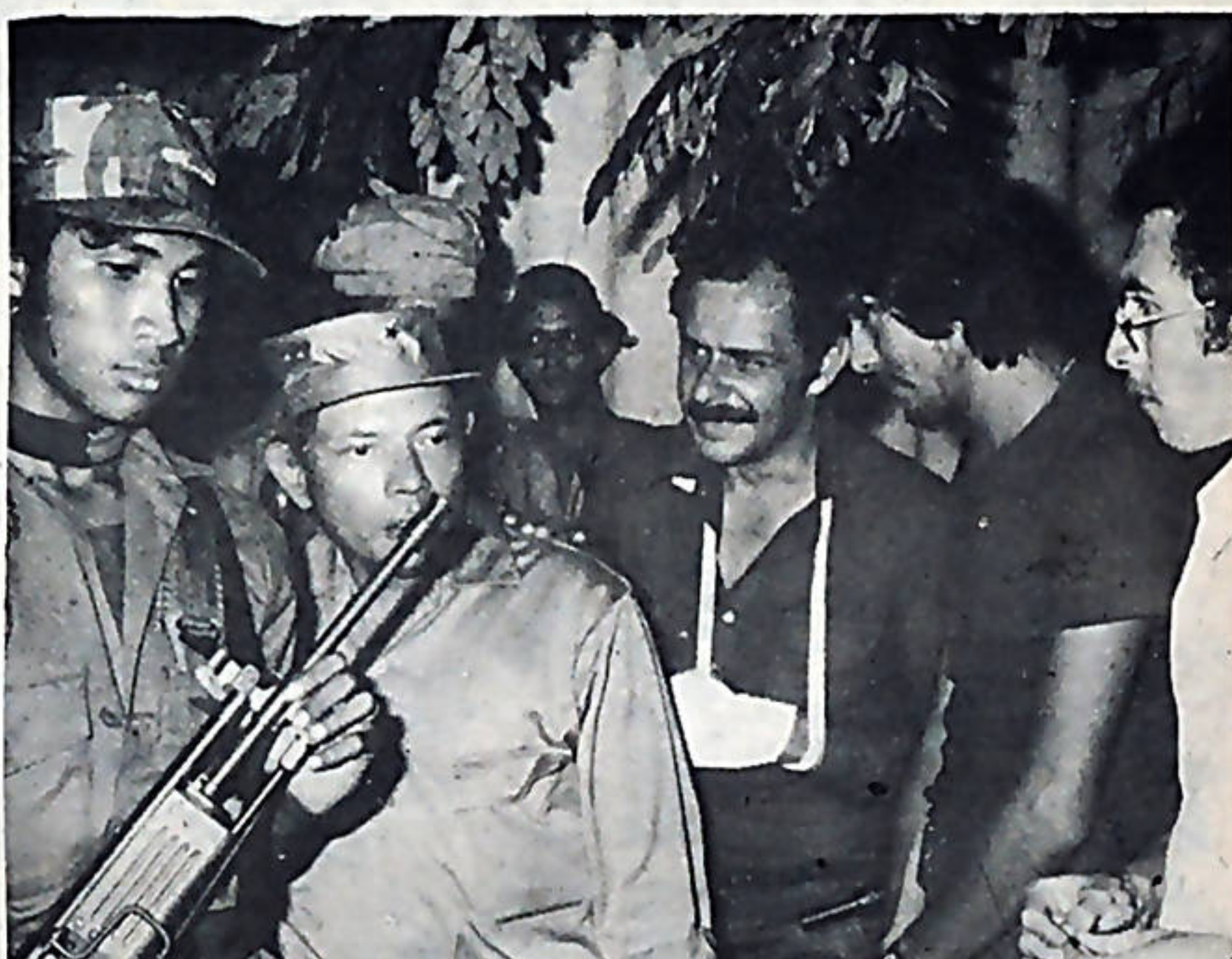
Miembros de la delegación del M.R.P. y de las brigadas Juan Santamaría en un encuentro con el comandante Tomás Borge, de la Dirección de F.S.L.N. e integrante de la Junta de gobierno nicaraguense.