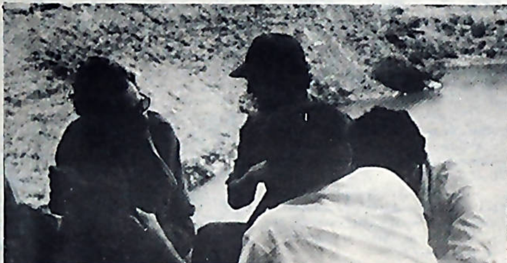
El antiguo "Bunker", la madriguera del tirano, hoy complejo militar "Germán Pomares", la delegación del M.R.P. que viajó a Nicaragua, conversaron con miembros de las Brigadas Juan Santamaría, allí destacados por el F.S.L.N.

En reciente visita a Nicaragua, redactores de "El Trabajador" conversaron con algunos miembros de las Brigadas, que ahora, después de la derrota de la tiranía cumplen diversas tareas, en la frontera, o en Managua, a las órdenes del FSLN. Algunos se quedarán en Nicaragua para las tareas que plantea ahora la revolución, otros regresarán a Costa Rica, los que son miembros del M.R.P. permanecerán allí o regresarán de acuerdo con las orientaciones del Partido y con las necesidades de la solidaridad en Nicaragua. Mucha es la experiencia que queda, algo se aportó, grande es la satisfacción de ver un pedazo de la patria centroamericana liberada, el espíritu internacionalista y fraternal de nuestro pueblo y de nuestro Partido se ha fortalecido.