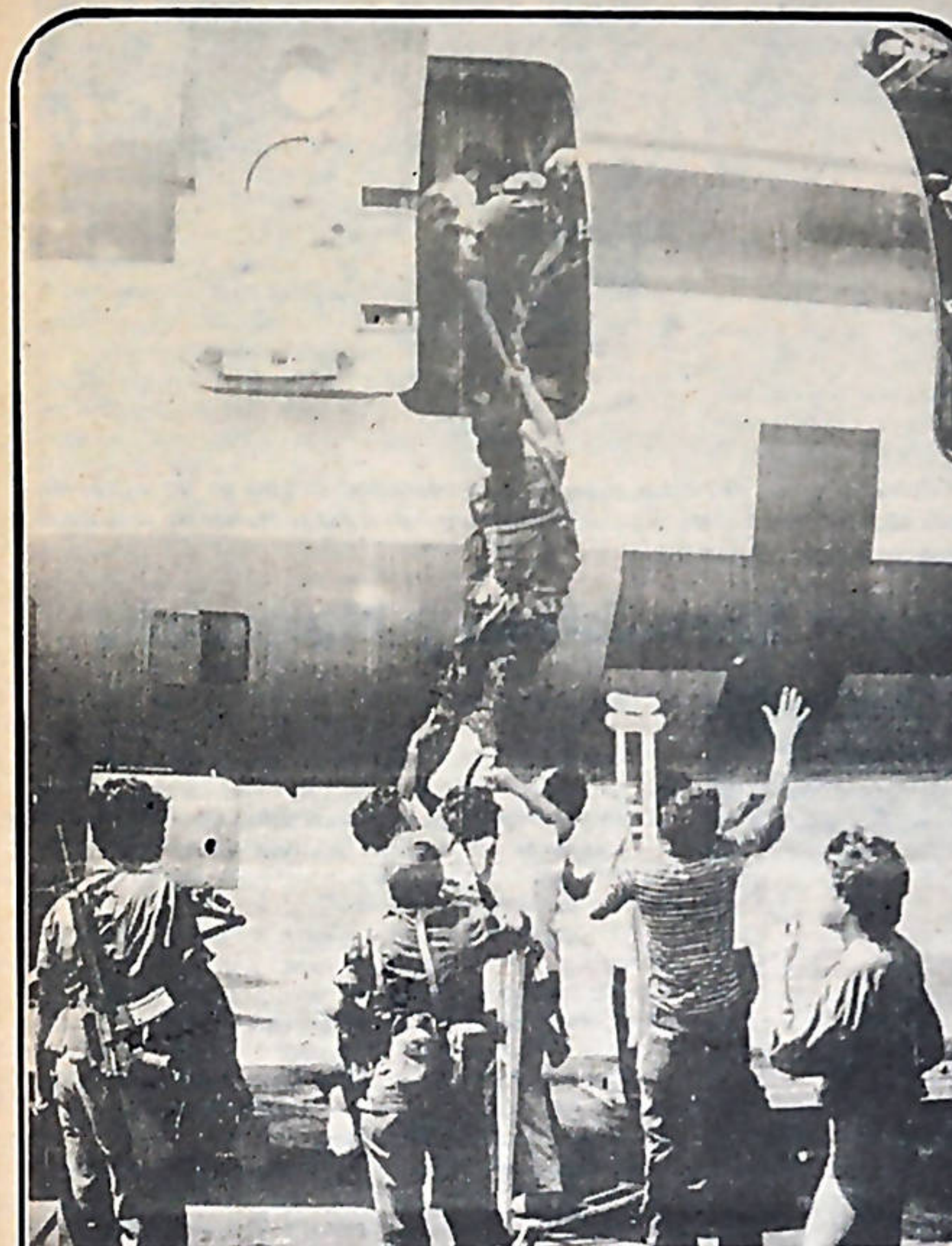
Managua, 1979: los criminales no se quieren quedar.