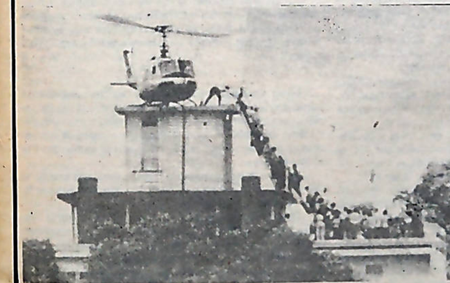
Saigón, 1975: más pasajeros que helicópteros.

Llama la atención que en ambos casos los ejércitos locales estaban apoyados, armados y entrenados por Estados Unidos. En aviones de ese país abandonaron Viet Nam del Sur y Nicaragua las tropas de Thieu y Somoza.