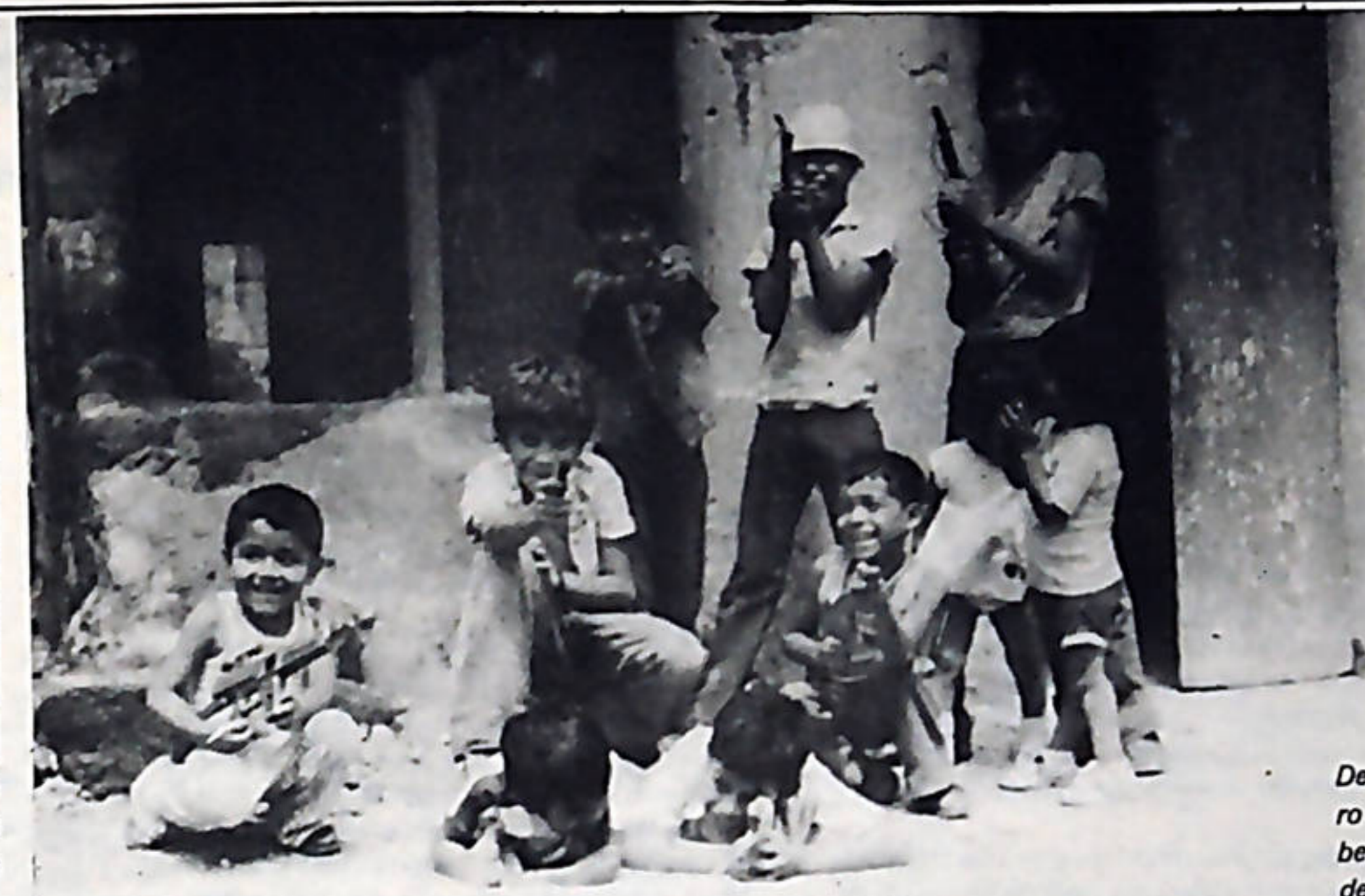
De ellos es el futuro de justicia y libertad... y sabrán defenderlo