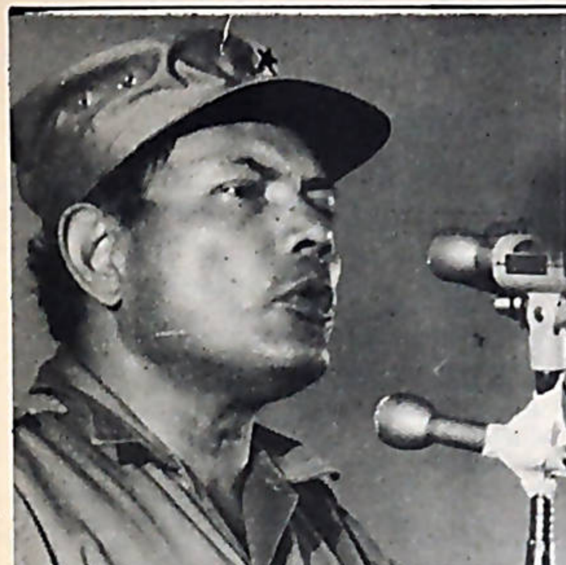
Cdte ;Tomás Borge "Con el enemigo somos implacables en el combate y generosos en la victoria, pero si el enemigo persiste seremos implacables en el combate e implacables en la victoria"

Quien visite ahora Nicaragua y mire sin prejuicios lo que ahí sucede, tendrá que reflexionar en algún momento, recordando a Sandino: "En verdad que este pueblo marcha a paso seguro hacia el sol de la libertad; los que murieron no han muerto, viven en los que siguieron luego y vivirán eternamente en la Nicaragua libre y de hombres libres en la que ya empieza a amanecer".