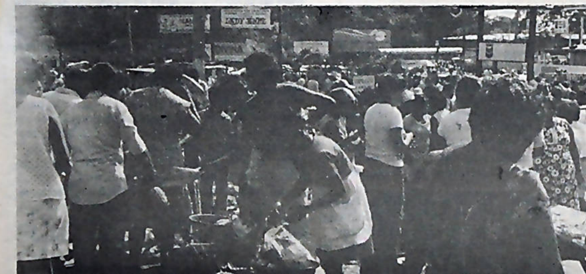
Una nueva normalidad se va logrando en la Nicaragua libre y revolucionaria que emprende la tarea de su reconstrucción.

¿Y quién se opone a que esas expropiaciones se realicen y pasen a manos de su legítimo dueño que es el pueblo? Sólo los somocistas descarados o los somocistas enmascarados podrían oponerse. Y quienes se opongan tendrán que enfrentar a un pueblo entero, heroico, aguerrido y a su vanguardia sandinista ineludible, dispuestos a defender su derecho irrenunciable a la autodeterminación.