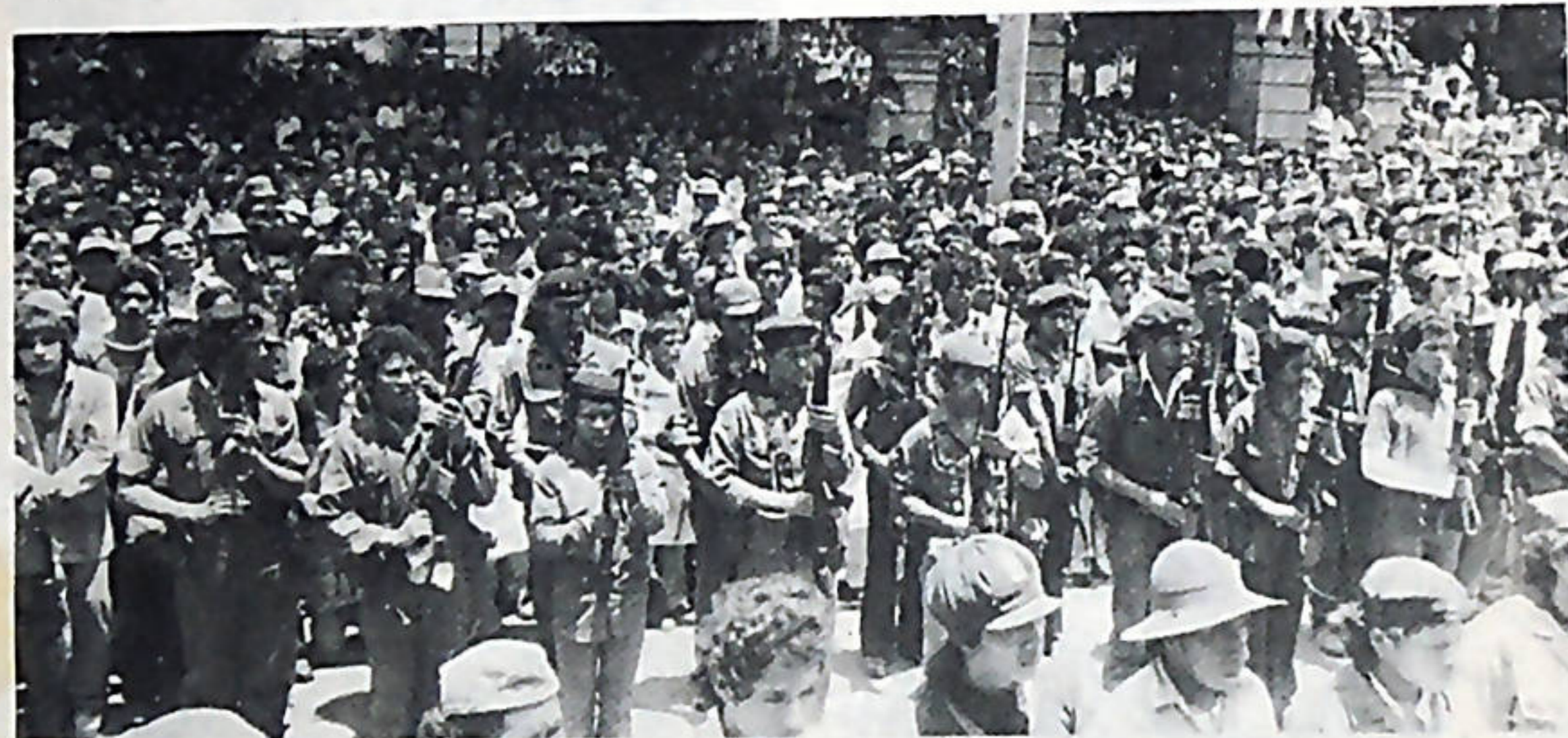
JINOTEGA : miles de campesinos, encabezados por combatientes sandinistas se manifestaron en apoyo a la reforma agraria.

se podrá lograr al sociedad de hombres libres que Sandino quería para su pueblo, y el pueblo Nicaragüense es sandinista.