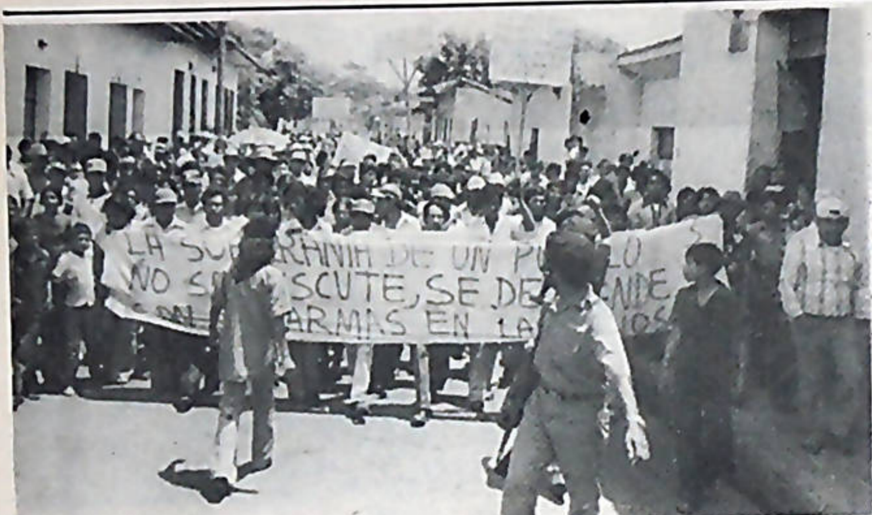
El pueblo se moviliza constantemente en apoyo a las medidas revolucionarias