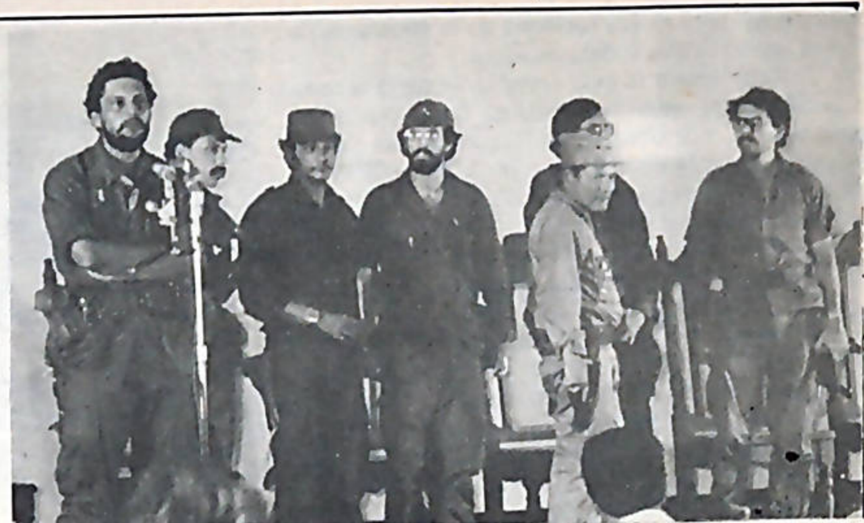
La Dirección del F.S.L.N. (Parte de ella en la foto) consolida día a día la unidad total de las filas sandinistas, vital para el desarrollo de la revolución.