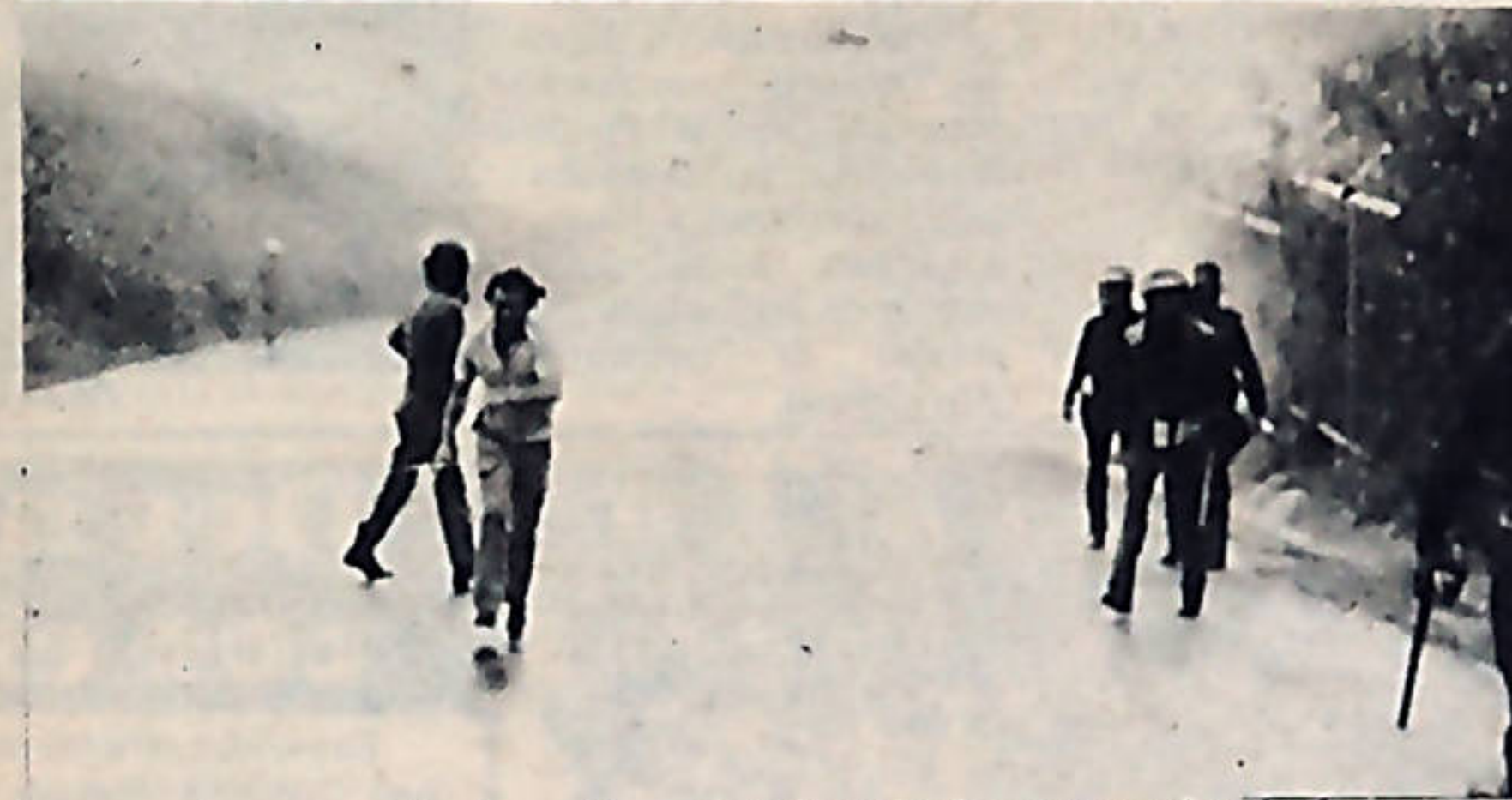
El gas y el garrote utilizados en forma brutal por las fuerzas represivas fue la respuesta a las justas peticiones de los trabajadores de Pozuelo.

Además, afirmaron que, los trabajadores en forma unánime se han manifestado a favor de la restitución del dirigente sindical a su puesto y denunciaron que "estamos dispuestos a ir a una huelga si la empresa continúa con las represalias y las arbitrariedades".