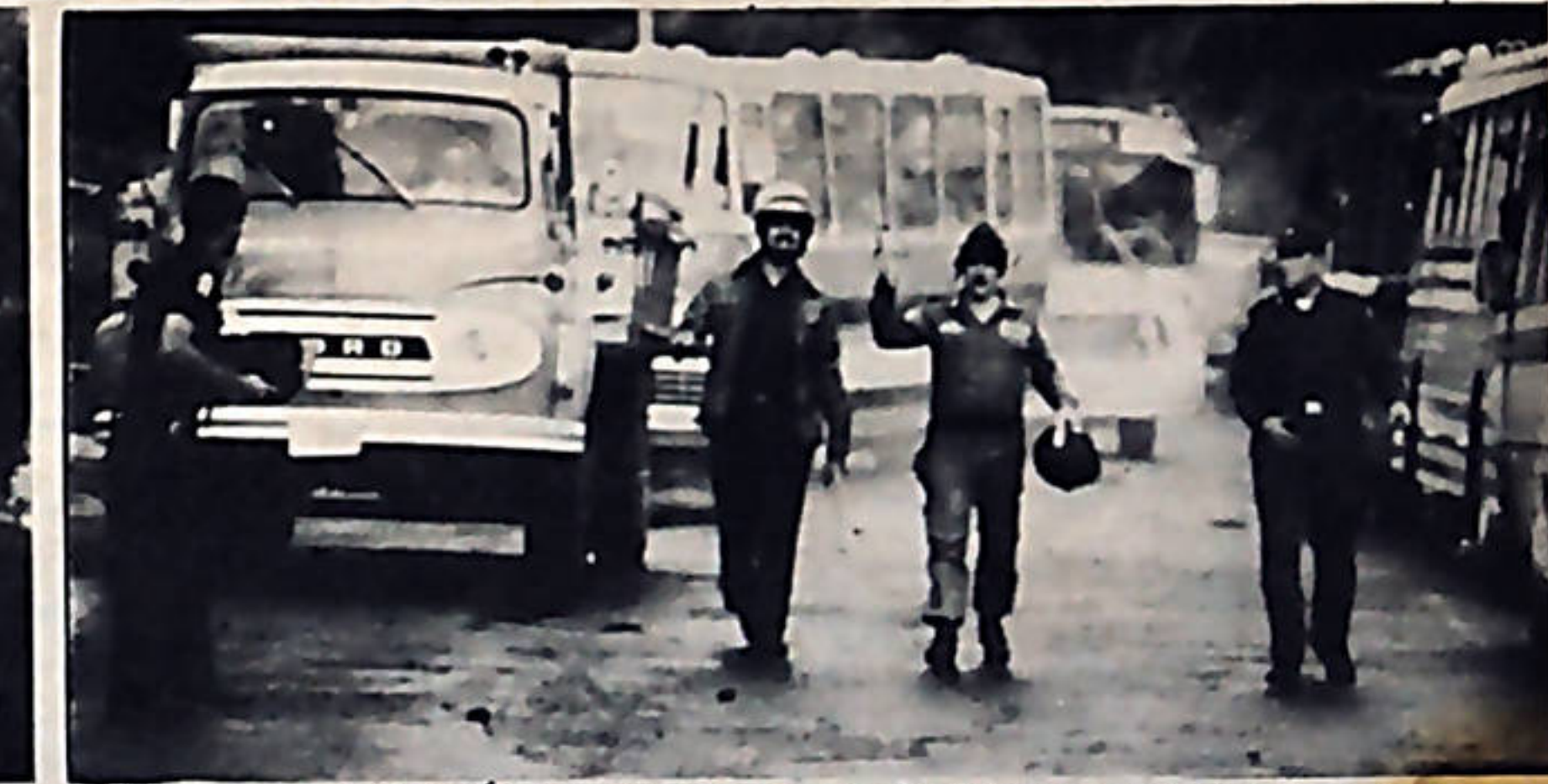
Los gases lacrimógenos se aparecieron por los alrededores de la fábrica Pozuelo. Centenas de personas que viajaban en buses resultaron afectadas.