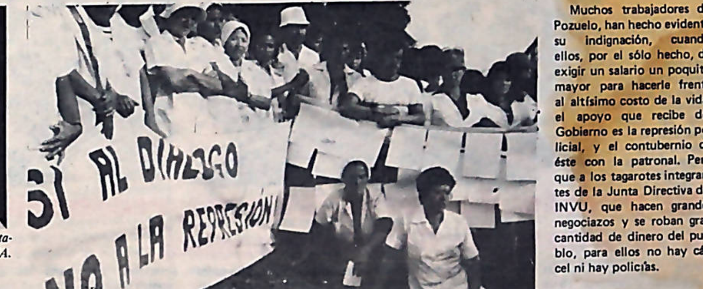
Los trabajadores de Pozuelo, reunidos en asamblea General repudiaron la represión exigieron diálogo.

lo más importante es que los trabajadores están aprendiendo al servicio de quién están las leyes, el Gobierno y la Guardia Civil en este país.