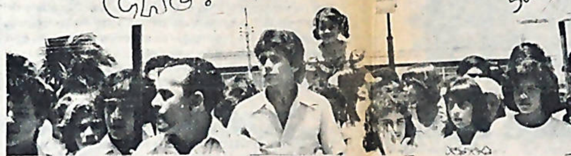
¡Qué caiga Somoza! Es el grito de todo nuestro pueblo, y de todos los pueblos del mundo.

Todos los domingos, los miembros de los comités de solidaridad de diferentes partes del país han recorrido las calles de Costa Rica solicitando colaboraciones para la lucha del pueblo de Nicaragua.