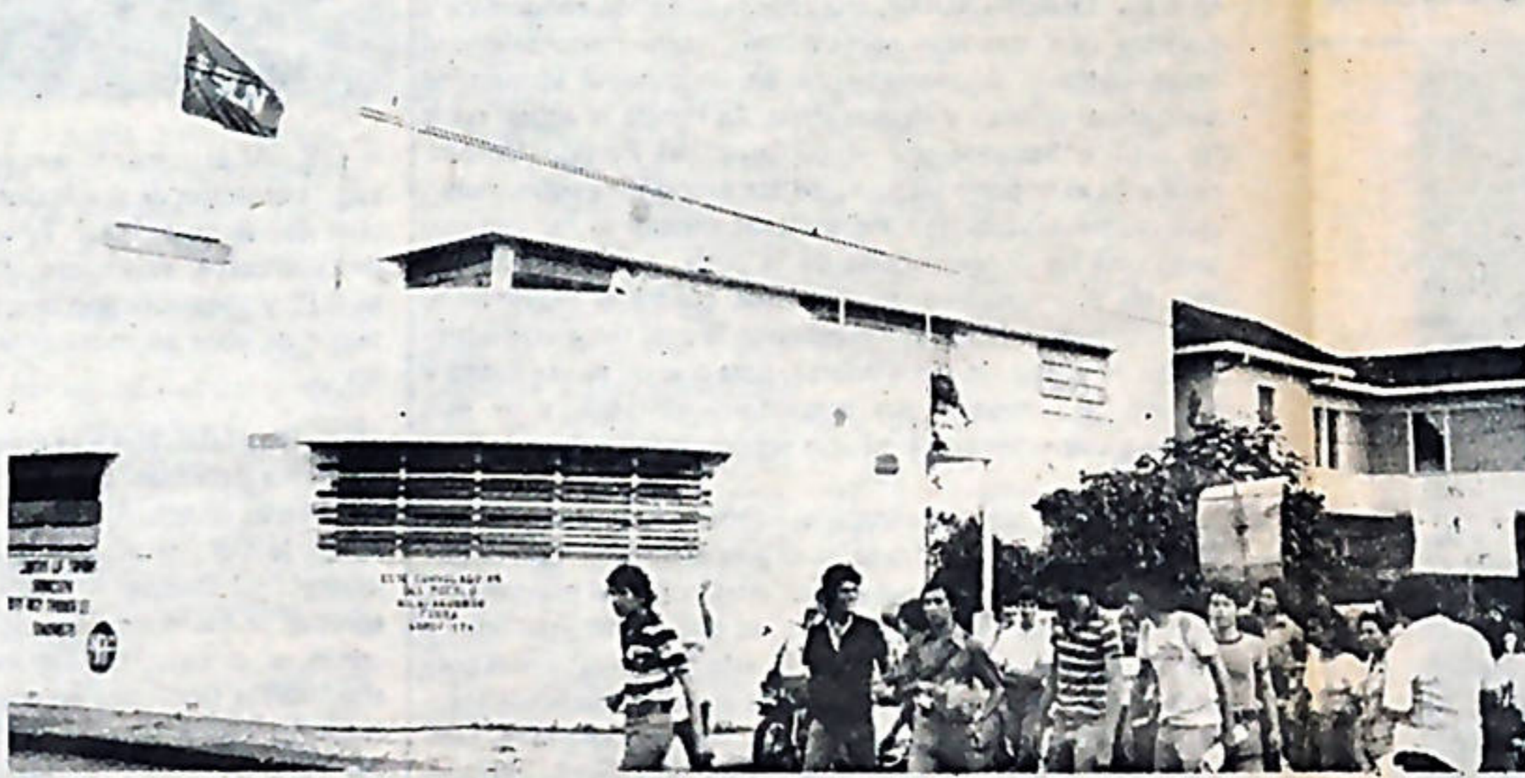
Una vista parcial del consulado nica, donde se nota la bandera del Frente Sandinista lo mismo que algunos lemas pintados en sus paredes.