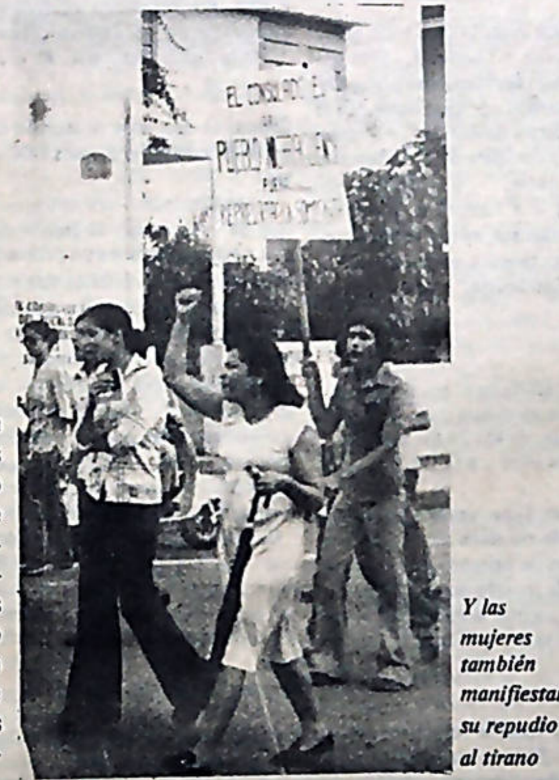
Y las mujeres también manifiestan su repudio al tirano