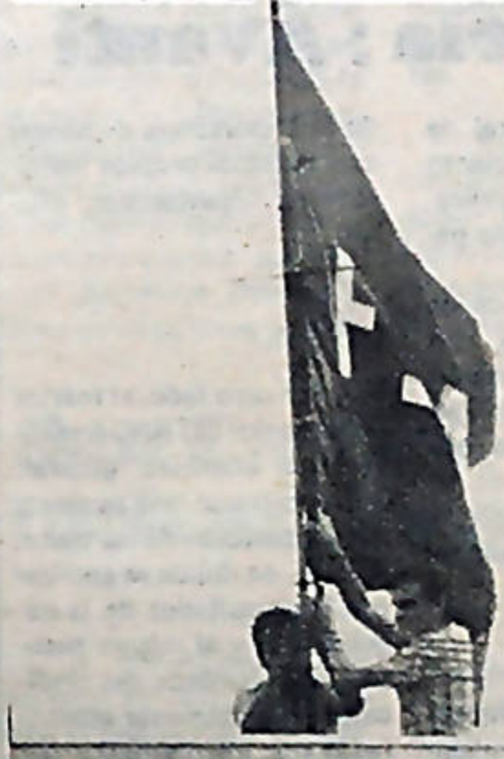
Un grupo de costarricenses izó la bandera del F.S.L.N. en el consulado nicaragüense en nuestro país. Esta bandera muy pronto será la que ondeará en todo el territorio de la patria de Sandino.

Declarar sede del Gobierno Provisional de Reconstrucción de Nicaragua fue la consigna lanzada por los jóvenes integrantes de la Juventud del Movimiento Revolucionario del Pueblo que el martes 3 de julio izaron la bandera del Frente Sandinista de Liberación Nacional en la antigua embajada somocista en San José.