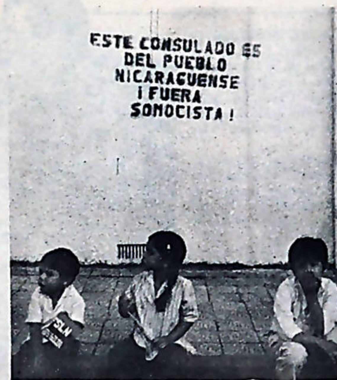
Lo mismo que en Nicaragua, los niños también son sandinistas en Costa Rica.

El tirano Somoza se ha ganado el repudio de todos los pueblos del mundo. No es casual que el genocida de Tizcaya se encuentre en estos momentos completamente aislado. Y aquellos países que le han brindado apoyo a Somoza, también se han ganado el repudio de todos los pueblos, como es el caso de Israel y de Estados Unidos.