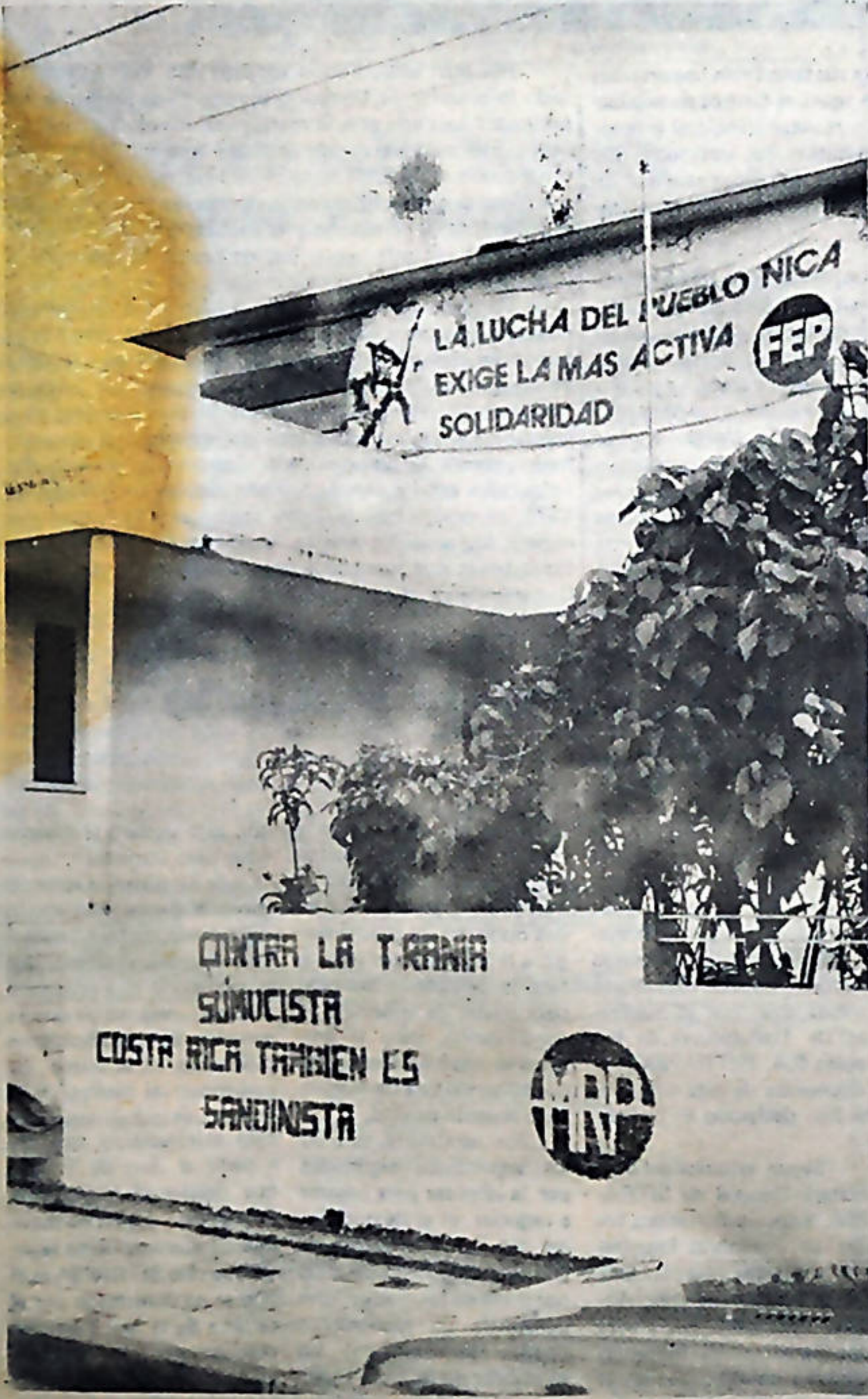
"Contra la tiranía somocista Costa Rica también es sandinista", es una consigna que recoge de verdad el sentimiento de todo nuestro pueblo.